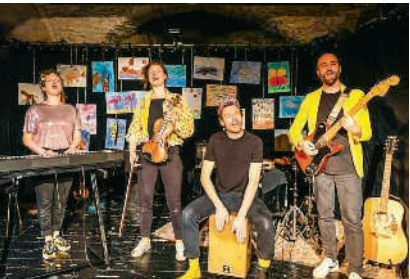
«Frischfisch» spielen für die Familie

Sonntag, 25. Januar, 15 Uhr Schulanlage Unterboden, Nussbaumen