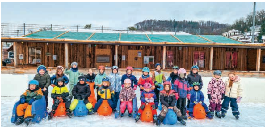
Gemeinsam auf dem Eis