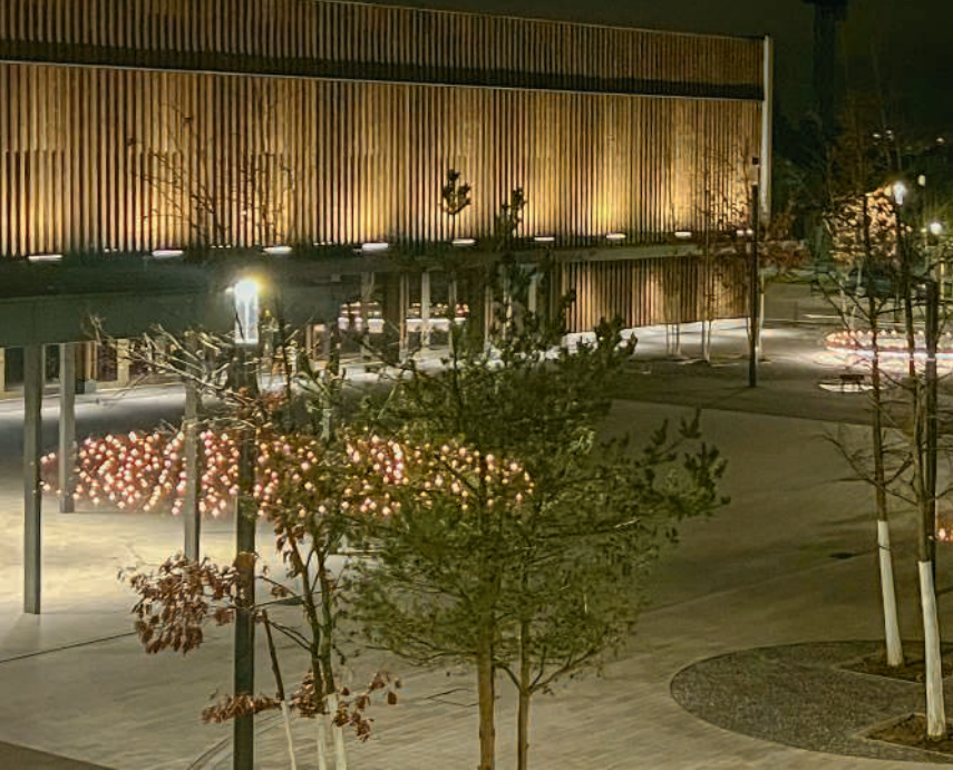
500 Kerzen vor der Festhalle