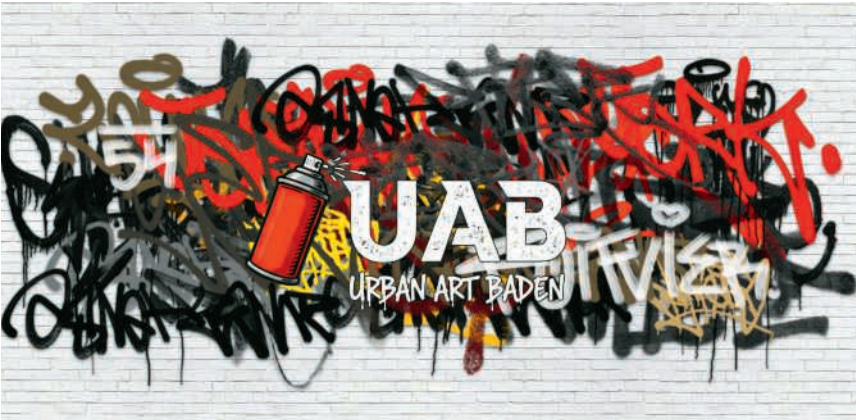
Der Verein UAB setzt sich für mehr urbane Kunst in der Region ein

Das Projekt «foifvier.art» hat sich für mehr Farbe im öffentlichen Raum eingesetzt. Seit Ende letzten Jahres wird dieses Ziel im Rechtskleid des neu gegründeten Vereins Urban Art Baden (UAB) mit Sitz in Brugg verfolgt, der sich nach wie vor für Kunst im urbanen Raum einsetzt. Sein Hauptziel ist es, die Region Baden bunter zu gestalten, durch Aufwertungen von Gebäuden und Ortsbildern mit langfristig angelegten Kunstwerken. Urbane Kunst – die legale Art von Graffiti und Wandmalereien – ist heute nicht mehr aus dem Alltag städtischer Gegenden wegzudenken und ist auch im Raum Baden häufig anzutreffen. Durch Zusammenarbeit mit den Behörden weicht der Vandalismus anschaulicher Kunst. Im Rahmen des Projekts «Müllerbräu» werteten die heutigen Vereinsmitglieder beispielsweise 2021 die