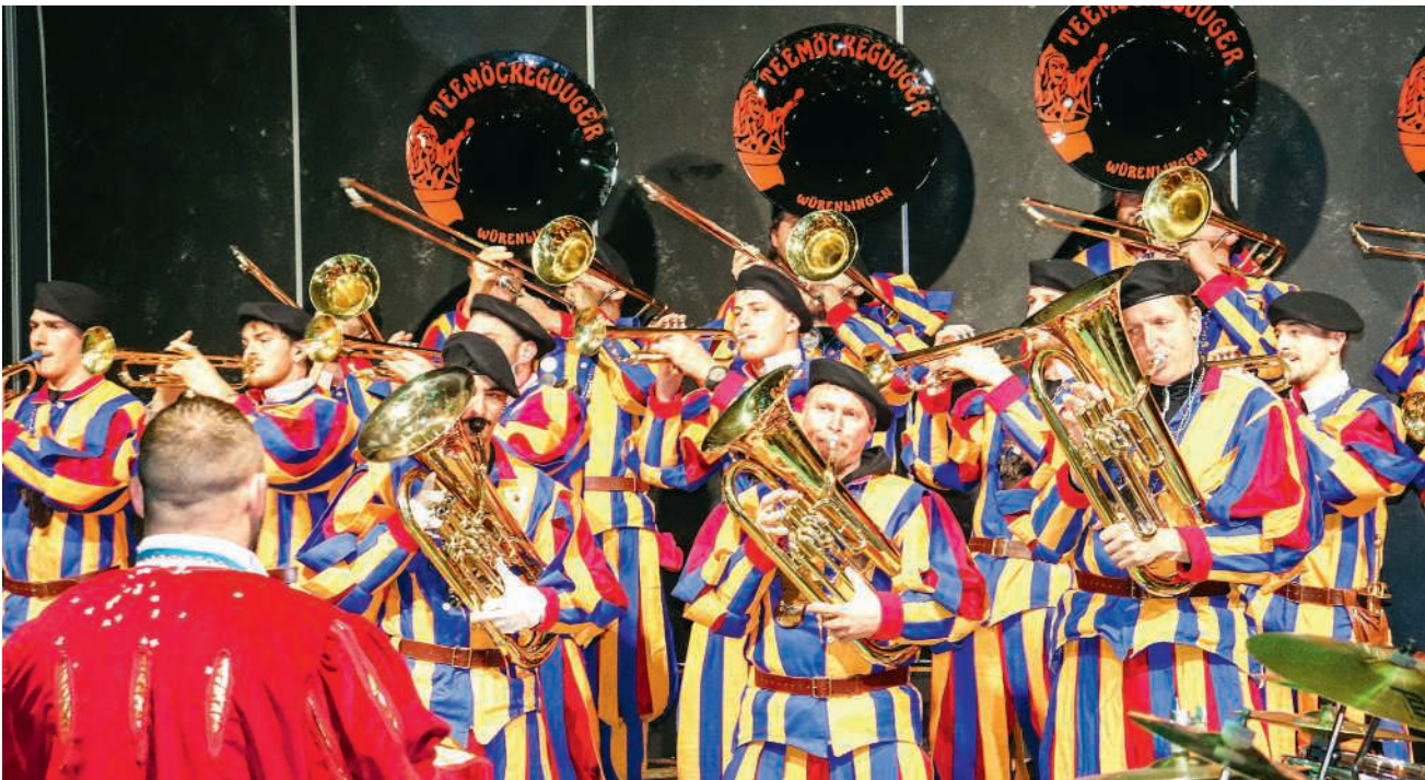
Die «Teemöckeguuger» sorgten für die musikalische Unterhaltung

Kinder zum Leuchten. Lange stillsitzen musste niemand, denn hier wurde getanzt, gelacht und wild gefeiert. Musikalisch ging es ebenfalls zur Sache. Die «Teemöckeguuger» sorgten mit ihrem Auftritt für laute Töne und gute Stimmung. Nicht nur die kleinen Gäste wippten begeistert mit, auch die Erwachsenen hatten sichtlich ihren Spass. Für den kleinen Hunger zwischendurch war ebenfalls gesorgt. Der Eintritt für den Kindernachmittag war kostenlos, was viele Familien nutzten. Organisiert wurde der Anlass von der Fasnachtsgesellschaft Würenlingen, zusammen mit der Guggenmusik «Eichlefääger». Gemeinsam sorgten sie für einen gelungenen Auftakt der Fasnacht. Die Kinderfasnacht eröffnete die närrische Zeit mit einem kräftigen «Yee-haw!» und Würenlingen war für einen Nachmittag garantiert der fröhlichste Ort im «Wilden Westen». Am Abend folgte dann mit Nachtessen und viel Musik die Eröffnungsfeier der Erwachsenen.