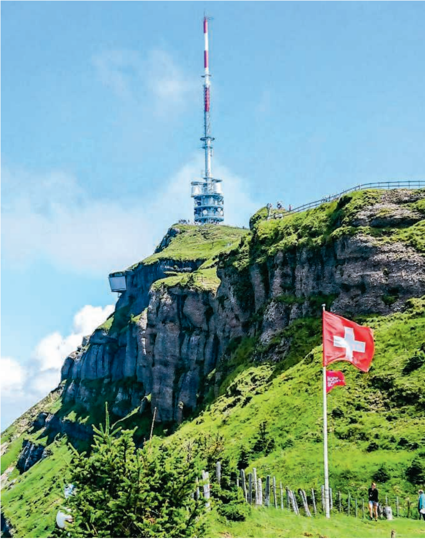
Welche Empfangstechnologie darf es sein?