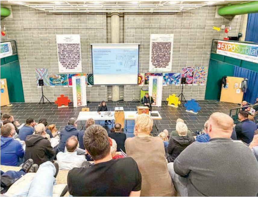
Informationsveranstaltung im Oktober 2025 für Ausstellende

Freitag, 23. Januar, 19.30 Uhr Katholische Kirche, Nussbaumen