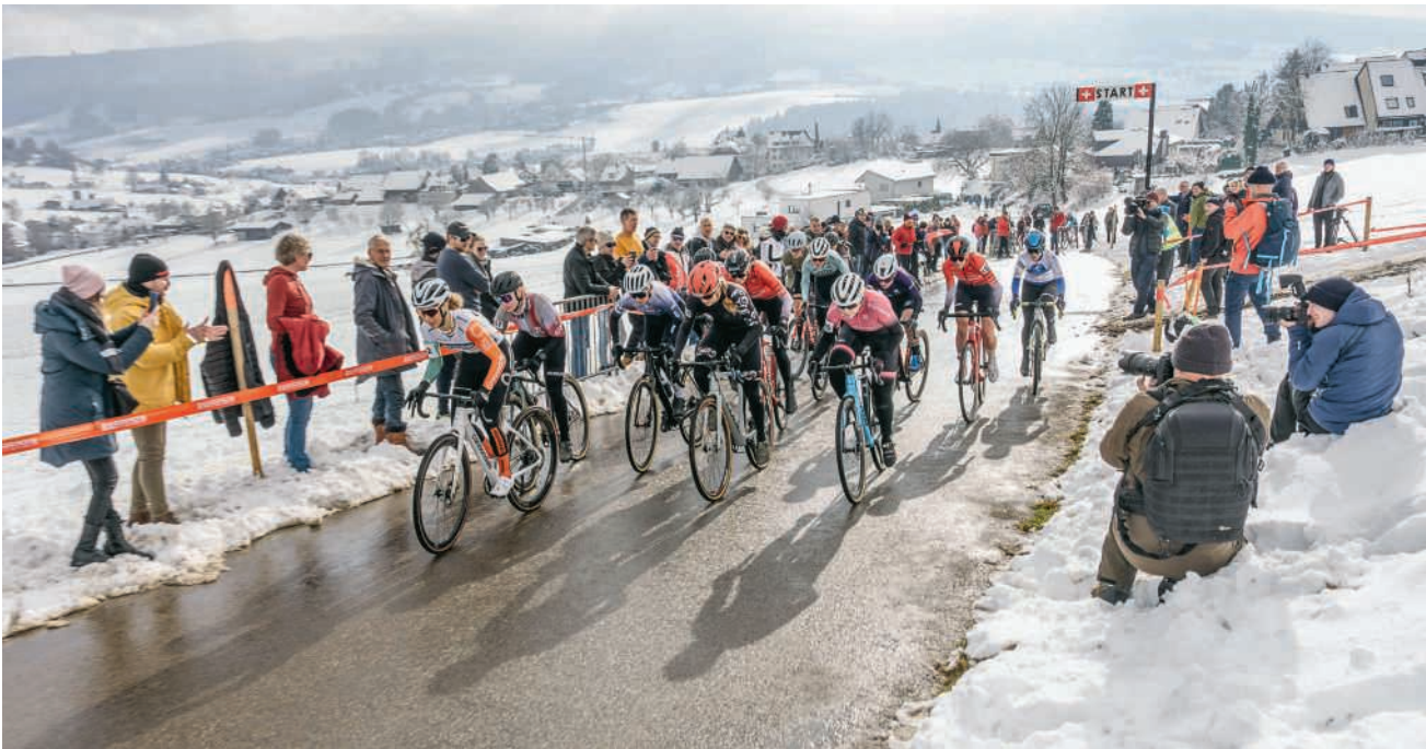
Winterliche Bedingungen in Schneisingen

Die Schweizer Radquer-Meisterschaften am vergangenen Wochenende boten alles, was das Radquer-Herz begehrt. Kalte Temperaturen sowie eine technisch wie physisch anspruchsvolle Strecke im Schnee forderten das Starterfeld auf allen Ebenen. Bei den Frauen wurde der Dreikampf zwischen den Altmeisterinnen Alessandra Keller und Jolanda Neff sowie Titelverteidigerin Rebekka Estermann mit Spannung erwartet. Zu einem offenen Dreikampf kam es jedoch nicht: Alessandra Keller setzte bereits in der zweiten Runde zur entscheidenden Attacke an und liess der Konkurrenz keine Chance. Mit über einer Minute Vorsprung fuhr sie souverän zum Sieg und sicherte sich damit ihren fünften Schweizer Meistertitel im Radquer. Hinter Keller entwickelte sich ein intensiver Kampf um Platz zwei, in dem sich Jolanda Neff bis zum Schluss ein enges Duell mit Rebekka Estermann lieferte und sich schliesslich durchsetzen konnte, wie es in einer Mitteilung heisst. Nach dem Rennen zog Keller ein positives Fazit: «Ich bin sehr zufrieden, wie ich gefahren bin. Ich fühlte mich gut und fuhr auch technisch sauber. Es ist mein erstes Radquerrennen in dieser Saison und umso glücklicher bin ich, dass ich meinen vierten Titel nach Hause nehmen