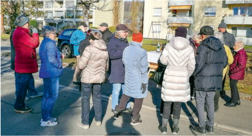
Bestes Wetter am Neujahrstag