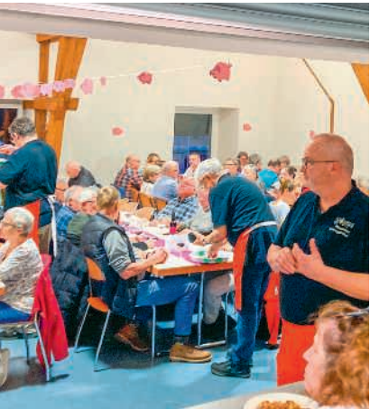
Geselligkeit mit dem Männerchor Untersiggenthal

Samstag, 24. Januar, 11 bis 20 Uhr Im Saal von Wein & Gemüse Umbricht, Dorfstrasse 55, Untersiggenthal