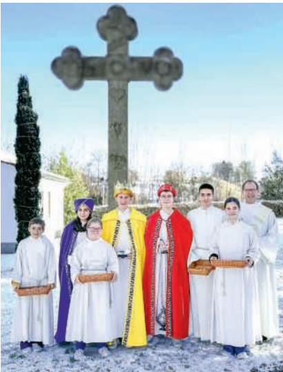
Dreikönigsgottesdienst in Würenlingen