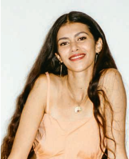
Musikerin Leila Moon gehört zu den Top-Acts des diesjährigen OOAM

Jeweils im Februar lädt das One-Of-A-Million-Musikfestival – kurz OOAM – während über einer Woche Besucherinnen und Besucher zu einer musikalischen Entdeckungsreise ein. Dabei verwandelt sich die Stadt Baden in eine Bühne und füllt sich mit den unterschiedlichsten Klängen. Dazu werden auch wieder Orte bespielt, die normalerweise nicht für Auftritte und Konzerte genutzt werden. Das diesjährige Festival bringt 43 Acts aus 19 Ländern nach Baden, die an 19 verschiedenen Orten auftreten werden. Das Festival findet von 6. bis 14. Februar statt und sorgt erneut in versteckten Räumen für unerwartete Begegnungen. Gespielt wird mitunter