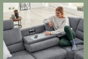
Funktionsablage gegen Mehrpreis.