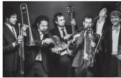
The Hot Teapots