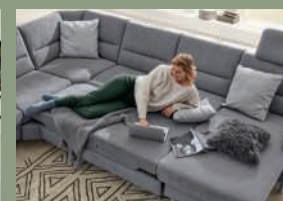
Schlaf funktion gegen Mehrpreis.