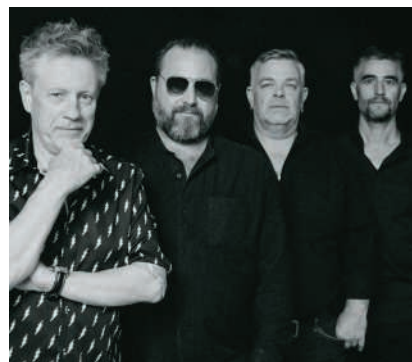
Das Mundart-Kollektiv Gross in Japan

Donnerstag, 19. Februar, 18 Uhr Coco Baden