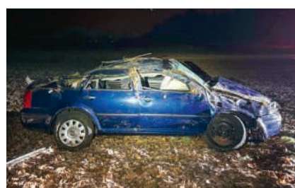
Der Unfallort auf der Industriestrasse