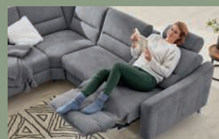
Wandfrei-Relaxfunktion gegen Mehrpreis.

1| Interliving Sofa Serie 4305, Bezug Stoff Miro silver, Metallfuß alufarbig, best. aus: 2,5-Sitzer mit Armteil links, Rücken Spannstoff, Rundecke, 2,5-Sitzer ohne Armteil, Rücken Spannstoff und Canapé mit Armteil rechts. Stellmaß ca. 258x326x170 cm. 1476032502