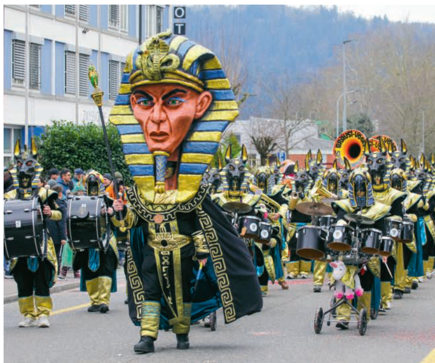
Momentaufnahme des buntes Fasnachtstreiben letztes Jahr

Ab 18.15 Uhr, Baden: Guggennacht; Schlossbergplatz, Cordulaplatz und Löwenplatz