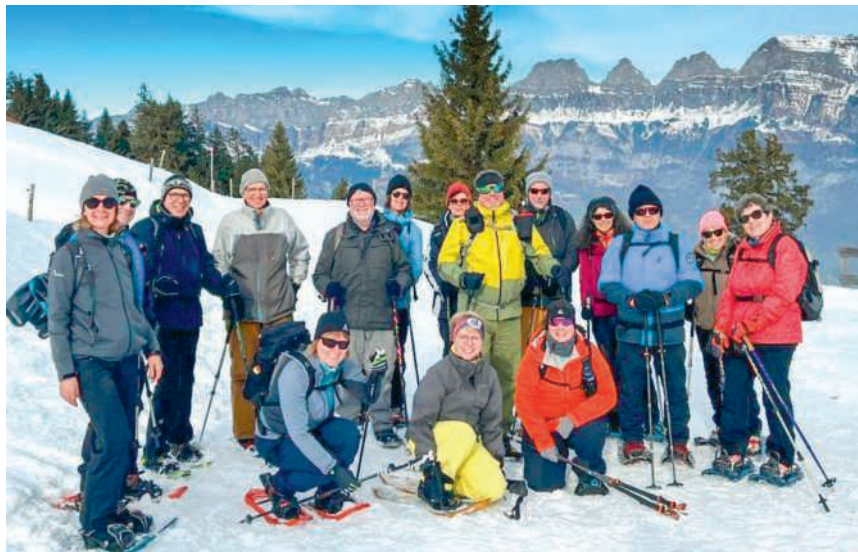
Der Jogging Club auf der Wanderung