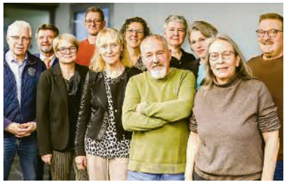
Das Organisationskomitee von «Hello, Dolly!», der neusten Produktion der Fricktaler Bühne