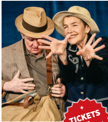
Max und Margot

Das Vorjahresergebnis wurde 2025 in Mönthal nicht ganz erreicht, der Steuerabschluss darf sich trotzdem sehen lassen, wie die Gemeinde schreibt. Mit dem Steuerertrag von total 1,23 Millionen Franken konnte die Budgetvorgabe von 1,19 Millionen Franken um 44'312 Franken oder 3,72 Prozent übertroffen werden. Das ist vor allem auf höhere Nachträge aus den Vorjahren sowie auf die Gewinn- und Kapitalsteuern juristischer Personen zurückzuführen. Der bereinigte Steuerausstand hat im Vergleich zum Vorjahr zugenommen. Vom fakturierten Steuersoll sind Ende des Jahres 16,44 Prozent im Ausstand. Mit diesem Wert liegt Mönthal über dem Kantonsmittel von 14,55 Prozent. GA