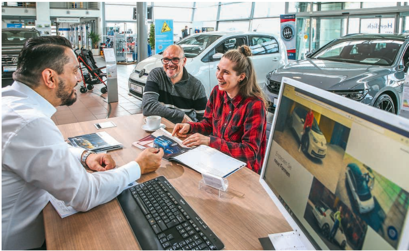
Neue Finanzierungsmodelle wie das Autoabo sind hierzulande eine Randerscheinung

Sagistrasse 1a, 5425 Schneisingen Tel. 056 241 17 11 www.kreisel-garage.ch