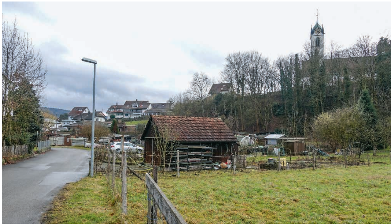
Am 8. März wird über die Zukunft des Vorderen Chilefelds abgestimmt

Unterdessen haben die Parteien und Interessengruppen ihre Positionen bezogen und mit Flyern oder Medienmitteilungen ihre Empfehlungen abgegeben. In einem Communiqué vom 16. Februar haben sich zum Beispiel die Grünen klar für die Vorlage ausgesprochen. Die Partei bezeichnet sie als «verantwortungsvolle Lösung», die für finanzielle Vernunft und eine Boden- und Wohnungspolitik im Sinne einer familienfreundlichen Gemeinde steht. Das Vorder Chilefeld gehöre zu