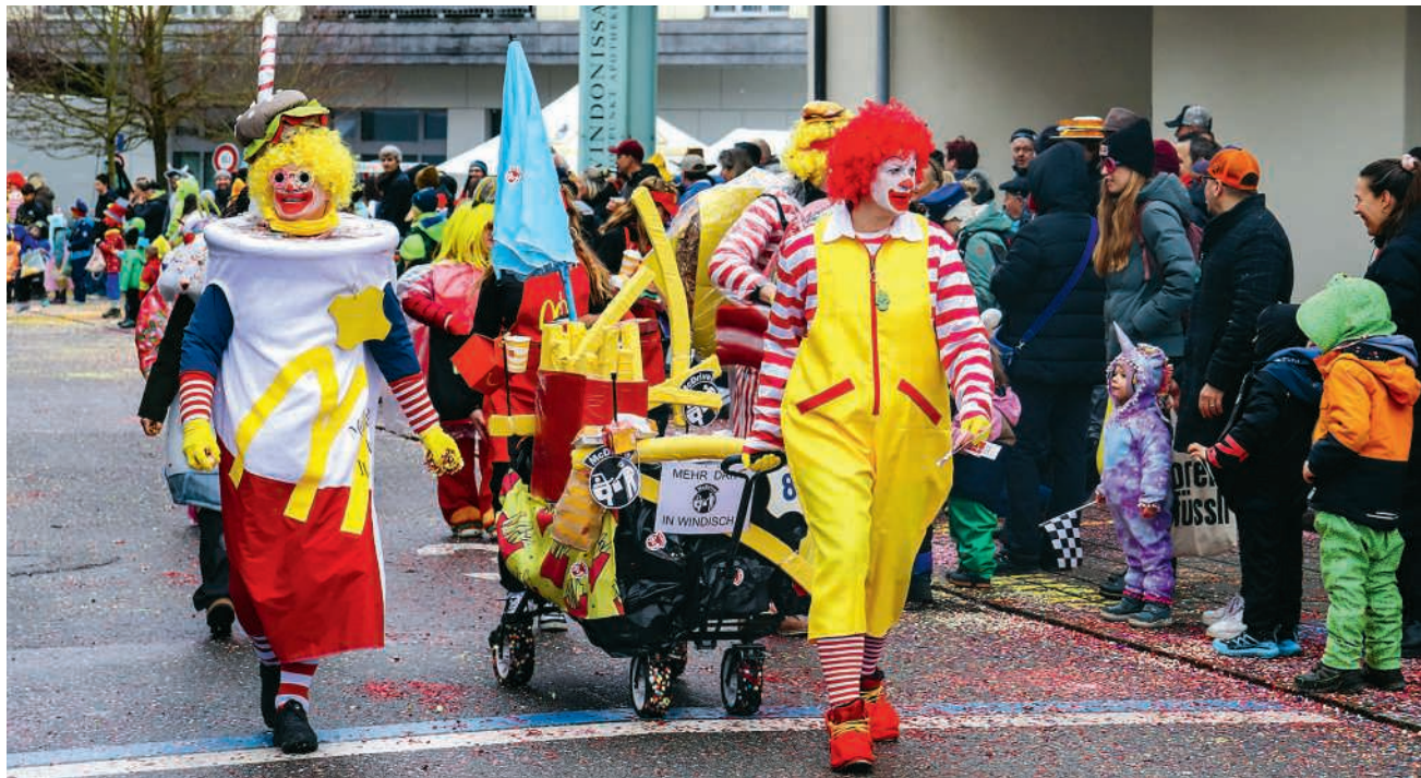
Windisch stand am Samstag ganz im Zeichen der Fasnacht

Nach dem Umzug ging das närrische Treiben im und um das geheizte Festzelt weiter. Es gab weitere Guggenauftritte, einen Malwettbewerb sowie Spiel und Spass für Kinder mit der Kita Sonneschii. Den stimmungsvollen Abschluss bildete am Abend die legendäre Gruftibar, die ihre Tore öffnete. Hier feierten die Windischer und ihre Gäste bis spät in die Nacht – wie es sich für die fünfte Jahreszeit gehört.