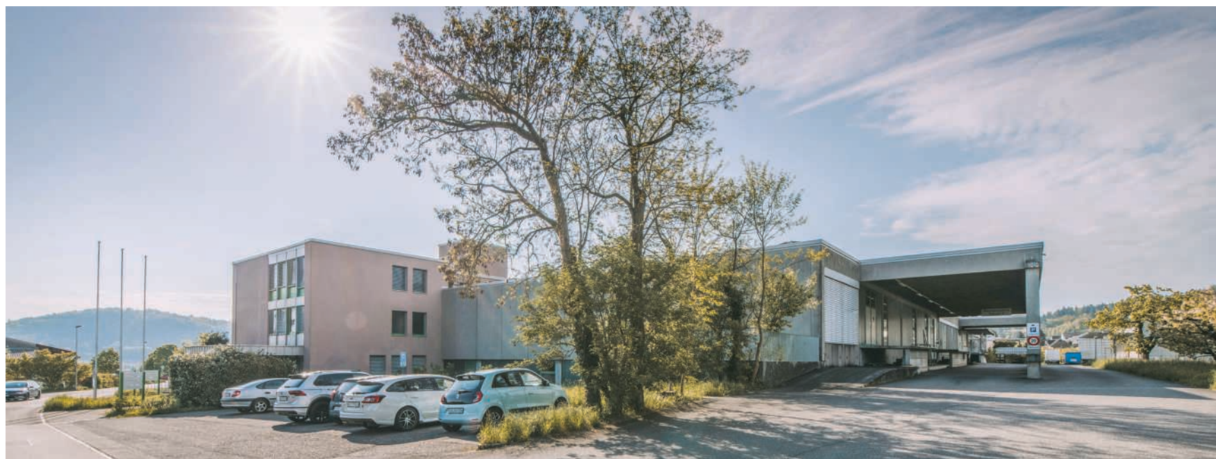
Der Hauptsitz der Constri AG in Schinznach-Dorf

Die Zusammenarbeit zwischen Constri und Frezzo hat sich über mehrere Jahre entwickelt, Ausgangspunkt war der Einkauf der in der Schweiz von der Constri AG vertretenen Produkte der niederländischen Marke Exit Toys durch die Frezzo AG. Mit der nun angekündigten Integration werde die Marke Frezzo weiterhin eigenständig geführt und künftig als Teil der Sparte «Constri Outdoor» positioniert. Der bestehende Marktauftritt der Marke bleibe erhalten. «Frezzo ergänzt das Sortiment ideal mit einem breiten Angebot an Trampolinen, Spielhäusern, Velos, Velohelmen, Scootern, Outdoorbekleidung und vie-