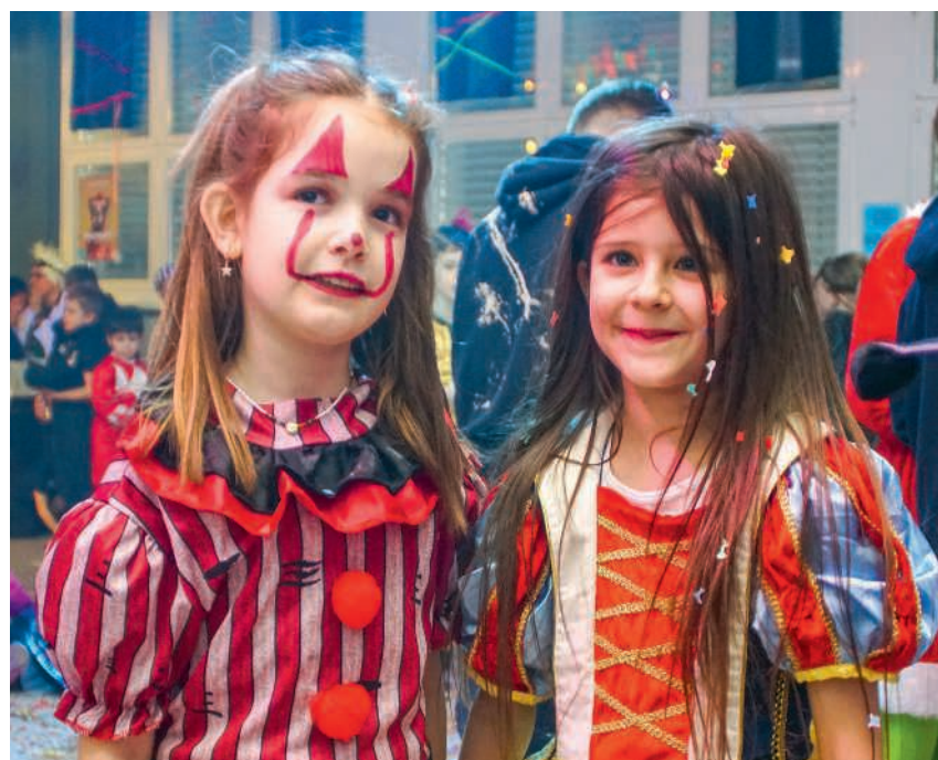
Zahlreiche geschminkte und kostümierte Kinder feierten Fasnacht

Die Turnerschar des STV Remigen hatte keine Mühen gescheut, um für den alljährlichen Maskenball einen stimmungsvollen Rahmen zu schaffen. Und ab 16 Uhr strömten sie dann in die Turnhalle: die fasnächtlich maskierten, kostümierten und geschminkten Kinder mit ihren Müttern und Vätern. Eine als farbiger Bär verkleidete Animatuerin ermunterte den Nachwuchs, zu den vielen unverkennbaren Fasnachtshits zu tanzen, unterbrochen wurde der Partysound nur vom fulminanten Auftritt der Hornfänger aus Leuggern. Als Highlight entpuppte sich ausserdem die grosse Konfettischlacht. Seite 2