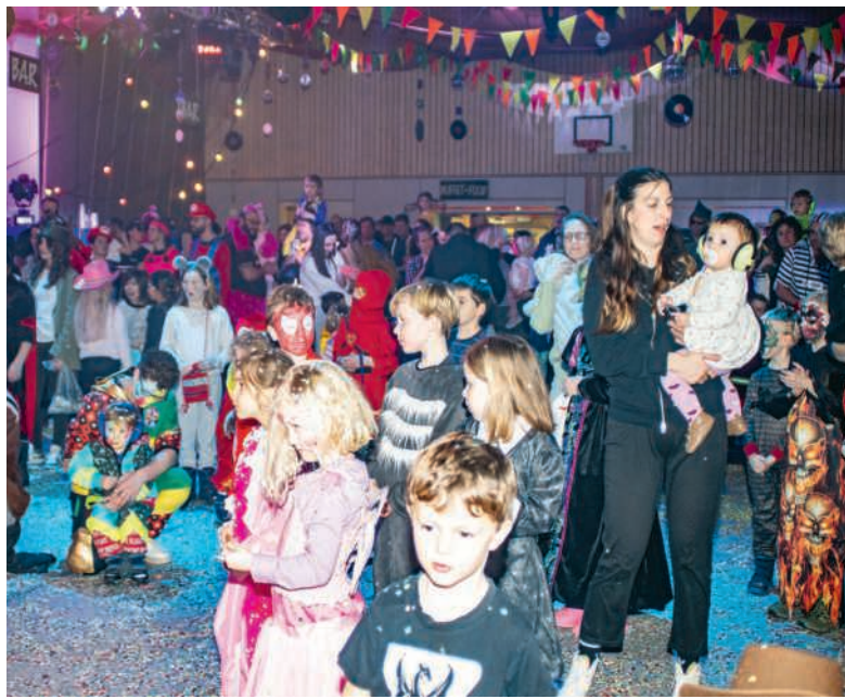
Strahlende Kinder am Maskenball in Remigen