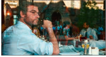
Spotlight, US 2015, AppleTV/Cinu/DVD