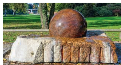
Der Kugelbrunnen am Zürichhorn war 1984 eines der Phänomene-Exponate

Auch ethische Fragestellungen rund um den Einsatz von KI werden auf spielerische Weise thematisiert. Die Inhalte und Exponate entstanden