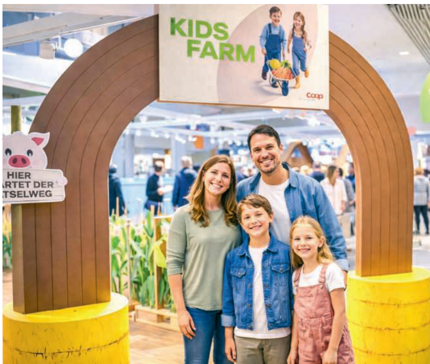
Unter dem grossen «Kids-Farm»-Bogen entdecken Kinder und Familien die Bauernhofwelt mitten im Tägipark