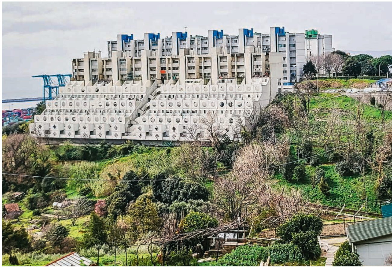
Eine von Georg Aernis Impressionen der italienischen Stadt Genua, die in Wettingen zu sehen sind

Schon beim Betreten der Galerie in Wettingen reibt man sich die Augen. Wer sich beispielsweise nach links wendet, sieht eine riesige Eins, die Häuser überklebt. Was soll das? Beim Näherreten wird jedoch klar, dass die Eins eben keine Nummer ist, sondern einer jener Fahrstühle, die an den scheinbar unmöglichsten Orten so platziert sind, dass man aus dem Staunen nicht mehr herauskommt. Und dann ... immer wieder diese an den steilen Hängen förmlich festgenagelten, aneinandergeschmiegteten Häuser oder eine abenteuerlich anmu-