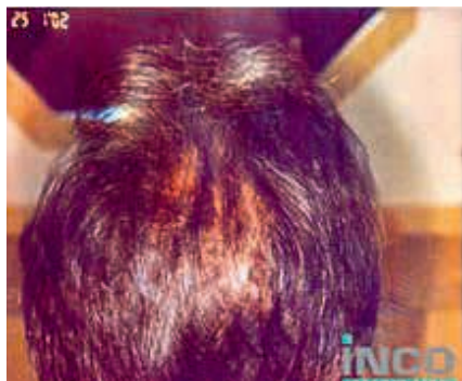
Nach 30 Behandlungen