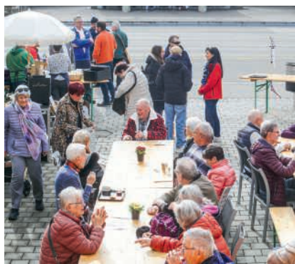
Eindruck vom RPB-Suppentag 2025