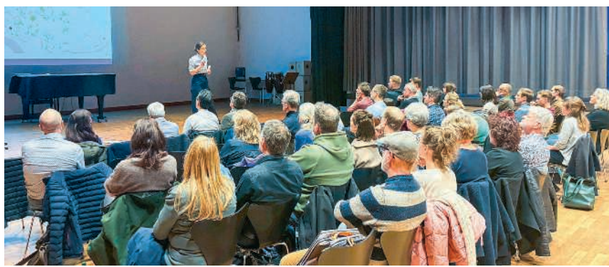
Einwohnerrat lässt sich vertieft informieren