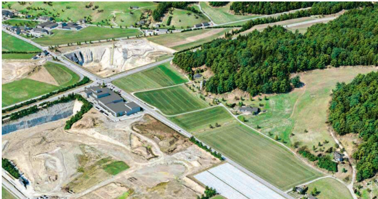
Auf dem Areal südöstlich der bestehenden Grube soll ab 2027 Kies gewonnen werden

Damit unser tägliches Leben funktioniert, benötigt jede Schweizerin und jeder Schweizer jährlich eine Lastwa-