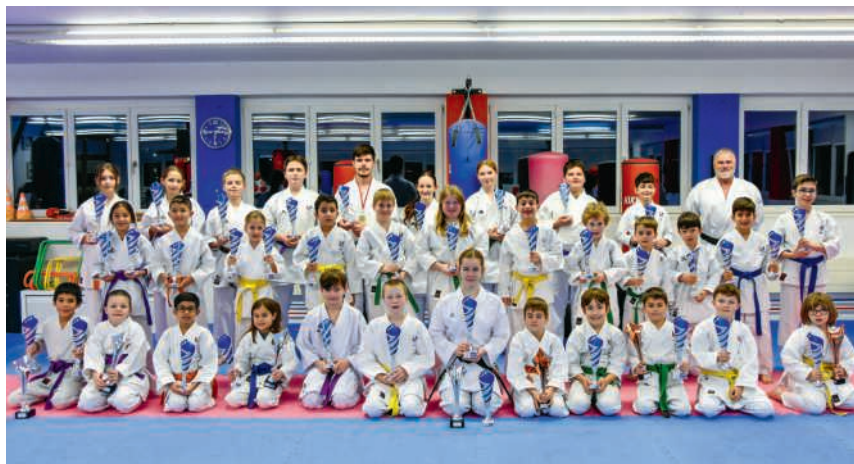
Die Sportler und Sportlerinnen des Kampfsportcenters Siggenthal

Monatelang hatte man geplant, und die Kinder und Jugendlichen trainierten mit viel Engagement. Das Ziel war, dass alle teilnehmen können, und oft wurde erklärt, dass bei einem Wettkampf stets der Spass und die Freude im Vordergrund stehen. Nicht alle können gewinnen, aber die Kinder sollen lernen, dass Gewinnen und Verlieren immer eine positive Seite haben. Im Kampfsportcenter hängt ein grosses Bild, auf dem steht: «Ich verliere nie, entweder ich gewinne