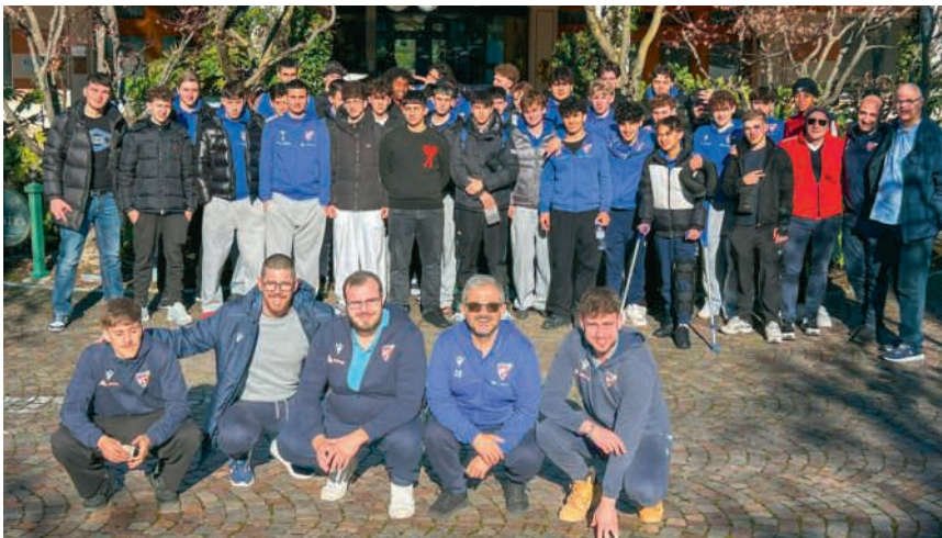
Junioren des FC Wettingen