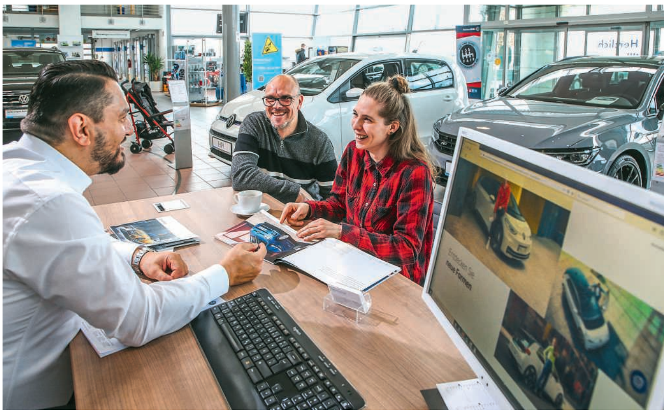
Neue Finanzierungsmodelle wie das Autoabo sind hierzulande eine Randerscheinung

Kreisel Garage Sagistrasse 1a, 5425 Schneisingen Tel. 056 241 17 11 www.kreisel-garage.ch