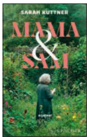
Roman von Sarah Kuttner S. Fischer, 2025

Eine Frau Mitte sechzig stirbt. Ihre Tochter stellt mit Schrecken fest, dass die Mutter hohe Schulden hatte. Sie war auf einen Love-Scammer hereingefallen, jemand, der über das Internet die grosse Liebe vortäuscht, nur um dann immer wieder Geld zu fordern. Und weil dieser jemand angeblich Sam Heughan – der Hauptdarsteller aus der Serie «Outlander» – war, konnte die Mutter nicht Nein sagen. Die Tochter sichtet den fast endlosen Chatverlauf der beiden. Nach und nach lernt sie so auch ihre Mutter besser kennen und entdeckt Seiten an ihr, die sie so nicht kannte. Die Autorin beschreibt eine schwierige Mutter-Tochter-Beziehung und erzählt feinfühlig, wie es dazu kommen konnte, dass die Mutter weder auf ihre Schwester noch auf ihre Tochter hören wollte, als diese sie vor dem Betrug warnten. Sie zeigt auf, wie solche Betrugsmaschinerien nach Handbuch ablaufen, in einer Abfolge von Liebesschwüren und Manipulationen, Schweigen, Schmolten und Schuldzuweisungen. Interessant zu lesen und auch eine Hilfestellung für alle, die den Verdacht haben, jemand aus ihrem Umfeld könnte in Gefahr sein, auf einen Betrug hereinzufallen.