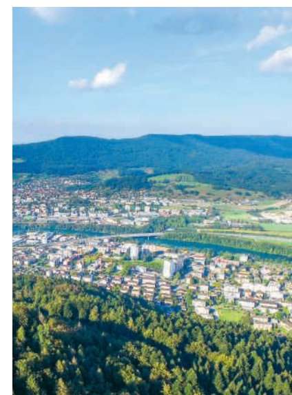
Neuenhof sieht den in Wettingen angedachten Industriecampus kritisch