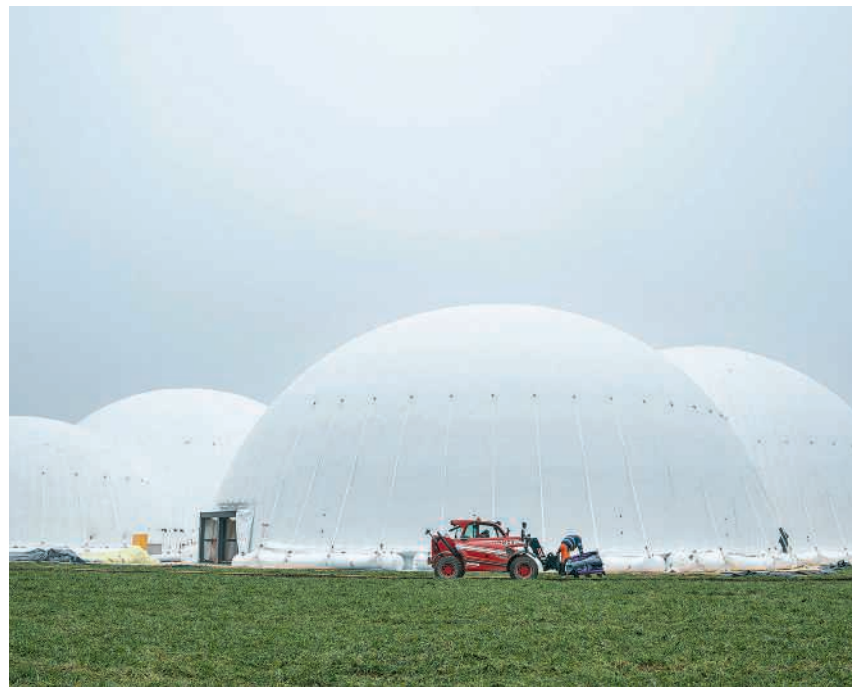
In diesen aufblasbaren Zelten wird die «Phänomena» durchgeführt

Die interaktive Ausstellung «Phänomena» lockte 1984 über eine Million Gäste nach Zürich. Die diesjährige Neuauflage widmet sich dem Thema künstliche Intelligenz (KI). In sechs Kuppeln gleich hinter Spreitenbachs Gemeindegrenze werden auf 2200 Quadratmetern interaktive Exponate das Thema KI beleuchten. Geleitet wird das auf fünf Jahre angelegte und rund 26 Millionen Franken teure Projekt von Urs Müller, dem Sohn des Erfinders Georg Müller. Nach der sechswöchigen Premiere ist eine Tournee durch die Schweiz geplant. Die Eröffnung erfolgt am 13. März in Anwesenheit von Bundespräsident Guy Parmelin. Seite 4