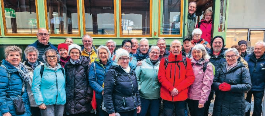
Die Februarwanderung der Wandergruppe Spreitenbach führte zum Tram-Museum Burgwies