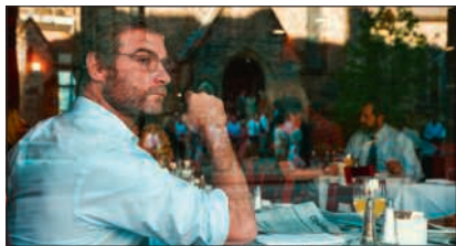
Spotlight, US 2015, AppleTV/Cinu/DVD