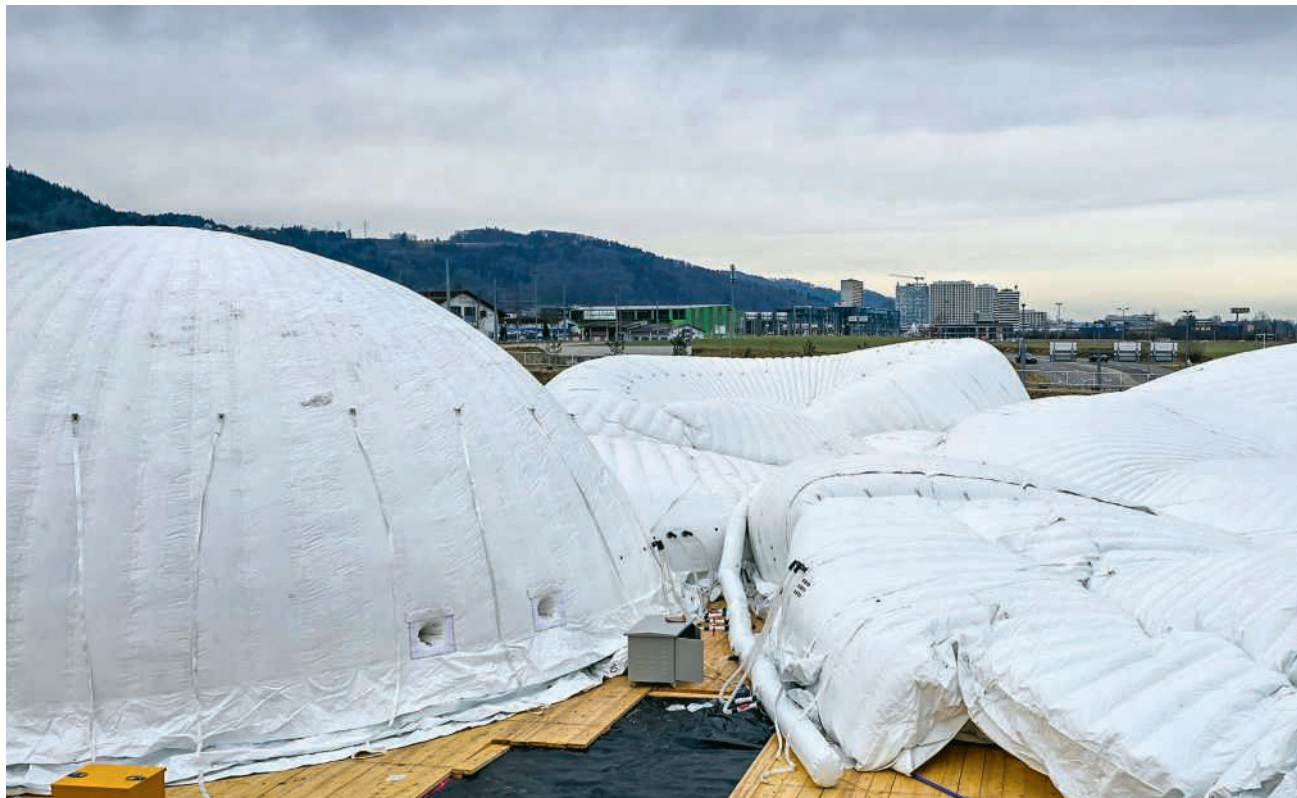
Eine Kugel nach der anderen erhebt sich vor der Silhouette Spreitenbachs

Die Nachfolgeausstellung startet in zwei Wochen auf halbem Weg zwischen Spreitenbach und Dietikon auf dem Niderfeld. Gleich hinter der Zürcher Kantonsgrenze wurden dafür sechs zusammenhängende Kuppeln errichtet. Dabei handelt es sich um das grösste aufblasbare Zelt der Welt, in dem auf 2200 Quadratmetern die «Phänomene» untergebracht wird. Die grösste frei stehende Kuppel ist 15 Meter hoch, misst 30 Meter im Durchmesser und wird durch eine mit Druckluft gefüllte Doppelwand sowie