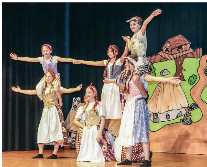
Der Nachwuchs des STV Bözberg begeisterte auf der Bühne

Die Figuren auf der Bühne der Turnhalle kamen dem Publikum bekannt vor. Kein Wunder, versetzten die Mitglieder des STV Bözberg die Szenerie für einen Abend in die Zeit der alten Gallier, ins Jahr 50 vor Christus. Den Auftakt des etwa 2½-stündigen Turnabends machten die kleinsten Turnerinnen und Turner. Es folgten vielseitige Darbietungen wie das Geräteturnen mit dem Programm «Shopping-Queen», die Männerriege mit der Darbietung «Päckli-Post», das Geräteturnen Mixed unter dem Titel «Zirkus Maximus» oder der Frauenturnverein, der das Publikum mit «Kleopatra» ins alte Ägypten entführte. Seite 3