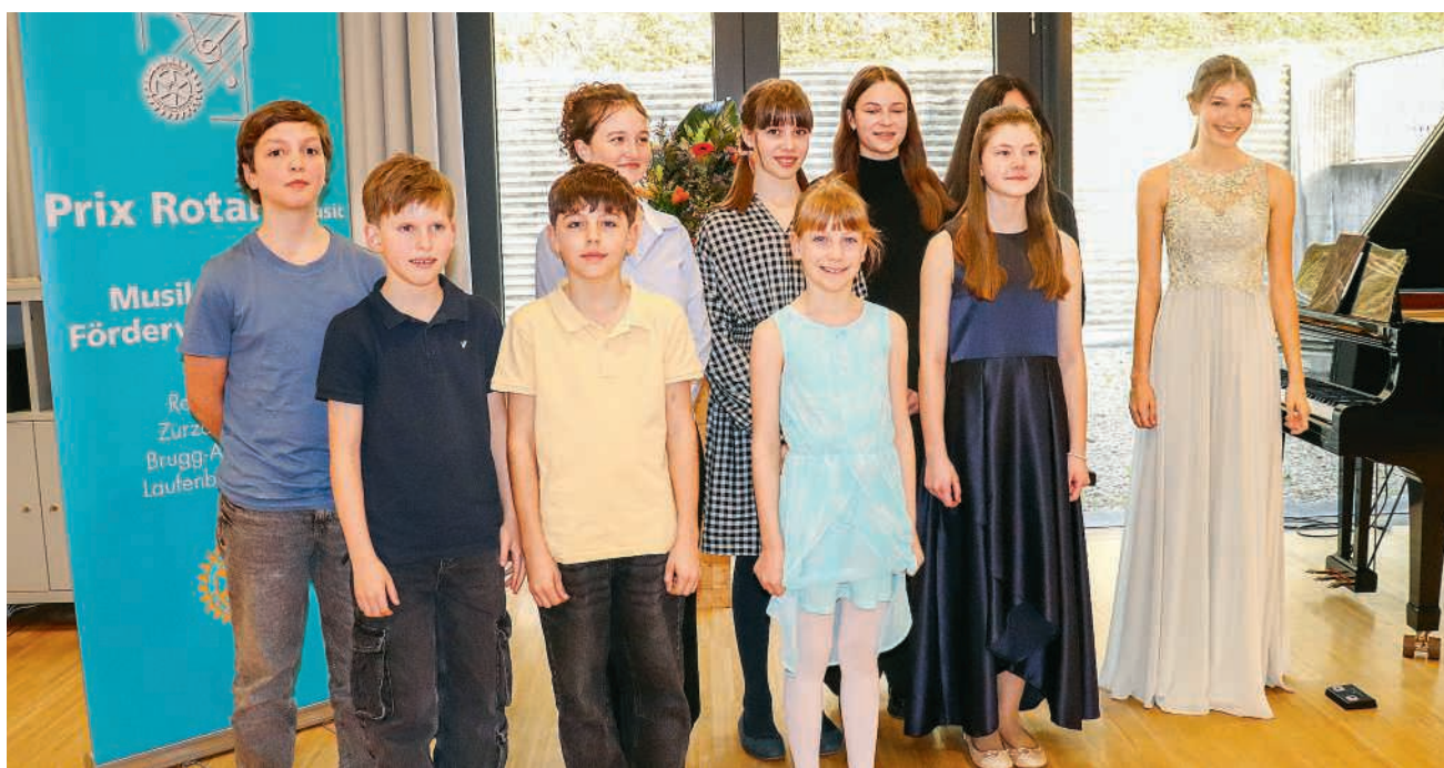
Die strahlenden Gewinnerinnen und Gewinner des Prix Rotary Music nach ihrem erfolgreichen Auftritt

Die Freude und die Erleichterung über den Erfolg tags zuvor waren deutlich zu spüren, sowohl bei den