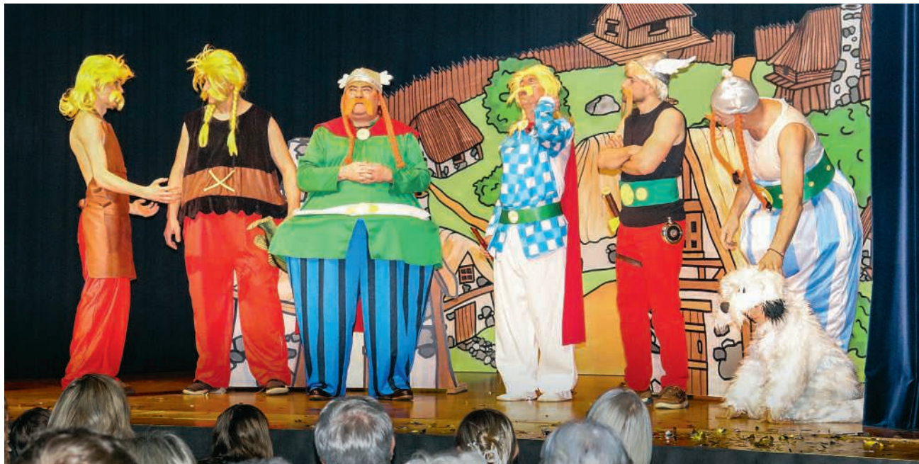
Die Turnhalle Chapf wurde für einen Abend in die Römerzeit versetzt

Den Auftakt machten die kleinsten Turnerinnen und Turner mit dem Kinderturnen, das als quirliges gallisches Dorf auftrat, und zwar mit «Heubürzeln», Radschlagen und mutigen Sprüngen vom Minitrampolin und