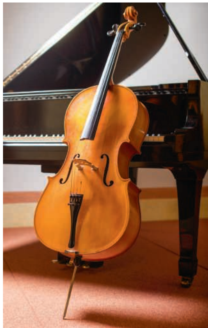
Violoncello und Klavier

Das fünfte Konzert der Reihe «Kammermusik im Zimmermannhaus» steht unter dem Motto «Aus alten Märchen winkt es». Der Schwerpunkt des stilistisch vielschichtigen Konzerts liegt auf romantischen Märchenvertonungen von deutschen und tschechischen Komponisten. Den Auftakt bildet das 1897 für Violoncello und Klavier geschriebene, lyrisch verträumte Märchen op. 8 von Paul Juon, einem in Moskau geborenen Schweizer Komponisten bündnerischer Herkunft. Er verbrachte den grössten Teil seines Lebens in Deutschland, unter-