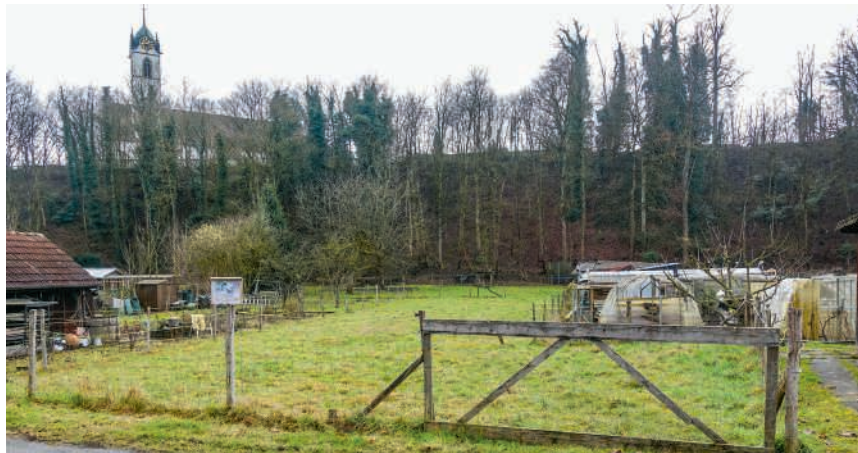
Die Zukunft des Areals Vorder Chilefeld ist geklärt

Bereits zum zweiten Mal innerhalb eines Monats musste sich dagegen das bürgerliche Komitee geschlagen geben. Im Februar kam das Bündnis aus Mitte, SVP und FDP mit seinem Referendum gegen das laufende Bud-