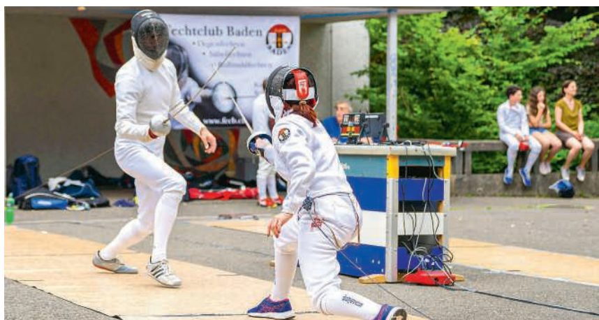
Fechten hält körperlich und geistig fit

Der FECB versteht sich als Club für den Breitensport und möchte das Fechten vielen Menschen näherbringen. Alle Interessierten sollen die Gelegenheit haben, das Fechten zu erlernen – unabhängig von Alter, sportlichen Ambitionen oder möglichen körperlichen sowie geistigen Einschränkungen. Der Verein gehört zu den wenigen in der Schweiz, die regelmässig Trainings speziell für Menschen mit Beeinträchtigungen anbieten.