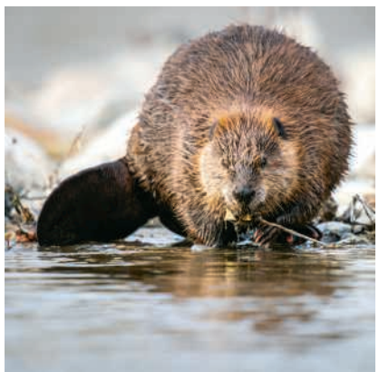
Biber gestalten Landschaften