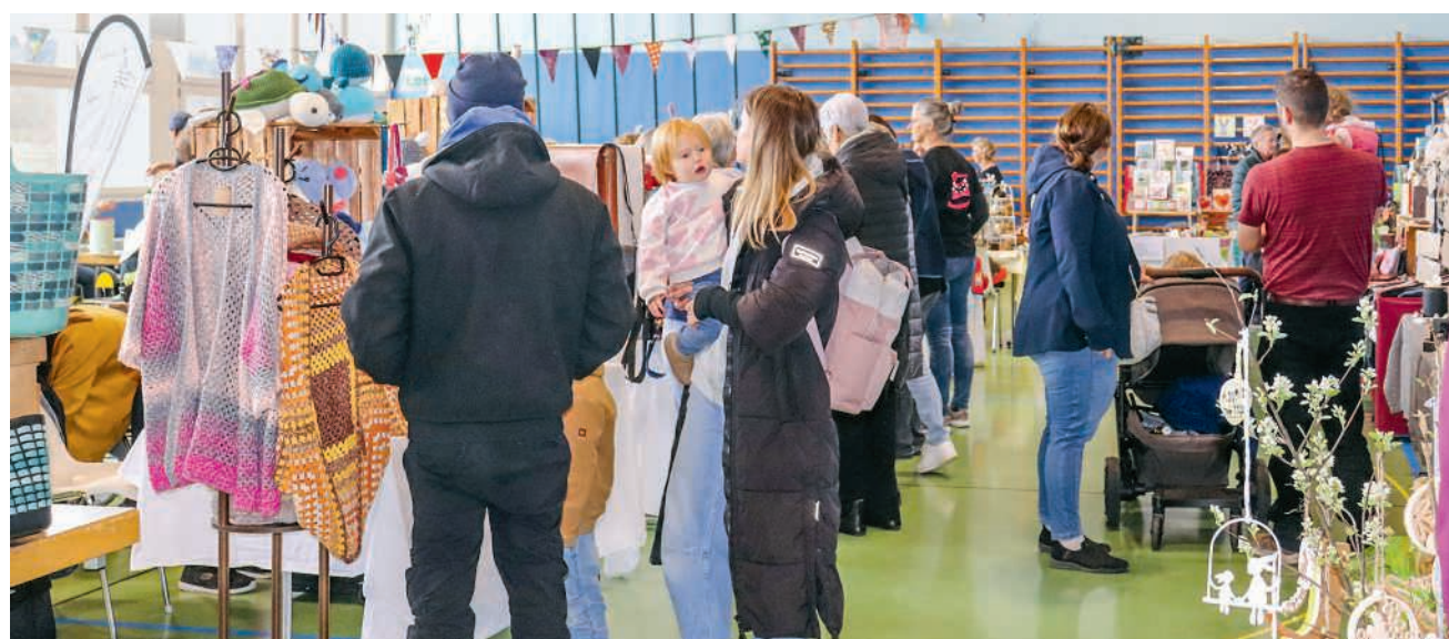
Der Frühlingmarkt vom vergangenen Sonntag

Der Frühlingmarkt war ein Fest des Zusammenkommens, das Vorfreude auf den Frühling weckte.