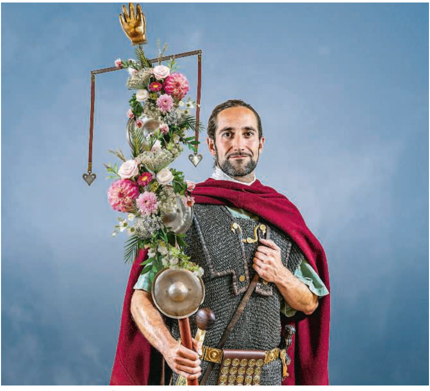
Das Eröffnungsfest bietet für alle ein spannendes Programm

Erwachsene und Kinder schmieden Schreibgriffel, schreiben Festeinladungen, prägen römische Münzen und backen Fladenbrot. Gemeinsam entstehen prachtvolle Standarten, und Kinder werden zu Standartenträgerinnen und -trägern ausgebildet. Auf Kurzführungen und Spieldtours entdecken Gross und Klein zudem die archäologischen Schauplätze von Vindonissa. Ein Shuttlebus verbindet das Festgelände in Windisch mit dem Vindonissa Museum in Brugg, das ebenfalls ganztags geöffnet ist. Im Museum und im römischen Garten gibt es weitere Angebote wie Blumenkränze flechten, Mosaik ausmalen, Führungen und interaktive Spieldtours. Der Legionärspfad Vindonissa hält am Eröffnungsfest ein vielseitiges Gastronomieangebot bereit.