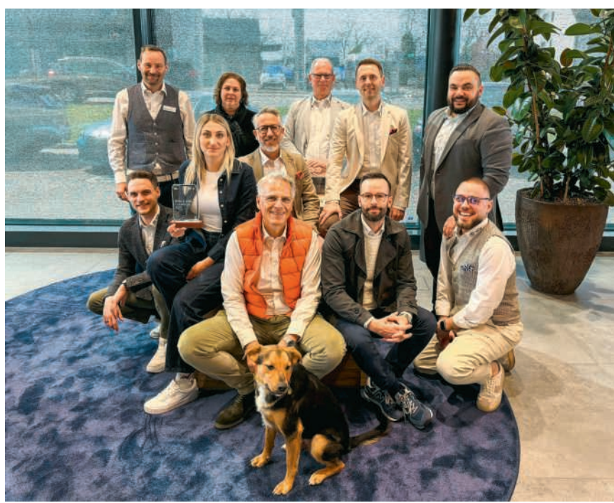
Das Team Emmenegger freut sich auf Ihren Besuch