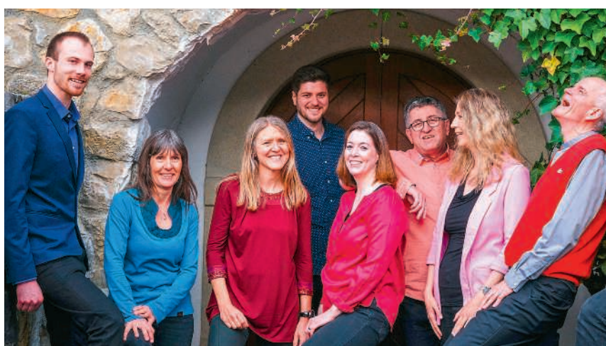
Guys N' Roses verlassen sich bei ihren Auftritten einzig auf ihre Stimmen