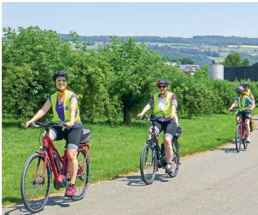
Sicher unterwegs im Aargau

Ein Verein für Fahrradfreunde ist Pro Velo Baden. Der Verein macht sich stark für sichere und attraktive Velorouten in der Region, und besonders für Genuss- und Freizeitfahrer lohnt sich der Kontakt. In Brugg engagiert sich Pro Velo Brugg-Windisch mit ähnlichen Aktivitäten. Gruppen und Interessierte treffen sich zu Fahrten, Tourenempfehlungen oder Infoanläs-