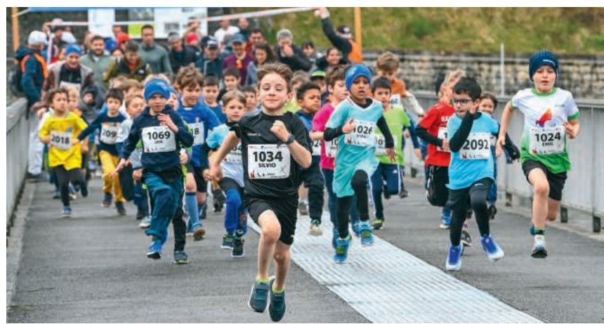
Start des letztjährigen Kinderlaufs