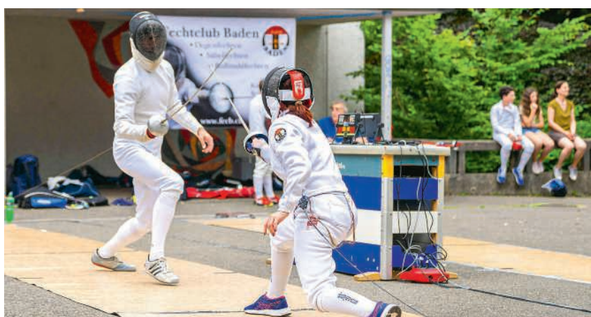
Fechten hält körperlich und geistig fit

Der FECB versteht sich als Club für den Breitensport und möchte das Fechten vielen Menschen näherbringen. Alle Interessierten sollen die Gelegenheit haben, das Fechten zu erlernen – unabhängig von Alter, sportlichen Ambitionen oder möglichen körperlichen sowie geistigen Einschränkungen. Der Verein gehört zu den wenigen in der Schweiz, die regelmässig Trainings speziell für Menschen mit Beeinträchtigungen anbieten.