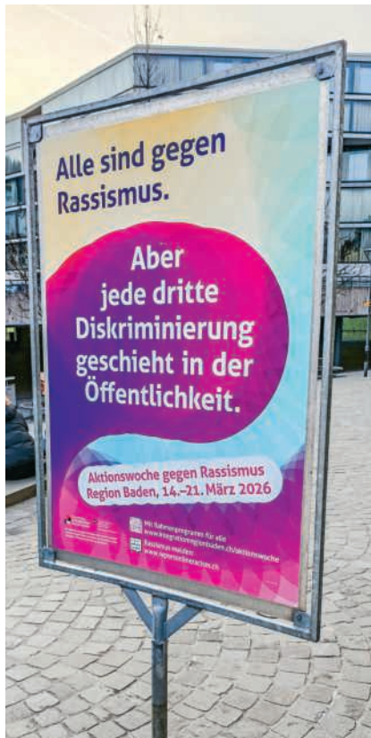
Plakate wie dieses regen dazu an, sich Gedanken zum Umgang mit Rassismus zu machen

Während der ganzen Aktionswoche gibt es Angebote wie kostenlose Onlineberatungsgespräche für Schulleitungen und Lehrpersonen zum Thema Umgang mit Rassismus. Im Historischen Museum Baden wird während dieser Zeit ein Ausstellungsfokus auf das Thema «Arbeitsmigration in Baden» gelegt. Die Gemeindebibliothek Wettingen, das Lokal Mitenand in Gebenstorf, die Stadtbibliothek Baden sowie die Buchhandlungen Bücher Doppler und Librium in Baden beteiligen sich mit der Aktion «Bücher gegen Rassismus».