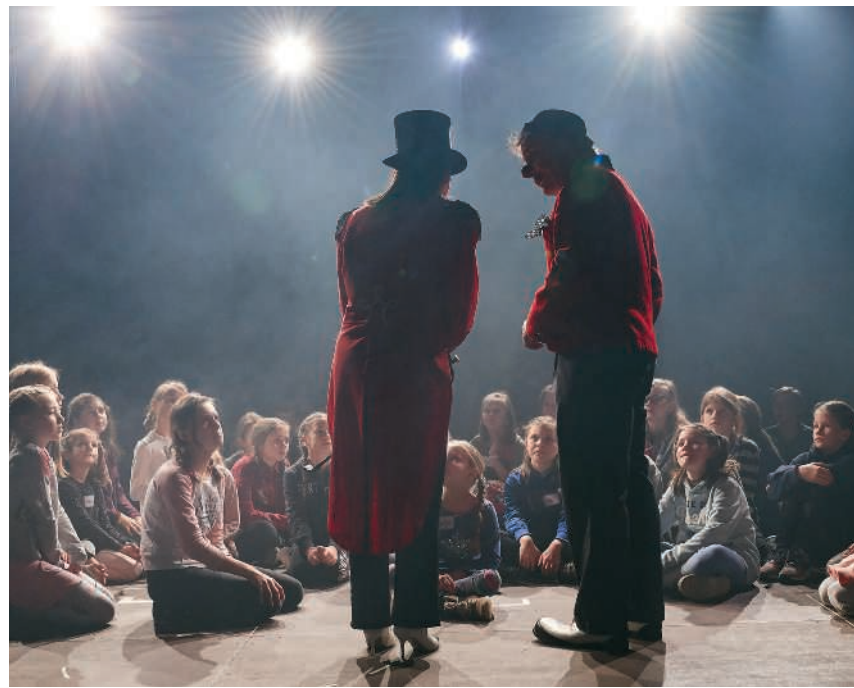
Erste Bühnenerfahrung mit dem Theater Lampefeiber sammeln

Die neue Produktion «Disputissima – wer hat das letzte Wort?» des Badener Kinder- und Jugendtheaters Lampefeiber widmet sich dem Thema Streitkultur. Damit reiht es sich ein in die Feierlichkeiten zum 500-Jahr-Jubiläum der Badener Disputation, eines bedeutenden Streitgesprächs zwischen Vertretern der katholischen Kirche und der Reformation. Unter der Leitung von Simona Hofmann entwickelten über 60 Kinder und Jugendliche ein Stück, das auf ihren Erfahrungen zum Thema Streiten basiert. Das Drama bewegt sich zwischen einem ungewöhnlichen Gerichtsprozess und einem Abenteuer unter Wasser. Seite 5