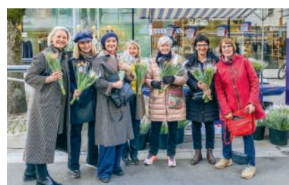
Der Soroptimist Club Brugg-Baden ist bereit für den Wochenmarkt

Die Koalition für Konzernverantwortung organisiert Vorführungen des Dokumentarfilms «Macht und Ohnmacht - wenn Schweizer Konzerne Leben zerstören» in der Region. Der Film zeigt einerseits die Andenprovinz Espinar und andererseits den Regenwald auf der südostasiatischen Insel Borneo. Im Anschluss an den einstündigen Film zeigt eine kurze Präsentation, was die Konzernverantwortungsinitiative genau fordert und wie sie dafür sorgen will, dass sich multinationale Konzerne an Menschenrechte und Umweltstandards halten. Der Film wird am 16. März um 19 Uhr im Gemeinschaftszentrum Arche in Rütihof gezeigt. Genauso am 17. März um 19.30 Uhr im katholischen Pfarreizentrum Untersiggenthal, am 19. März um 20 Uhr im Kulturcafé Baden, am 23. März um 19 Uhr im Schulungsraum des Zekaristoro in Dättwil, am 24. März um 19 Uhr in der Bibliothek Turgi sowie am 1. April um 19 Uhr im Ennetraum in Ennetbaden. RS