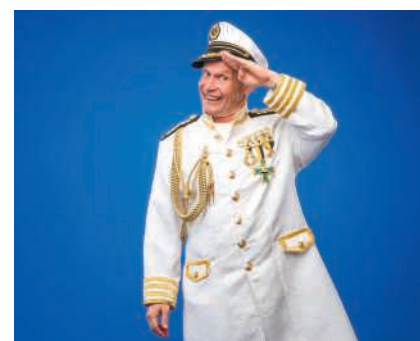
Peter Löhmann

Zwischen dem 13. und 20. März findet das Comedy-Festival Schweiz des Deutsch-Schweizer Comedian Peter Löhmann statt.