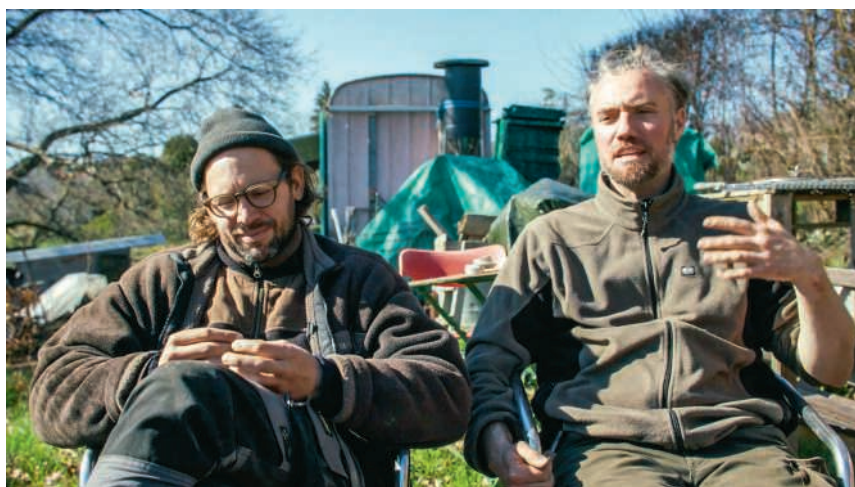
Ausschnitt aus «Der Geschmack der Dinge», 2025

«Die Lösung globaler Probleme beginnt vor Ort. Mit diesem Best-of möchte ich den Dialog in unserer Re-