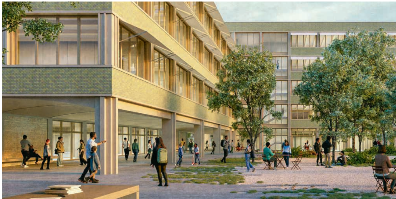
Am 14. Juni entscheiden die Wettinger Stimmberechtigten, ob aus der Projektion der Badener Burkard Meyer Architekten ein Bauprojekt für eine Schullandschaft Margeläcker werden soll VISUALISIERUNG: BURKARD MEYER

Für die Fiko ebenfalls wichtig ist, dass sich eine SIA-konforme Projektion in drei Teile gliedert. In einem ersten Schritt entsteht ein Vorprojekt, dem die eigentliche Bauplanung und das Bewilligungsverfahren folgen. Im Abschluss von Phase eins kennt man die mutmasslichen Baukosten auf plus/minus 10 Prozent genau. «Wir wissen dann, ob der Zielwert erreicht wird oder nicht», sagte