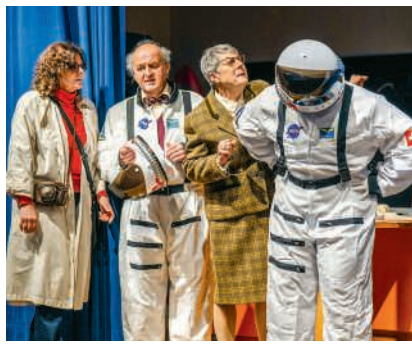
Das Thekalaila-Ensemble versucht, den Mond zu erreichen

Für die Umsetzung des Stücks ist hinsichtlich Requisiten von der The-