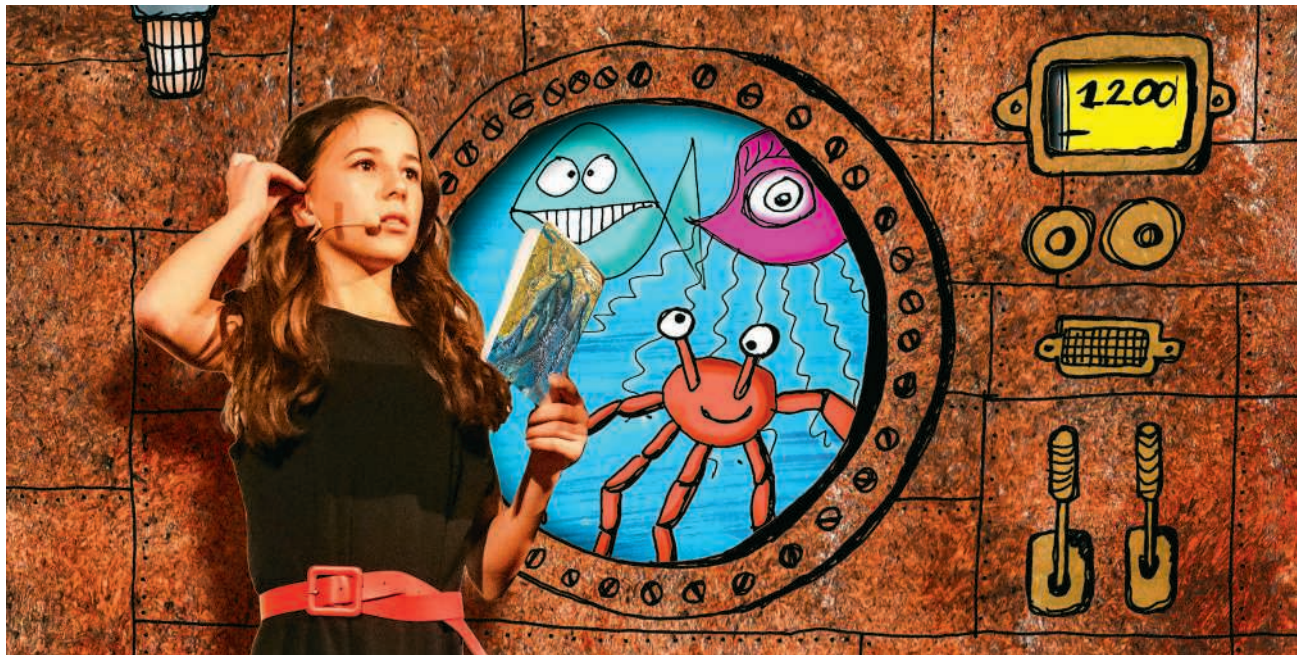
Das Kinder- und Jugendtheater Lampefieber geht im Rahmen der «Disput(N)ation» auf Tauchfahrt