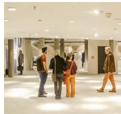
Hier soll der Biosupermarkt eingerichtet werden

Während der Laden bereits bewilligt ist, steht die Bewilligung für das