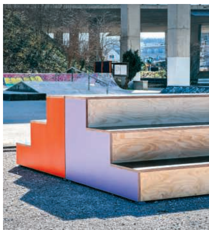
Neue Möblierung für die Rollsportanlage Dättwil