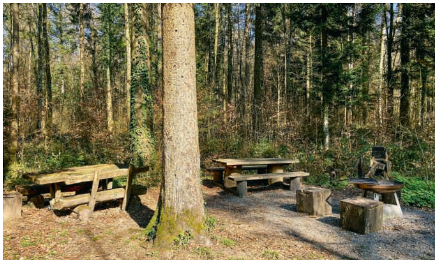
Der Waldplatz Römerhügel

Im Mittelpunkt stehen das freie Entdecken und Erleben. Ohne vorgefertigte Spielsachen wird der Wald zur