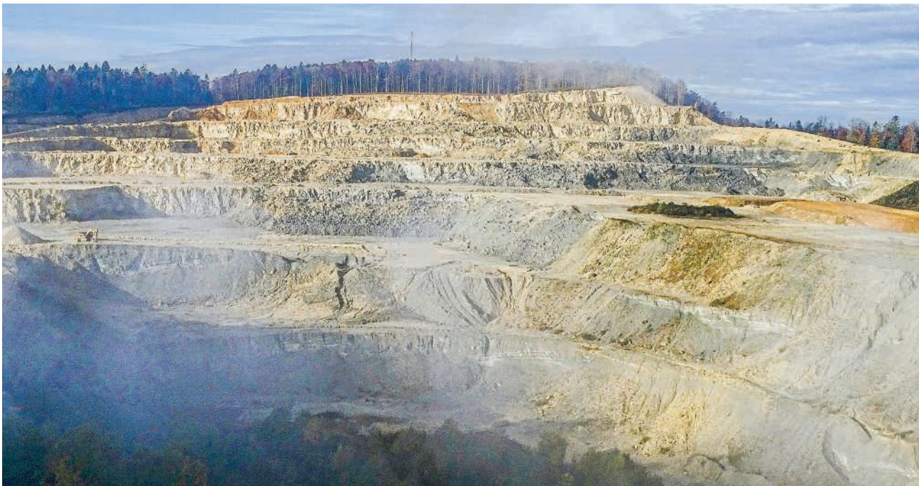
Der Steinbruch Gabenchopf in Villigen

Die SP anerkenne, dass die Erweiterung des bestehenden Steinbruchs grundsätzlich sinnvoll sei, sagt Grossrat Marius Fideli auf Anfrage. Durch die Nutzung bestehender Infrastruktur und Logistik könne ein zusätzlicher Flächenverbrauch andernorts vermieden werden. Zudem entspreche die Erweiterung der langfristigen Sicherung der Rohstoffversorgung, wie sie im Richtplan vorgesehen sei.