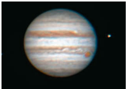
Jupiter und seine Monde