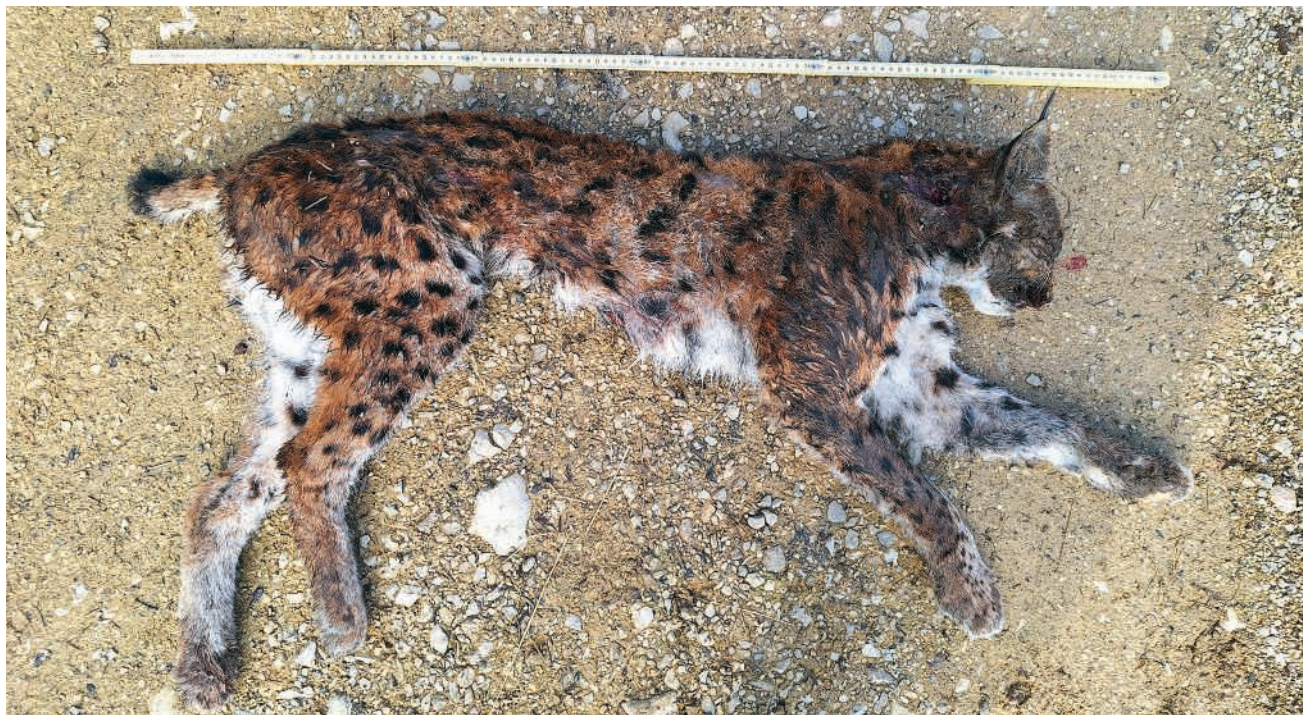
Dieser Luchs wurde im März 2025 auf dem Linnerberg im Gemeindebann Schinznach mit Jagdmunition erschossen

Die Regierung kann zum Vorfall nur bestätigen, dass der Luchs illegal getötet wurde, und zwar mit Jagdmunition, was immerhin den Verdacht schüren könnte, dass eine mit der Jagd verbundene Person in den Abschuss involviert gewesen wäre. Das