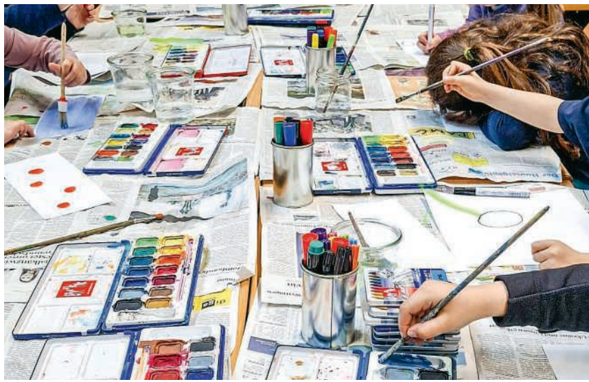
Villiger Kinder widmen sich der Kunst

Während ein Teil der Villiger Primarschülerinnen und -schüler im Skilager war, besuchten die Kinder vom Kindergarten bis zur sechsten Klasse verschiedene Ateliers und produzierten selbst Kunstwerke. In altersdurchmischten Gruppen lernten sie