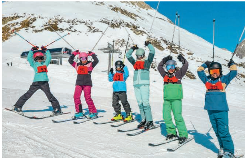
Skispass der Schule Villigen in Sedrun