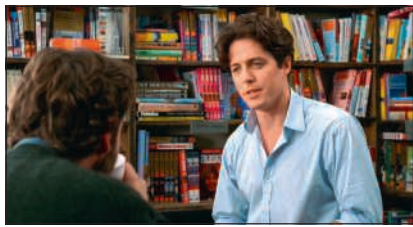
Notting Hill, UK/US 1999, am 15. April im Kino Excelsior, Brugg