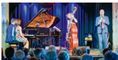
The Swingin' Ladies + 2