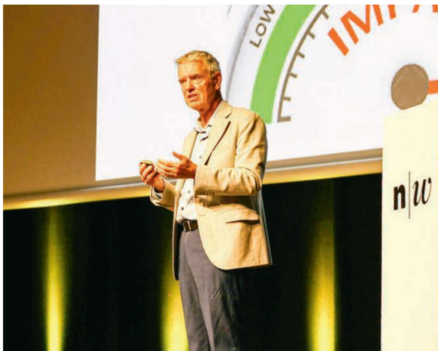
John Hattie führte in einem Referat in seine jahrzehntelange Forschung ein

Dabei warnte John Hattie vor einer Überbetonung des Alleinarbeitens unter dem Etikett «individualisiert und personalisiert». Effektives gemeinschaftliches Lernen finde in Tandems oder Kleingruppen statt – hier «unterrichten» Lernende ihre Peers. Klare Instruktion, gezieltes vertiefendes Üben und reflektierte