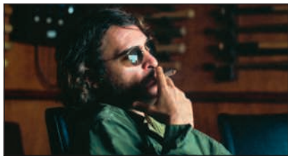
Inherent Vice, US 2014, Canal+/Apple TV/Blu-ray Disc