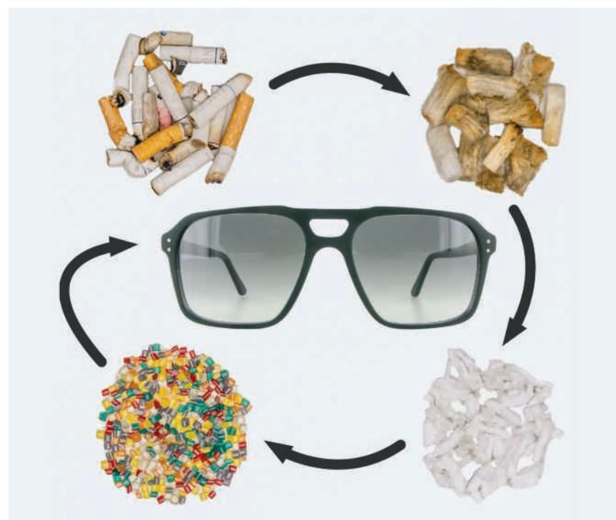
Aus Zigarettenfilter werden hochwertige Sonnenbrillen hergestellt