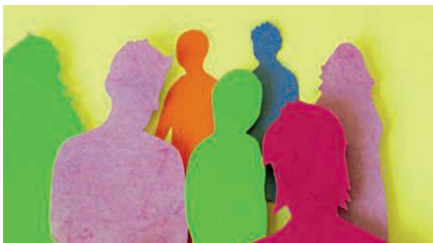
Der Verein Treffpunkt setzt sich für eine bunte Gesellschaft ein

Der Verein Treffpunkt Wettlingen will den Alltag von Asylsuchenden und Geflüchteten in der Region erleichtern und zu einem erfolgreichen gesellschaftlichen Miteinander beitragen. Die Situation von Geflüchteten, ihr Leben hier und ihre Integration sind ständig im Fluss. Ihre Bedürfnisse ändern sich laufend. Der