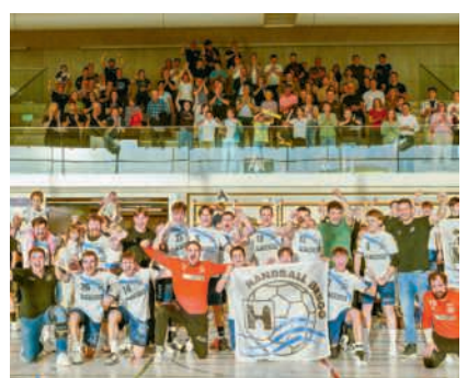
Die Herren von Handball Brugg spielen nächste Saison in der 1. Liga

Am vergangenen Samstagabend um 18 Uhr verwandelte sich die Sporthalle Mülimatt in Brugg in einen Hexenkessel. Trotz bestem Frühlingwetter fanden zahlreiche Fans den Weg in die Halle und sorgten für eine