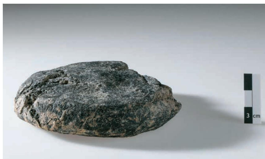
Das in Windisch entdeckte Fladenbrot

Brote aus der Römerzeit werden bei Grabungen äusserst selten entdeckt, da sie nur in verbranntem Zustand erhalten bleiben – wie zum Beispiel in der Bäckerei im römischen Pompeji. Der Fund des schweizweit ersten römischen Brots untermauert umso