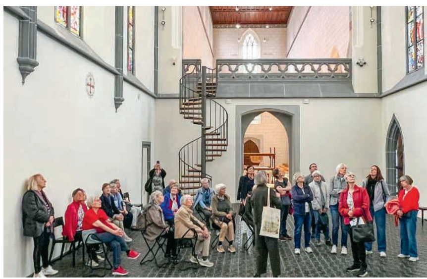
Erklärungen zu den Kirchenfenstern