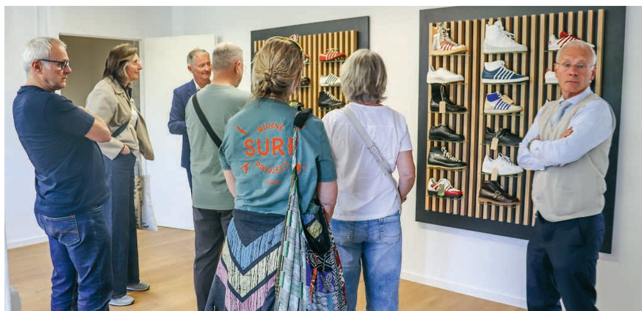
Tradition und Innovation vereint: Künzli präsentierte am neuen Hauptsitz seine aktuellen Schuhmodelle

Mit Blick auf die kommenden Jahre rückt ein besonderes Ereignis in den Fokus: Im nächsten Jahr feiert Künzli Schuhe sein 100-jähriges Bestehen. Der Anlass in Brugg kann somit als Auftakt zu einem Jubiläum gelten, das sowohl die Geschichte als auch die Weiterentwicklung der Marke würdigen dürfte.