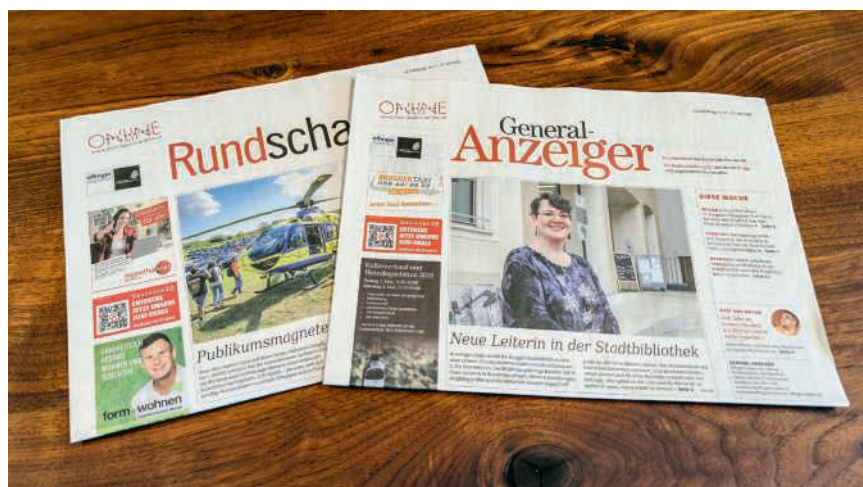
«General-Anzeiger» und «Rundschau»

Mit CH Media wurde ein Käufer gefunden, der im Aargau stark verankert ist und über umfassende Erfahrung im Bereich der Gratisanzeigen verfügt. «Ich bin überzeugt, dass wir mit CH Media den bestmöglichen Käufer für unsere drei Anzeigen gefunden haben. Das Medienunternehmen hat eine lange journalistische Tradition und ist bereits mit verschiedenen Gratisanzeigen fest im Aargau verankert. Unser Fokus gilt künftig dem