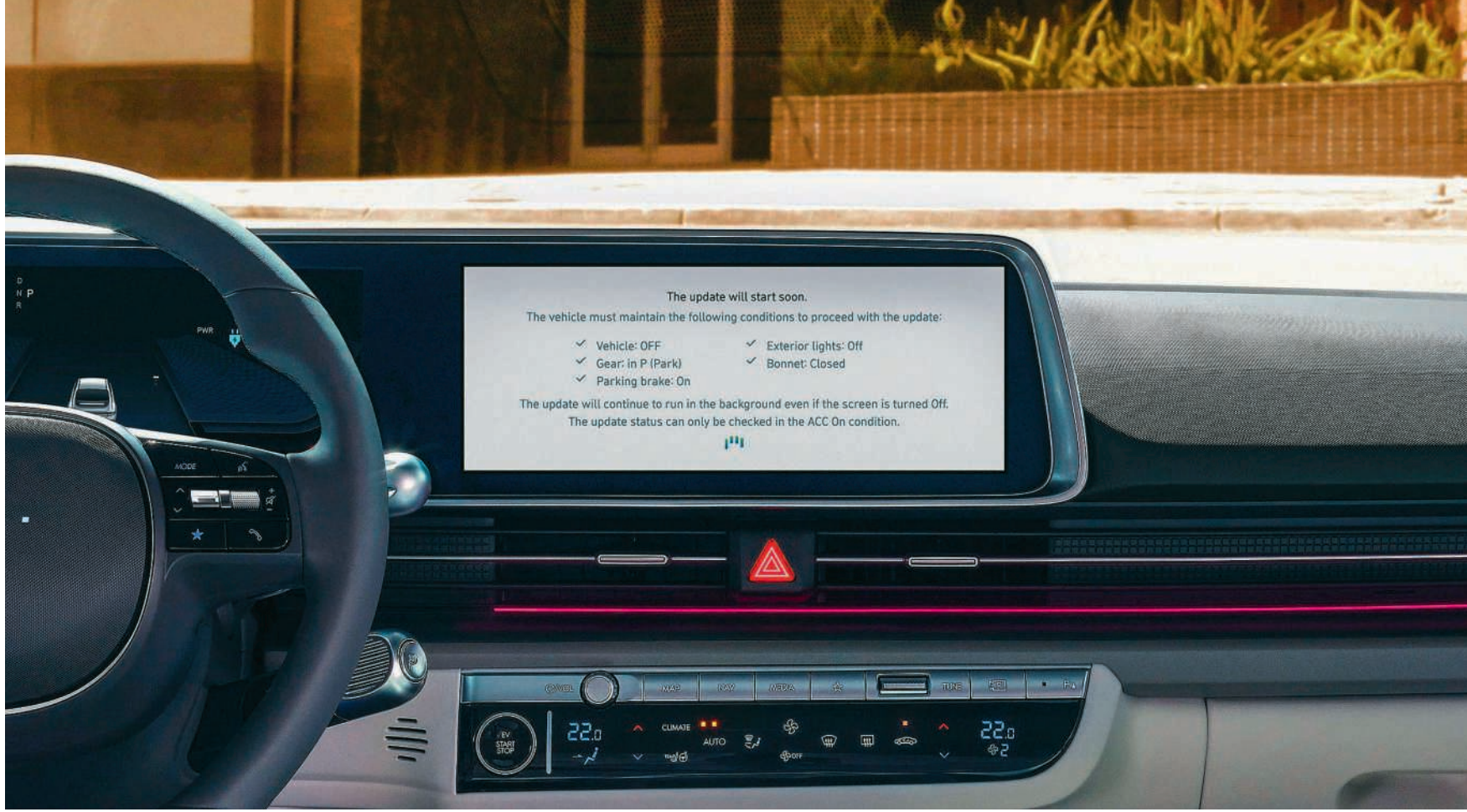
Wer möchte auch im Auto stets die aktuelle Software?

Alle grossen Autohersteller haben inzwischen SDV-Plattformen entwickelt und für die kommenden Jahre zahlreiche neue Modelle darauf angekündigt. Für die Hersteller eröffnet das SDV neue Geschäftsfelder, da sich nicht nur Apps, sondern ebenso komplette Fahrfunktionen nachträglich freischalten lassen. Für die Kundinnen und Kunden liegt der grösste Vorteil darin, dass das eigene Fahrzeug im digitalen Zeitalter technisch stets auf dem neuesten Stand bleibt. Als Kehrseite gelten Datenschutzbedenken sowie die Sorge, dass Fahrzeuge beim Kauf nicht mehr vollständig ausgereift sind, da funktionale Mängel später per Update behoben werden können.