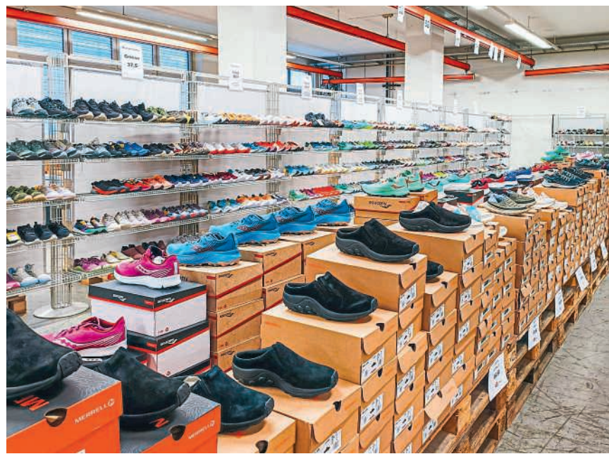
Eine vielfältige Auswahl wartet auf viele Schnäppchenjäger

LÖSUNGSWORT: 1 2 3 4 5 6 7 8 9 10 11 12 13 14