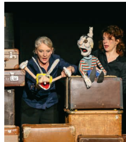
Ein Puppentheater für die ganze Familie