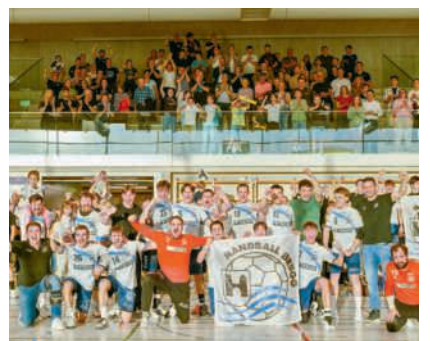
Die Herren von Handball Brugg spielen nächste Saison in der 1. Liga

Am vergangenen Samstagabend um 18 Uhr verwandelte sich die Sporthalle Mülimatt in Brugg in einen Hexenkessel. Trotz bestem Frühlingwetter fanden zahlreiche Fans den Weg in die Halle und sorgten für eine