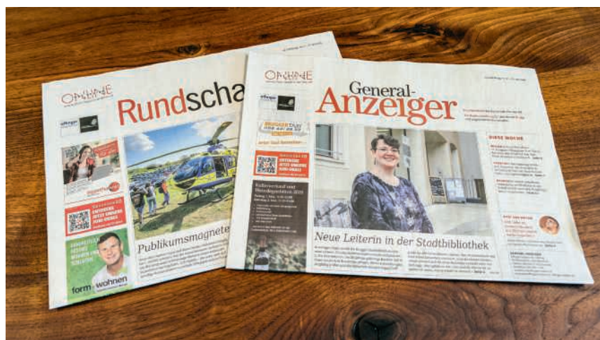
«General-Anzeiger» und «Rundschau»

Mit CH Media wurde ein Käufer gefunden, der im Aargau stark verankert ist und über umfassende Erfahrung im Bereich der Gratisanzeigen verfügt. «Ich bin überzeugt, dass wir mit CH Media den bestmöglichen Käufer für unsere drei Anzeigen gefunden haben. Das Medienunternehmen hat eine lange journalistische Tradition und ist bereits mit verschiedenen Gratisanzeigen fest im Aargau verankert. Unser Fokus gilt künftig dem