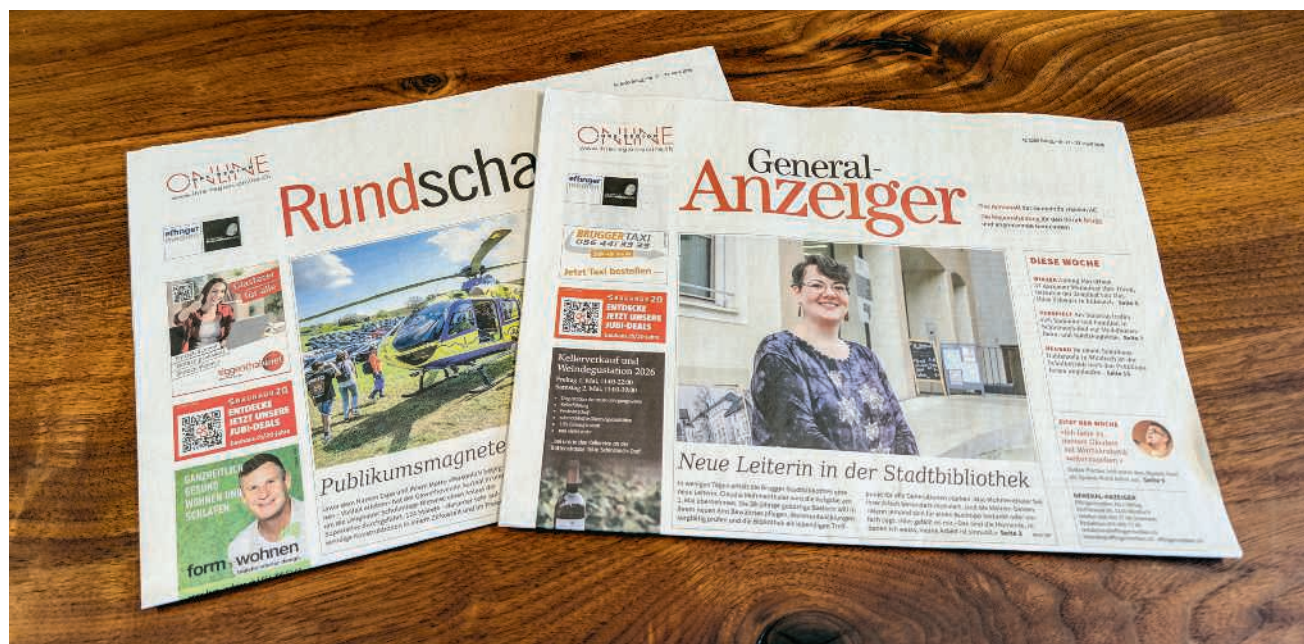
«General-Anzeiger» und «Rundschau»