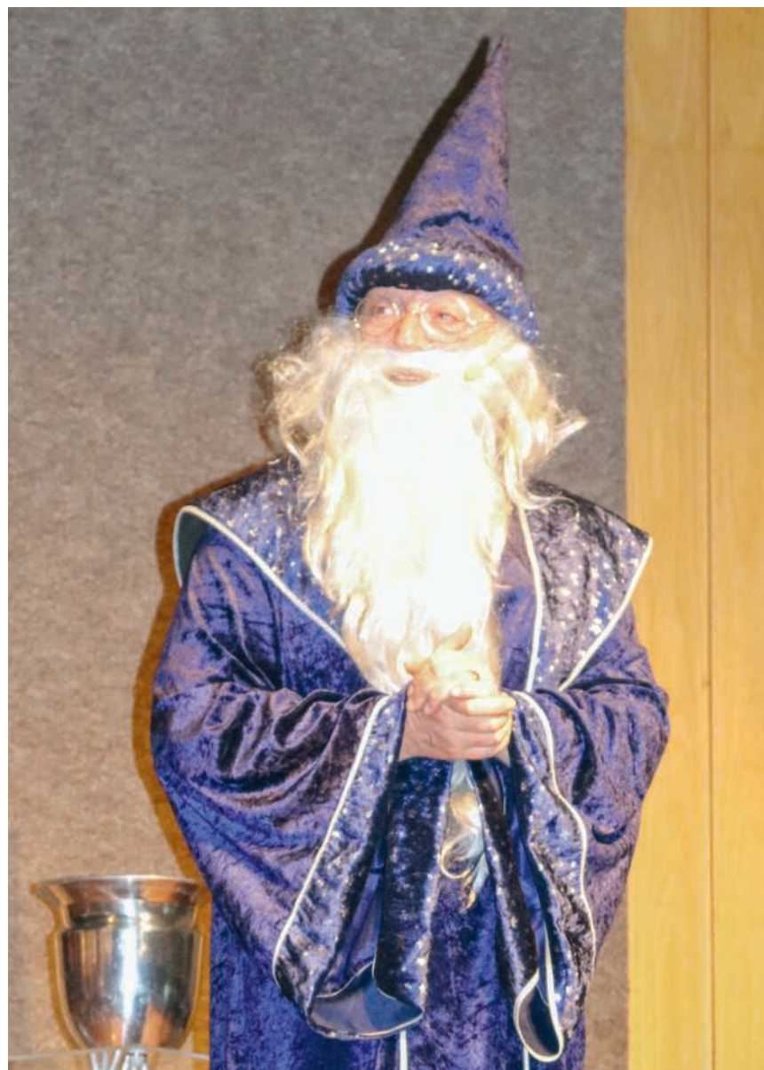
Auftritt des Zauberers

Kulinarisch wurden die Gäste ebenfalls verwöhnt: Vor dem Konzert konnten sich die Besucherinnen und Besucher samstags bei einem Nachtessen stärken. Angeboten wurden ein Fitnessteller oder eine «Zauberwurst» mit Brot sowie ein Salatteller. Daneben gab es ein einladendes Dessert- und Kuchenbuffet. Die diesjährigen Konzerte der MG Brassband Lengnau waren rundum gelungen und verbanden Musik und Magie auf eindrucksvolle Weise.