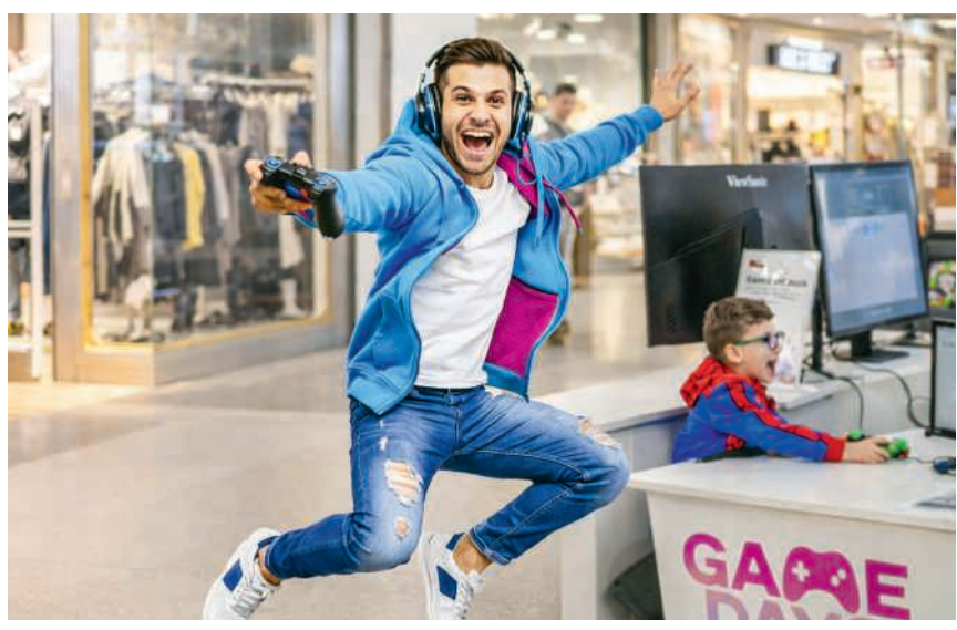
Zocken, staunen, gewinnen: Die Game Days im Aarepark lassen keinen Gamer kalt