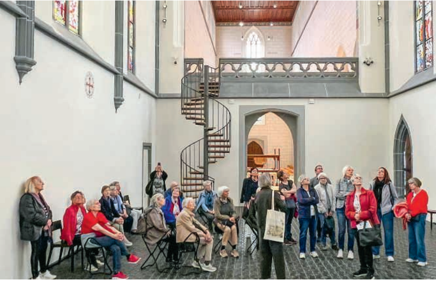
Erklärungen zu den Kirchenfenstern