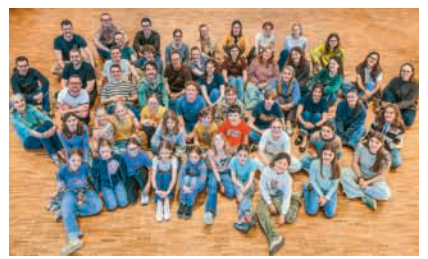
Beide Chöre vereint

Im Stück singen und spielen Mitglieder aus dem Jugendchor Siggenthal und dem Jugendchor+. So konnten