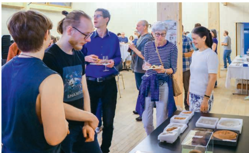
Einige Fundstücke, die über 500 Jahre lang im Untergrund lagen, konnten in der Dorfschür bestaunt werden