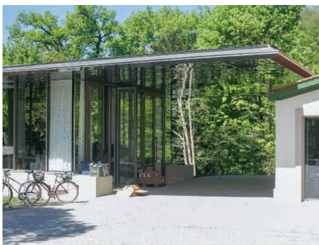
Pavillon «en plein air»

Bloesser Optik AG Neumarkt 2 5200 Brugg Telefon 056 441 30 46 www.bloesser-optik.ch