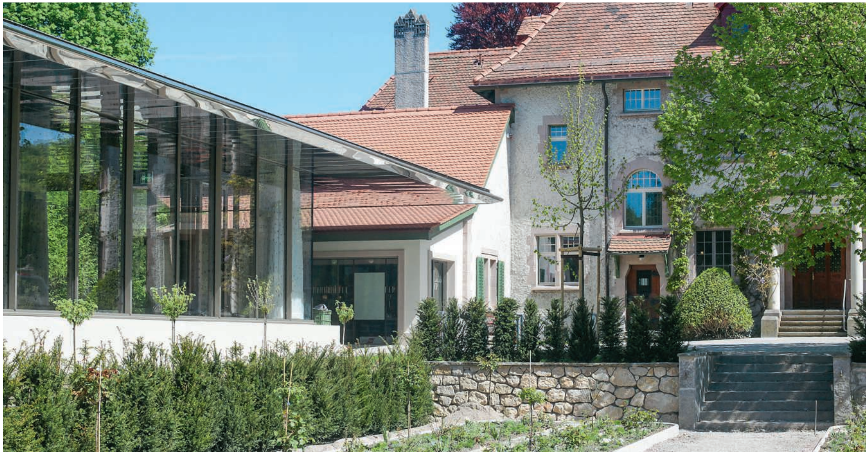
Pavillon, Ticketshop und Villa bilden ein neues Langmatt-Ensemble

Die Gesamtanierung machte zudem vor den Aussenanlagen des Museums Langmatt nicht halt. Da Teile des