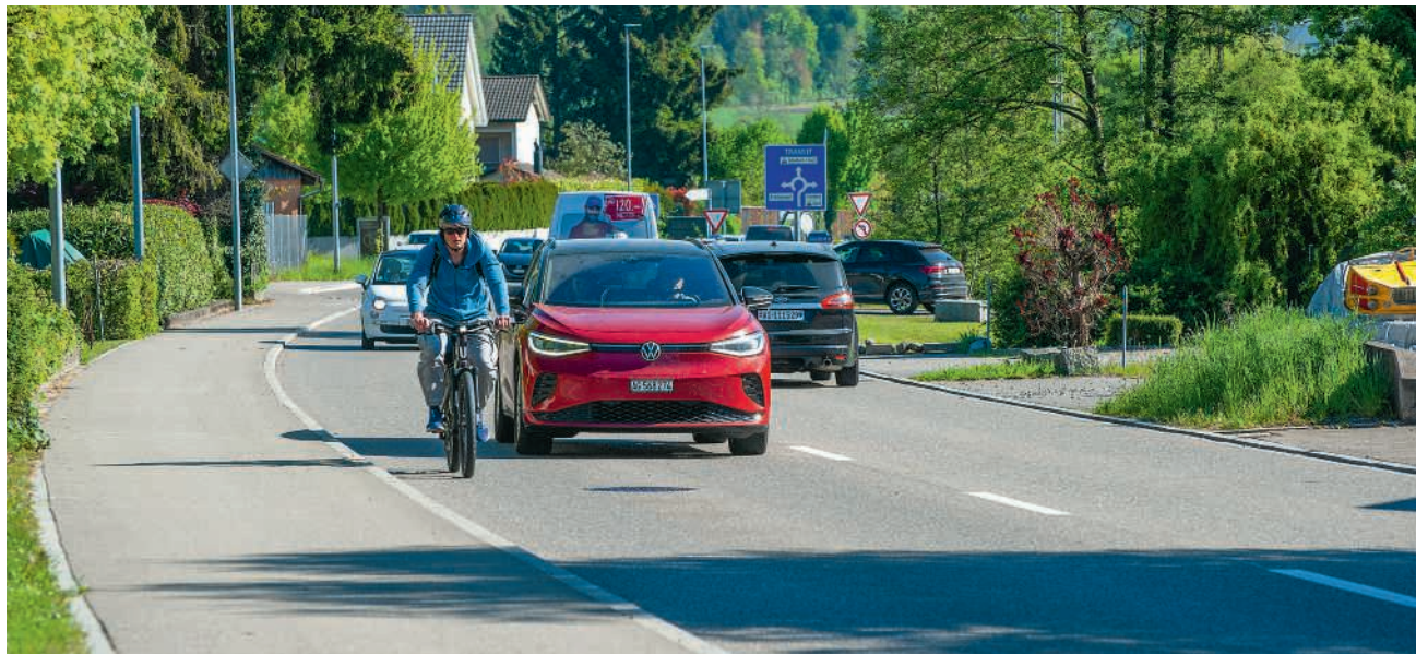
Die Landstrasse – im Hintergrund der Kreisel Niedermatt – wird täglich von 14 000 Autos befahren, für die während der rund zweieinhalb Jahre dauernden Bauarbeiten nur eine Fahrspur zur Verfügung steht

Ein erstes Projekt wurde 2020 vorgelegt und danach überarbeitet. Inzwischen sind die Pläne baureif, und der Kanton will das 11,4 Millionen Franken teure Vorhaben im Frühling 2027 in Angriff nehmen, wie Gemeinderat Dany Amstutz an einer Orientierungsversammlung bekannt gab. Der 1,6 Kilometer lange Strassenabschnitt, den täglich 14 000 Autos und 3 Buslinien befahren, wird für zweieinhalb Jahre zu einer weitgehend