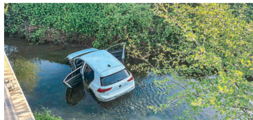
Alle Personen blieben unverletzt

Am Freitag, 1. Mai, dem Tag der Arbeit, ist die Gemeindeverwaltung den ganzen Tag geschlossen.