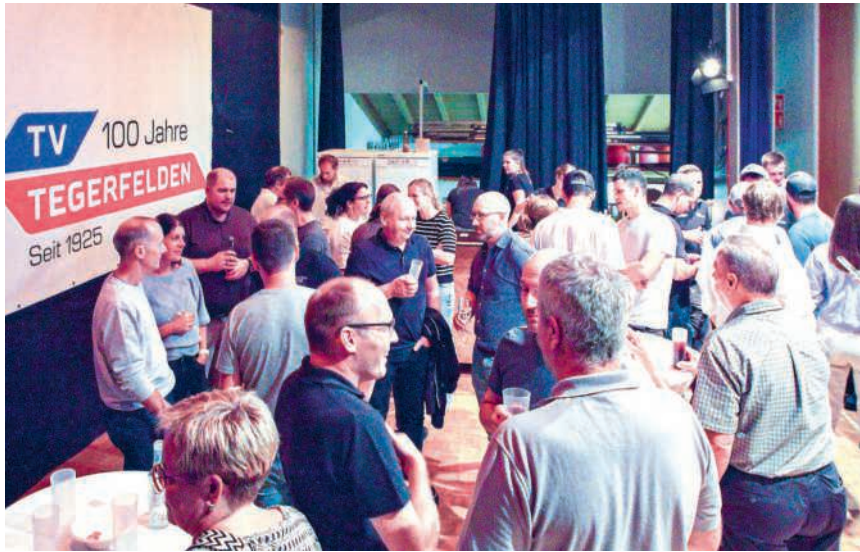
Im vergangenen Jahr feierte der Turnverein sein Jubiläum