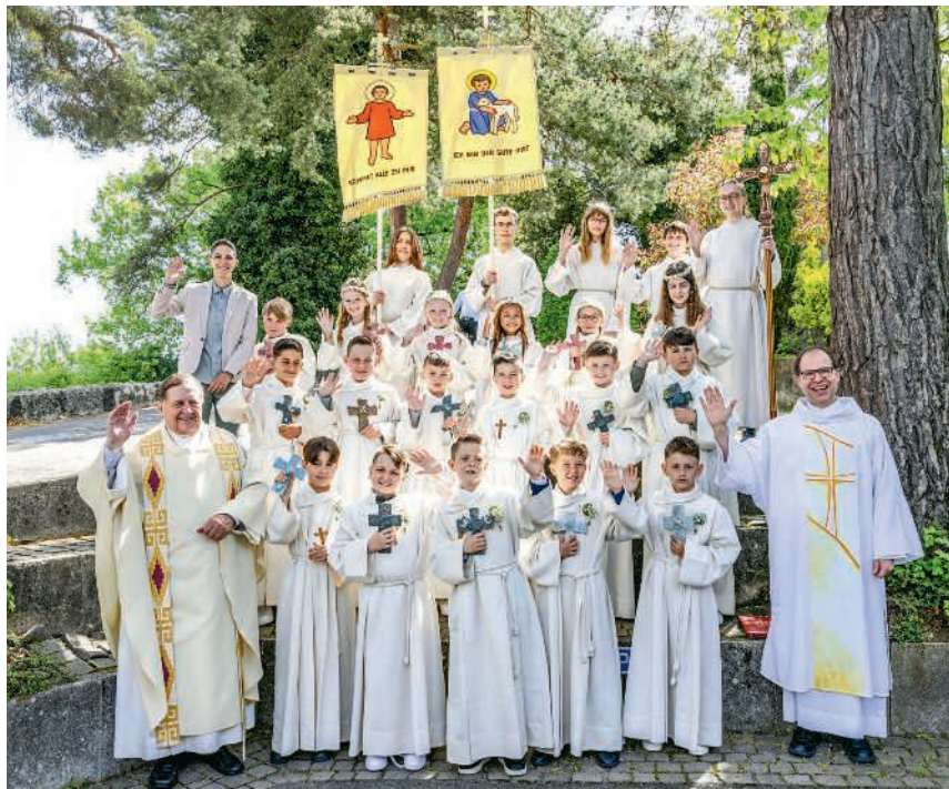
Erstmals im Kreise der Erwachsenen