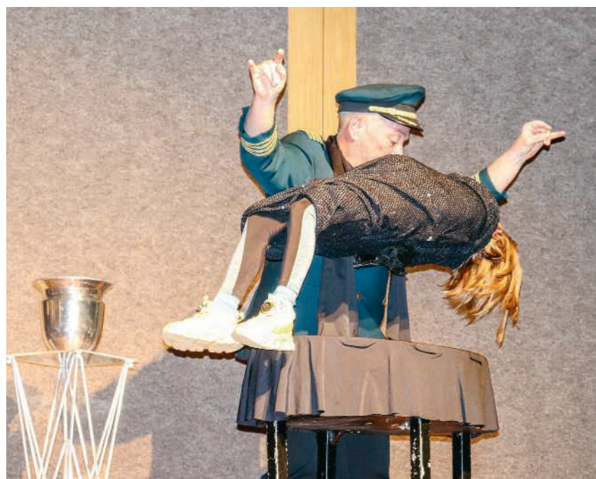
Magische Tricks zur Auflockerung