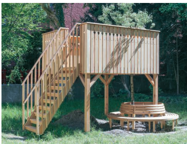
Wiederhergestelltes Baumhaus der Kinder Brown