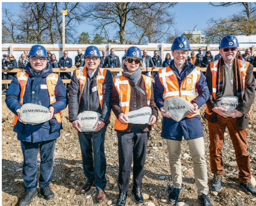
Auf dem Brisgi-Areal sollen preisgünstige Wohnungen entstehen

Auf dem Brisgi-Areal sollen bis 2028 insgesamt 225 Wohnungen für etwa 500 bis 600 Bewohnende entstehen. Das Projekt wird von drei gemeinnützigen Trägerschaften – der Wohnbaustiftung Baden, der Logis Suisse AG und der Graphis Bau- und Wohngenosenschaft – realisiert und verfolgt das Ziel, die angespannte Lage auf dem Badener Wohnungsmarkt zu entschärfen. Symbolisch für die künftige Siedlung wurden fünf beim Aushub gefundene Steine mit den Begriffen «Gemeinsam», «Zukunft», «Nachhaltigkeit», «Zahlbar» und «Wohnen» versehen und sollen später sichtbar integriert werden. Seite 7