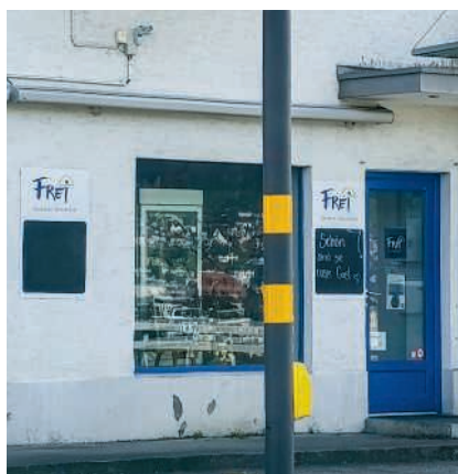
Die Frei-Filiale im Turgeimer Ortsteil Wil wird geschlossen

Der Fachkräftemangel stellt die Branche vor grösste Herausforderungen. Besonders in der Produktion sei es zunehmend schwierig, qualifizierte Mitarbeitende zu finden. Umso wichtiger ist es für die Bäckerei-Konditorei, bestehende Mitarbeitende im Unternehmen zu halten. Wo immer möglich, werden Mitarbeitende aus den betrof-