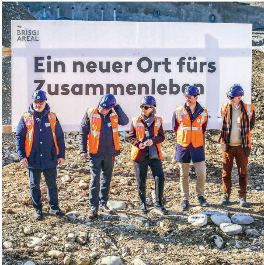
Letzte Woche fand die feierliche Grundsteinlegung für die neue Überbauung auf dem Brisgi-Areal statt

Nun entstehen auf dem Brisgi-Areal bis 2028 insgesamt 225 preisgünstige Wohnungen mit 1½ bis 6½ Zimmern, die Wohnraum für etwa 500 bis 600 zusätzliche Bewohnerinnen und Bewohner bieten sollen. Seit letztem Herbst laufen die baulichen Vorbereitungen für das Grossprojekt. Das