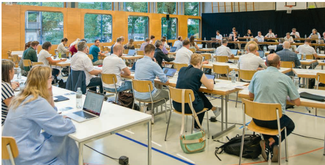
Im September 2023 tagte das Gemeindeparlament in der Turnhalle Meierhof. Die schon damals aktiven Einwohnerinnen und Einwohnerräte wussten so um den baulichen Zustand der Halle, deren Sanierung nun zusätzlich ins Bauprogramm für die Schule Meierhof aufgenommen wurde