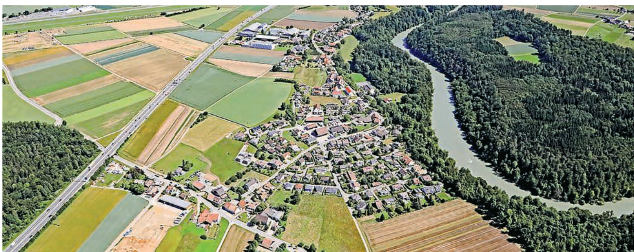
Der Birreter Gemeinderat will aus der Kreisschule Oberstufe Eigenamt aussteigen