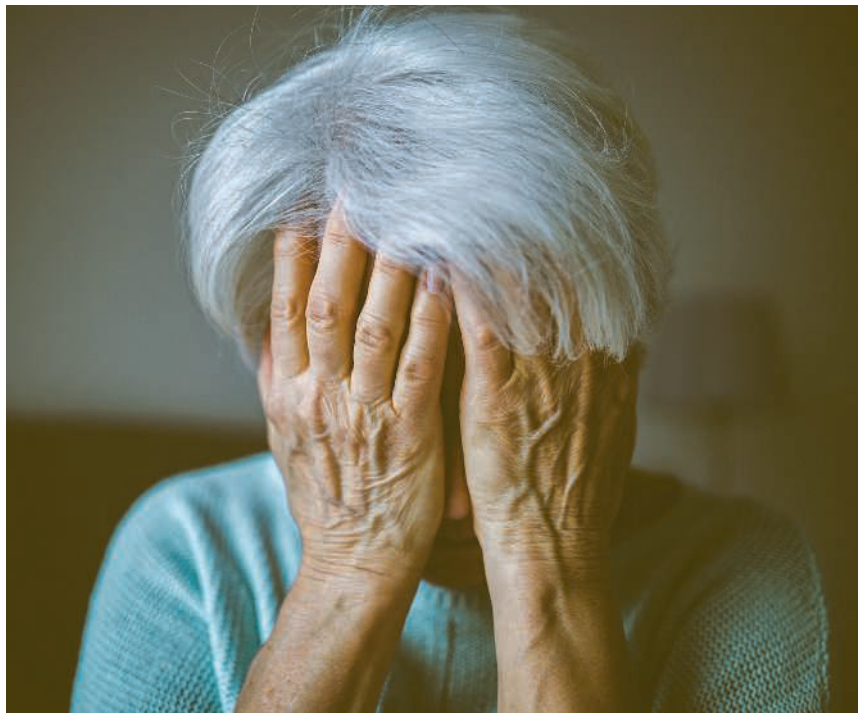
Gewalt im Alter: Scham, Abhängigkeit und Angst halten viele Betroffene davon ab, Hilfe zu suchen

Fachstellen, Polizeikörper und Organisationen aus dem Bereich Alter und Opferhilfe versuchen nun, dieses Schweigen zu brechen. Sie rufen ältere Menschen und ihr Umfeld dazu auf, über belastende Erfahrungen zu sprechen und Unterstützung anzunehmen. Denn die Realität zeigt: Gewalt im Alter ist ein gesellschaftliches Tabu, und das Dunkelfeld ist enorm. Eine Untersuchung der Fachhochschule La Source im Auftrag der Schweizerischen Kriminalprävention verdeutlicht, weshalb ältere Menschen so selten Hilfe suchen. Viele sind gesundheitlich angeschlagen und auf Unterstützung angewiesen. Oft von genau jenen Personen, von denen die Übergriffe ausgehen. Die Angst, die Kontrolle über das eigene Leben zu verlieren, in ein Heim ziehen zu müssen oder Beziehungen zu gefährden, wiegt schwer. Hinzu kommt eine Generationenhaltung, bei der familiäre Probleme lieber intern gelöst werden. Für