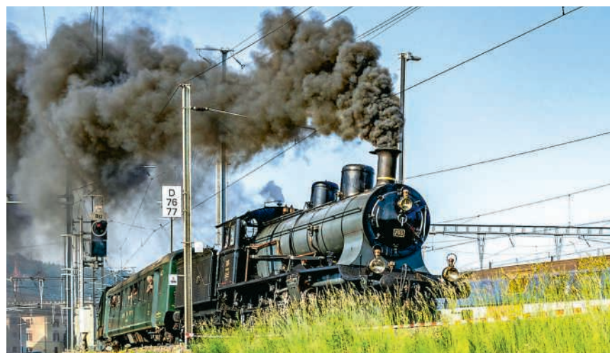
Eine Dampflokomotive live zu erleben ist ein Highlight für Gross und Klein