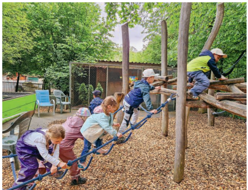
Kinder aus Endingen klettern im Zoo Hasel