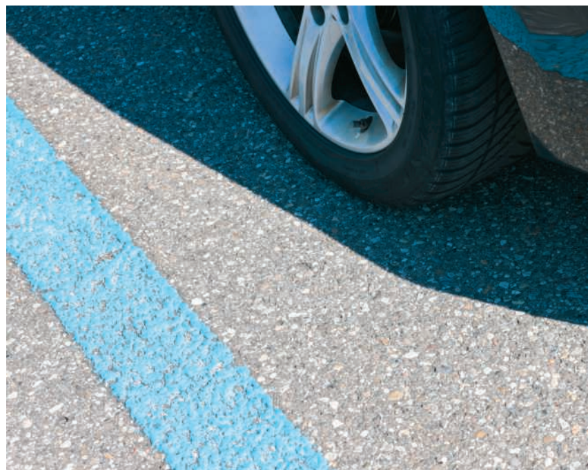
Das Parkieren in Brugg wird neu geregelt

Das revidierte Reglement soll die Grundlage für eine moderne, einheitliche und nachhaltige Parkraumbewirtschaftung bilden – dies in Form einer neu geschaffenen Parkierungsverordnung. Sie befindet sich bis zum 15. Juni in der Phase der öffentlichen Anhörung. Frau Stadtammann Barbara Horlacher und Daniela Nay, die Vorsteherin der zuständigen Abteilung, erläuterten die Eckpunkte der Totalrevision derweil im Salzhaus. Vor einem interessierten Publikum sagten sie unter anderem, dass es auf öffentlichem Grund künftig nur noch zeitlich begrenzte und gebührenpflichtige Parkplätze geben soll. Seite 5