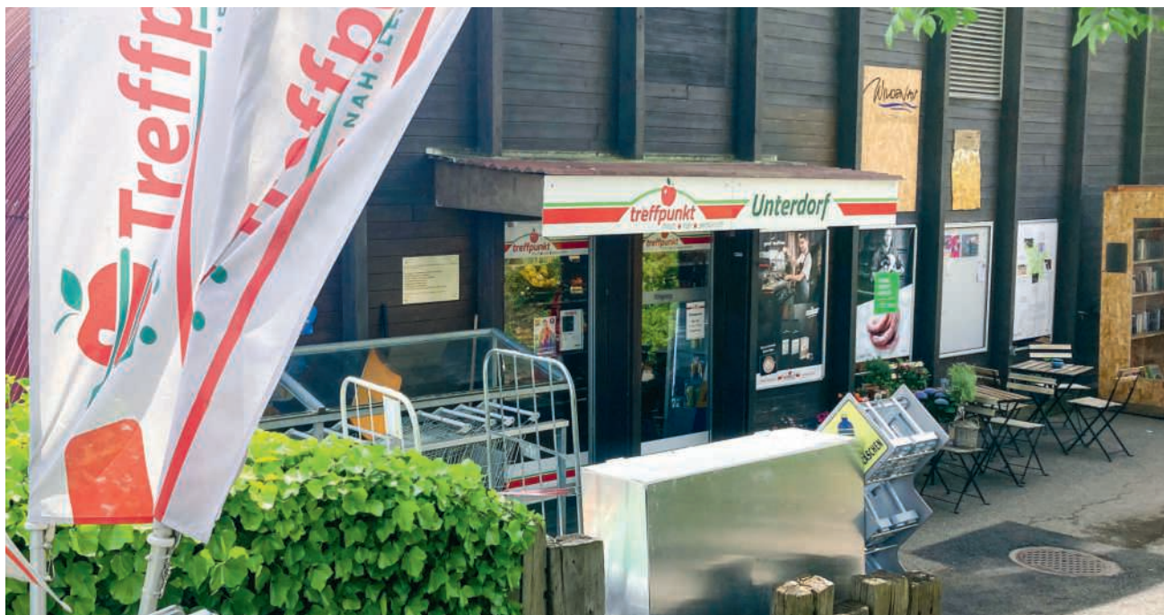
Der «Treffpunkt» in Unterwindisch

Auch beim Wein habe der Ladenbetreiber sein Sortiment radikal umgestellt und viel mehr Produkte von lokalen Winzern ins Sortiment genommen, ergänzt Conrad Stoll vom zuständigen Verein Quartierladen Unterwindisch. «Die Menschen im Quartier fühlen sich mit ihren An-