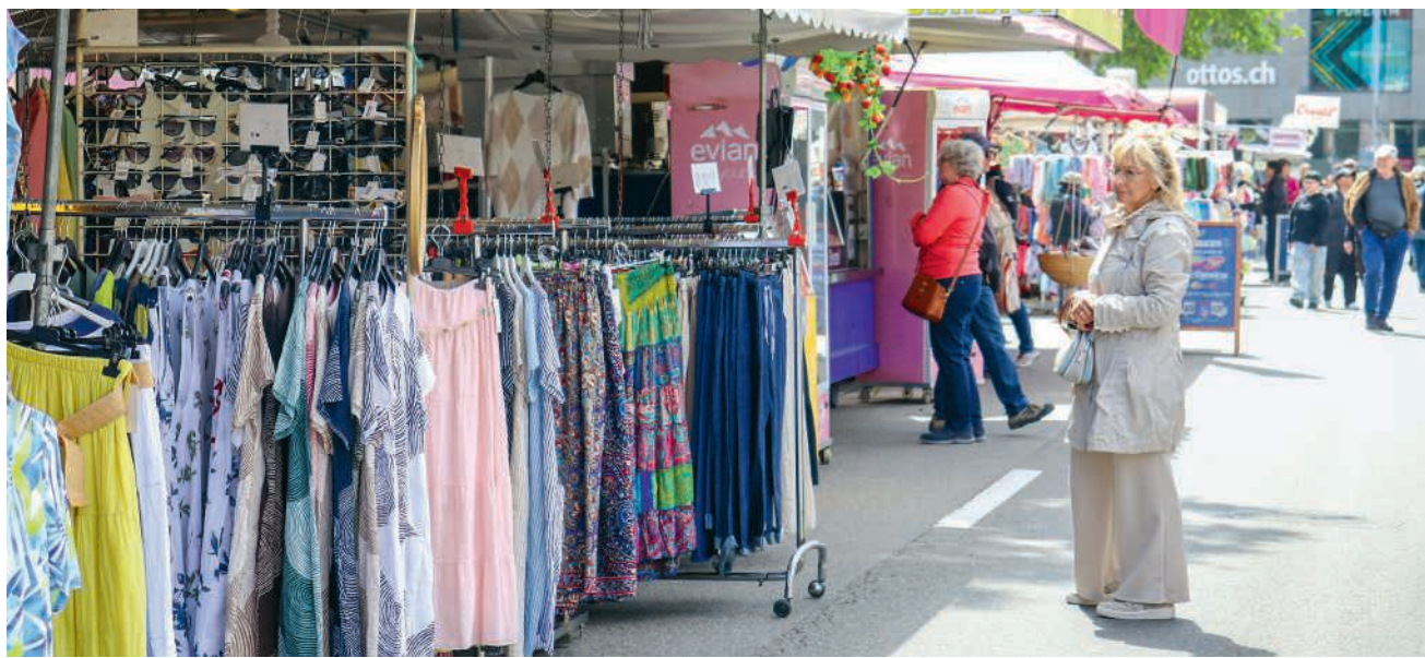
Der Maimarkt gehört seit Jahren zum Bruggen Veranstaltungskalender

Familien, Ausflügler und Stammgäste bildeten ein buntes Publikum. Der Maimarkt gehört nebst dem Martinmarkt und dem Chlausmarkt seit Jahren zum festen Bestandteil im Bruggen Veranstaltungskalender.