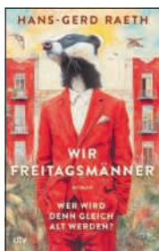
Roman von Hans-Gerd Raeth dtv, 2026

Der Untertitel «Wer wird denn gleich alt werden?» bringt das Thema dieses unterhaltsamen Wechseljahr-Romans bereits auf den Punkt: Henri ist eigentlich in den besten Jahren. Seine Ehe ist zwar gescheitert, seine Ex will mit ihrem jungen Lover auswandern, und sein Date unterstellt ihm, sich auf den Bildern im Datingprofil verjüngt zu haben. Das alles wäre nicht so schlimm, wenn sich nicht bei ihm wirklich plötzlich Alterserscheinungen bemerkbar machen würden. Die paar kleinen Löcher im Bart sind ja noch harmlos, aber der hedonistische Lebensstil macht sich auch in der Gesundheit bemerkbar. Um seiner Traumfrau näherzukommen, meldet er sich bei ihr für ein Coaching an. Eine der ersten Fragen, die sie ihm stellt: «Stellen Sie sich vor, Ihr Leben dauert eine Woche. Welcher Tag ist heute?» Henri entscheidet sich für Freitag. Freut er sich auf das Wochenende? Ein witziger, schneller Roman mit vielen kleinen Pointen, gekonnt stereotypen, aber realistischen Figuren, welcher sich um die Fragen des Älterwerdens dreht. Ein Buch für Männer in den besten Jahren, welches aber auch für Frauen durchaus lesenswert ist.