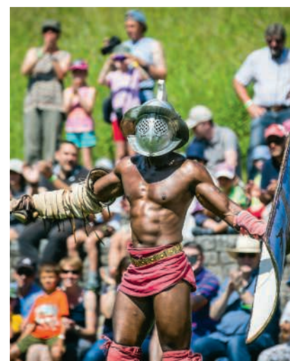
Gladiatoren sorgen für dramatische Szenen während des Kampfs