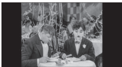
Lichter der Grossstadt, US 1931, Prime Video/Apple TV/DVD