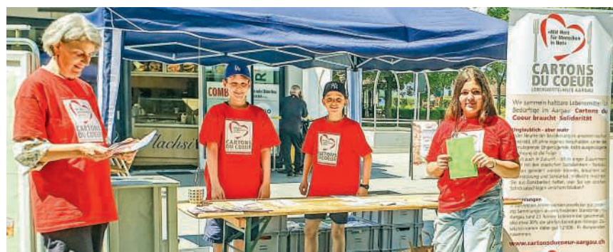
Schulkinder sammeln Lebensmittel und Geldspenden