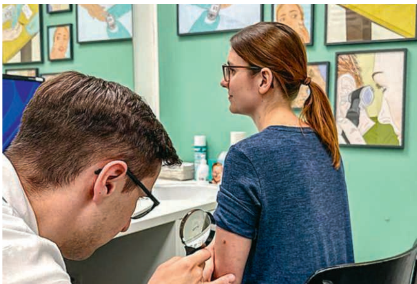
Schützen Sie sich jetzt gegen Hautkrebs