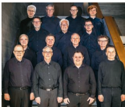
Konzert mit dem Männervokalensemble Cantata Libre