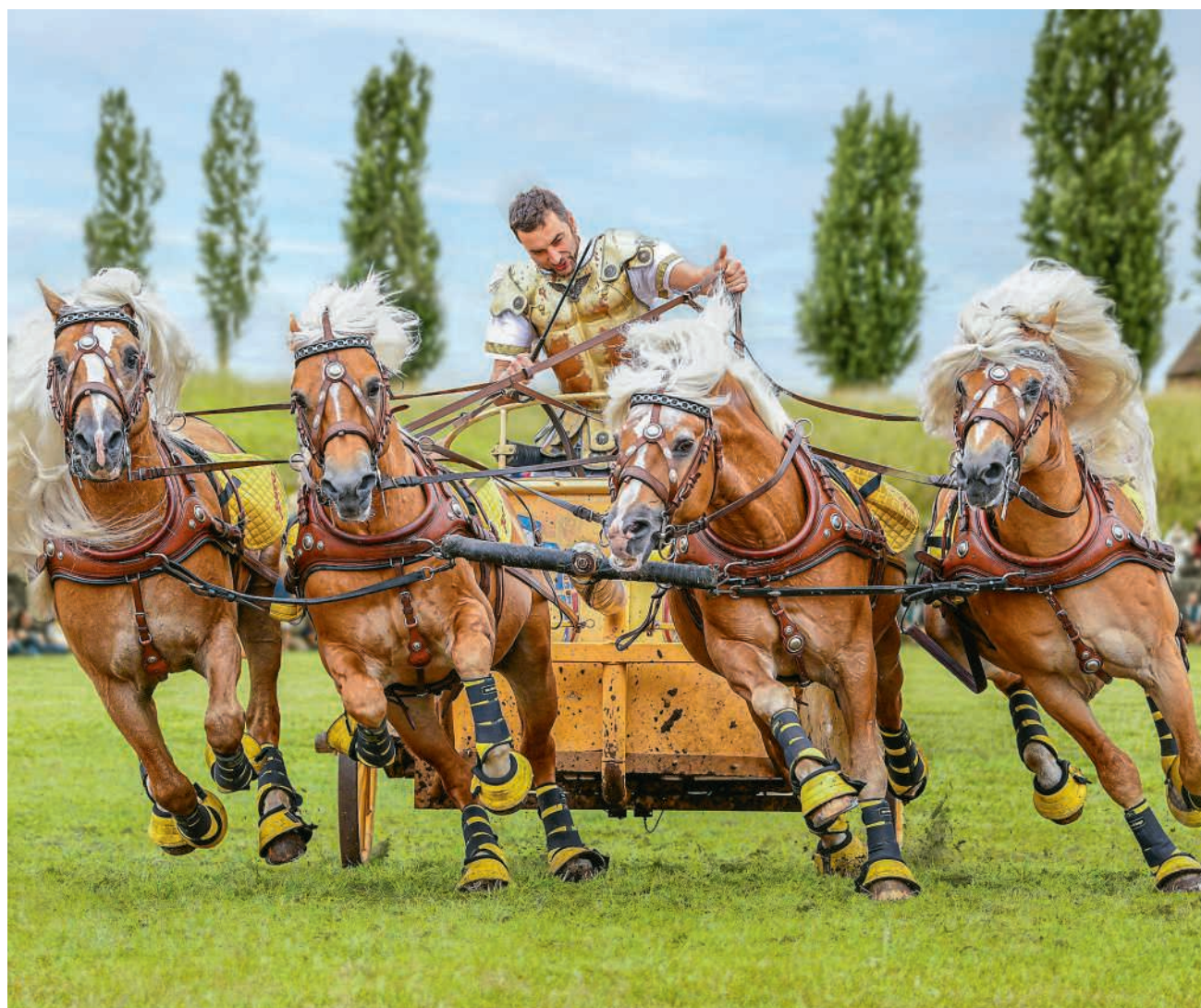
Die Wagenrennen sind ein grosses Highlight am Römertag