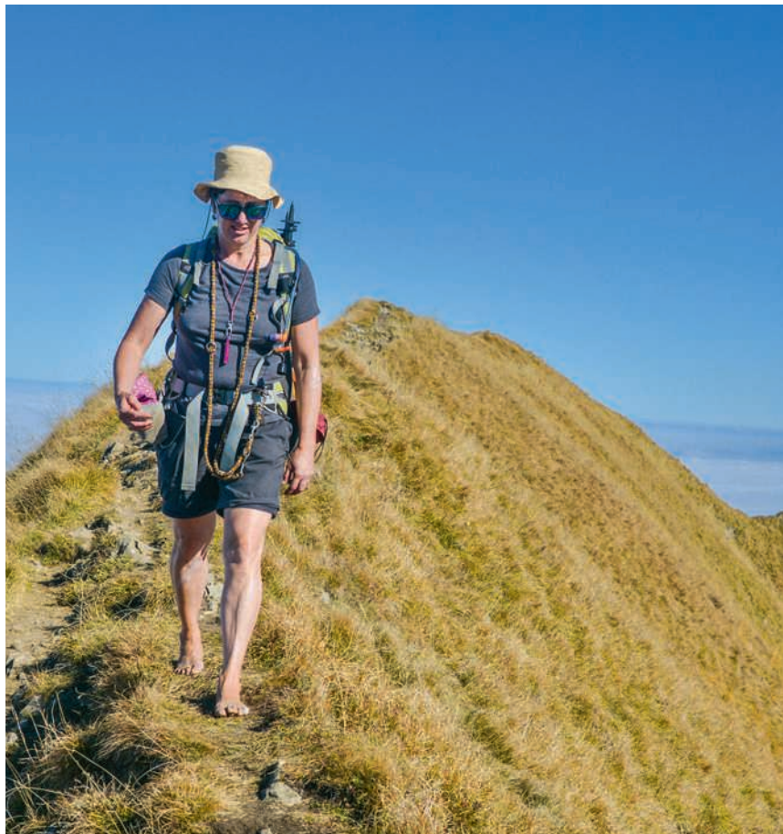
Die Barfüsserin auf dem Grat zwischen Pilatus und Widderfeld

Zu Beginn sei sie die Sache etwas zu begeistert angegangen, sagt Burkhard, doch bereits nach wenigen Wochen habe sie gespürt, dass es etwas bringe. Tatsächlich verschwanden beide Beschwerden, und die Mutter zweier erwachsener Kinder erfuhr eine deutliche sensorische Horizontenerweiterung. Heute erlebt sie einen Marsch über weiches Moos, feuchten