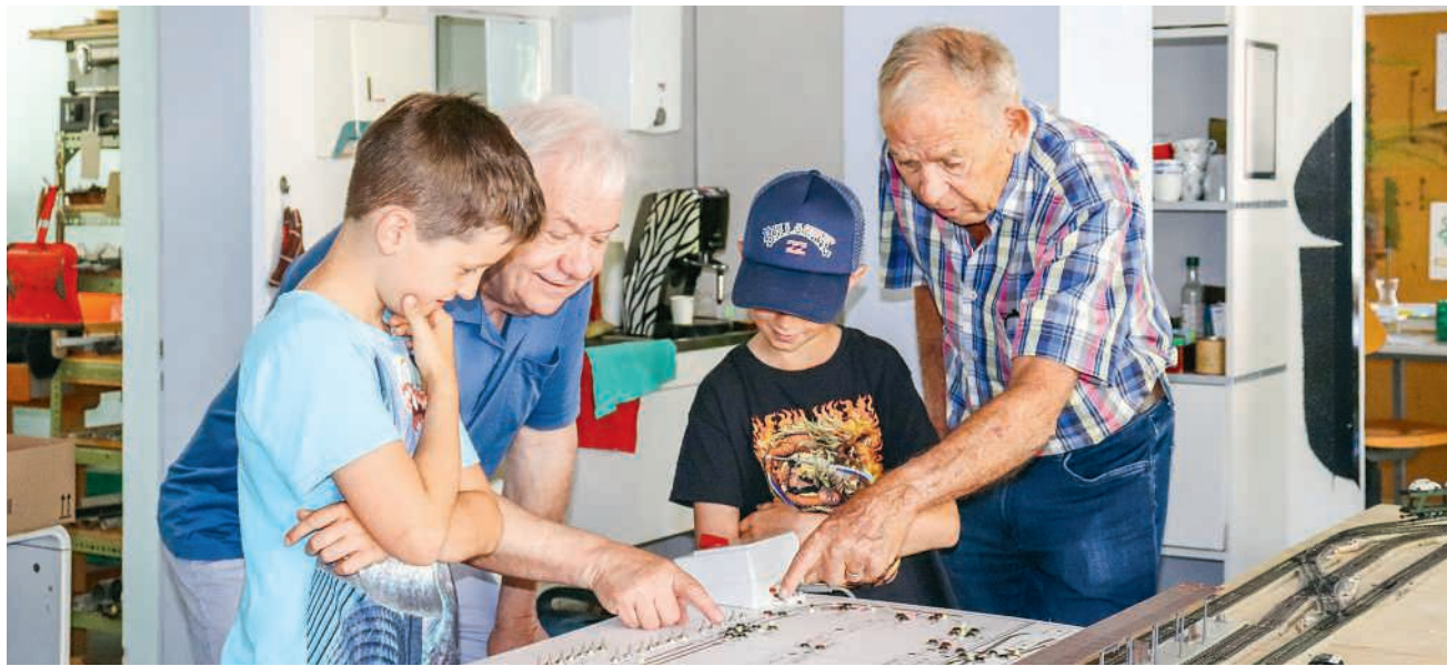
Jung und Alt begeistern sich für die Modelleisenbahntechnik

Der Verein Tourismus Region Brugg hat mit dem Bahnfestival die Vernetzung der zahlreichen Bahnangebote in der Region erfolgreich organisiert. Während der Bahnpark Brugg seit vielen Jahren über Pfingsten das Bahnfest veranstaltet, wurde das Angebot in diesem Jahr erstmals im Rahmen des Bahnfestivals erweitert. Insgesamt beteiligten sich neben dem Bahnpark 18 weitere Organisationen aus der Region und präsentierten die Vielfalt der Bahnangebote.