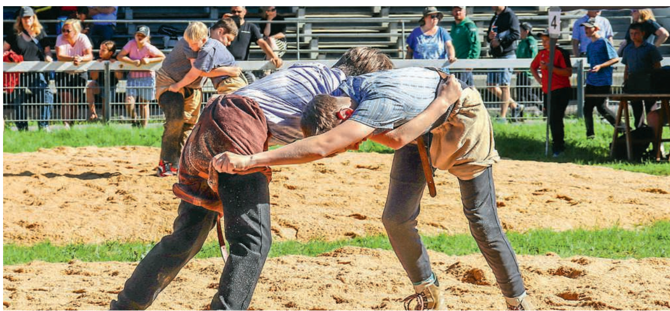
Brugg wurde am Samstag zum Zentrum des Aargauer Schwingsports

Neben den Sägemehlingen herrschte reger Betrieb. In der Festwirtschaft gab es regionale Spezialitäten, ein Weinbrunnen sorgte für zusätzliche Stimmung, und viele Gäste nutzten die Gelegenheit zum Austausch mit Freunden und Schwingbegeisterten. Am späten Nachmittag fanden die Schlussgänge statt, bevor die Rangverkündigung mit einem Lebendpreis für den Sieger den sportlichen Teil abrundete.