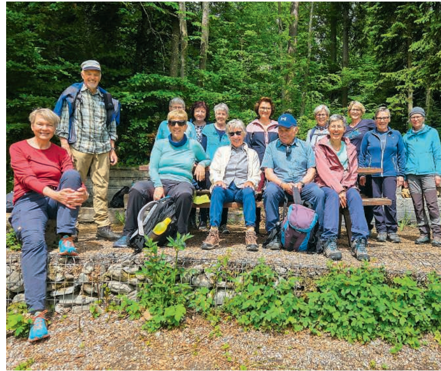
Pause im Naherholungsgebiet zwischen Zürichsee und Zürcher Oberland