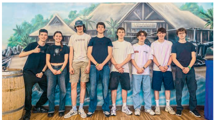
Wertschätzung für die geleistete Arbeit

Der Spass durfte natürlich nicht fehlen: Bei einer Bowlingpartie traten die Jugendlichen in lockerer Atmosphäre gegeneinander an und liessen den Nachmittag gemütlich ausklingen. Den Abschluss des gelungenen Tages bildete ein gemeinsames Abendessen im McDonald's, bei dem nochmals viel gelacht und über die Erlebnisse des Tages gesprochen wurde. Solche Aktivitäten stärken nicht nur den Zusammenhalt innerhalb des Kernteams, sondern zeigen auch, wie wichtig das freiwillige Engagement der Jugendlichen für den Jugendtreff Lokara ist.