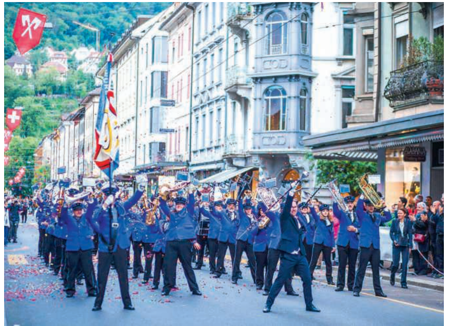
Die MGW am Ende ihrer Parade

Die Musikantinnen und Musikanten der MG Würenlingen spürten spätestens nach dem gelungenen Aufgabenstück, dass jetzt auch ihr Selbstwahlstück «D'MGW (ver)zauberet» einfach klappen musste. Und genau so sollte es auch sein. Harry Potter zauberte, Jasmin und Aladin flogen auf dem Teppich durch die Lüfte, die Iren tanzten und auch Moana stach mit