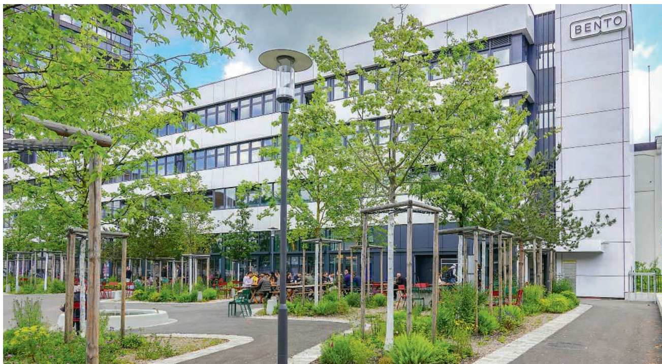
Die Markthalle im Bento-Gebäude am Brown-Boveri-Platz

Die feierliche Eröffnung der «Hallo Halle» findet am 30. Mai statt. Bis dahin läuft der Betrieb an, damit man langsam auf Touren kommt. Und keine Angst: dank mitgebrachter Tupperware wurden am Ende alle Lebensmittel ihrem ursprünglichen Zweck zugeführt.