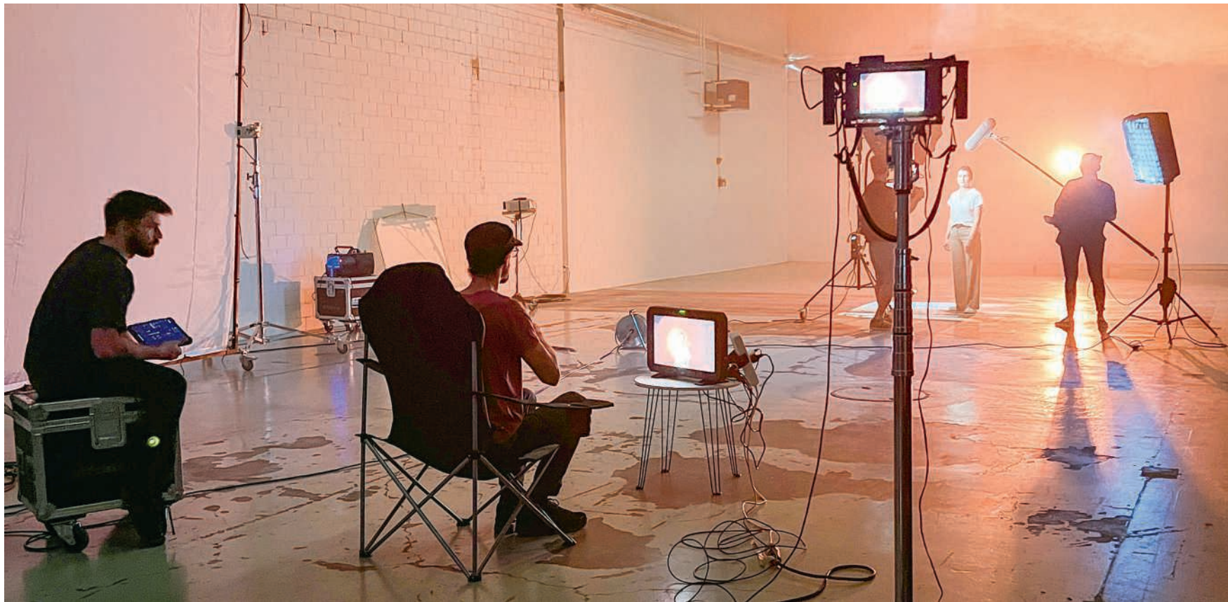
Ruhe am Set