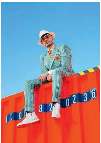
Schweizer Musikstar Dodo kommt ins Surbtal