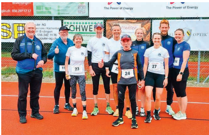
Das Team der LG Horn