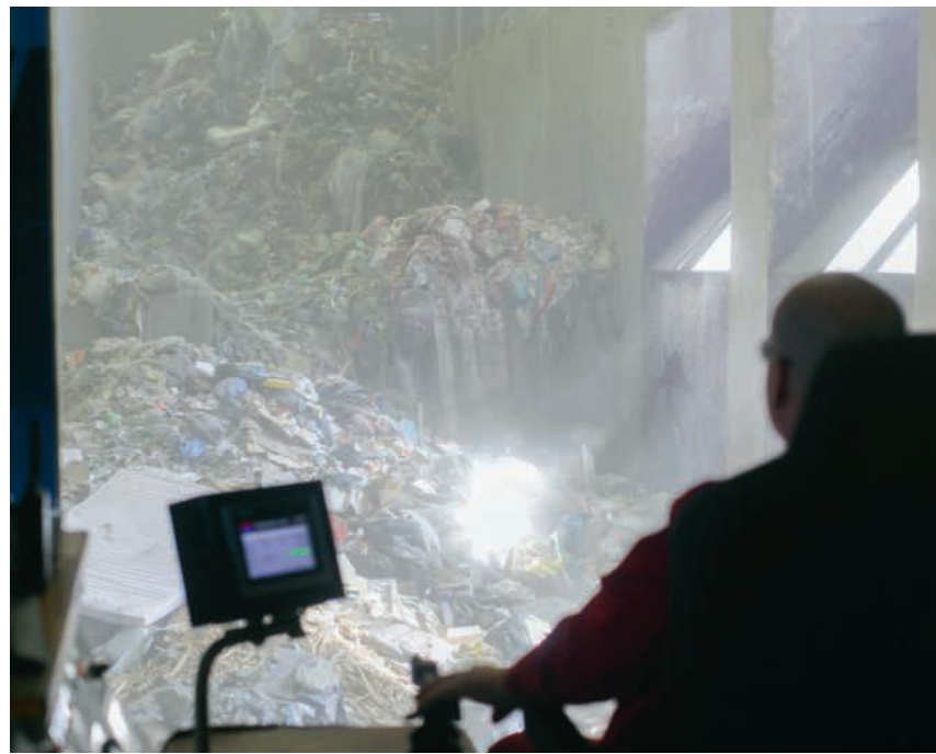
Kranführer in der KVA Turgi

Seit über 50 Jahren landet der Grossteil des Mülls aus der Region im Schlund von zwei Ofenlinien. Diese haben nun allerdings das Ende ihrer Lebensdauer erreicht und sollen in den kommenden Jahren durch einen Neubau ersetzt werden. Obwohl die Verantwortlichen der KVA Turgi davon ausgehen, dass die anfallende Müllmenge in der Region stabil bleiben wird, soll die neue Anlage den Output an Wärmeenergie dank moderner Technologie vervielfachen. Davon profitieren die grossen Wärmeverbünde der Region – namentlich die Regionalwerke Baden AG, die ihr Fernwärmenetz derzeit massiv erweitert. Seite 4