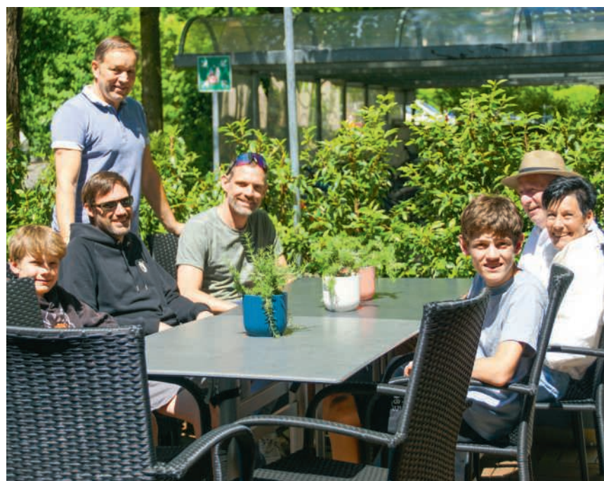
Die neu gestaltete Terrasse

«Wir möchten einen Ort schaffen, an dem Menschen gerne zusammen-