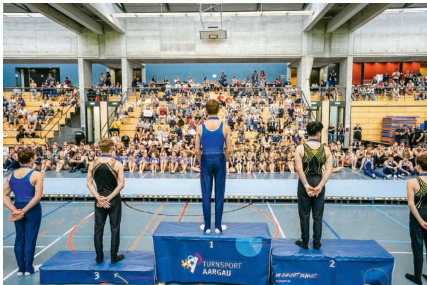
Das Ziel der Sportlerinnen und Sportler

Auch für das leibliche Wohl ist gesorgt: Die Festwirtschaft des DTV Obersiggenthal bietet an beiden Tagen unter anderem Schnitzelbrot, Asia-Nudelpfanne, Pommes und Chicken-Nuggets an. Gegen den kleinen Hunger gibt es hausgemachte Sandwiches, und am Kuchenbuffet warten verschiedene kleine und grosse Naschereien. RS