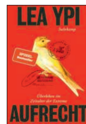
Roman von Lea Ypi Suhrkamp, 2025