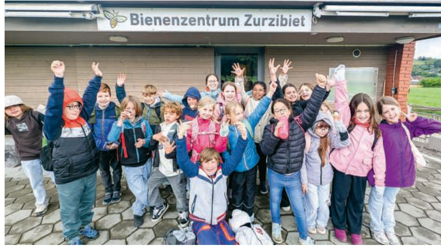
Die Schülerinnen und Schüler aus Unterendingen im Bienenzentrum

Das Highlight des Besuchs dürften ein Bienenkasten von innen und das Halten der Drohnen gewesen sein. Die männlichen Bienen können nämlich nicht stechen. Dass die Bienen nicht primär für die Honigproduktion so wichtig sind, sondern für die Bestäubung der Pflanzen, ist ein wichtiger Fakt. Trotzdem freuten sich die Kinder sehr über das Honigtöpfchen, und einige schleckten es sogleich genüsslich auf. Vielen Dank an Sigi Meier für den interessanten Einblick in die Imkerei.