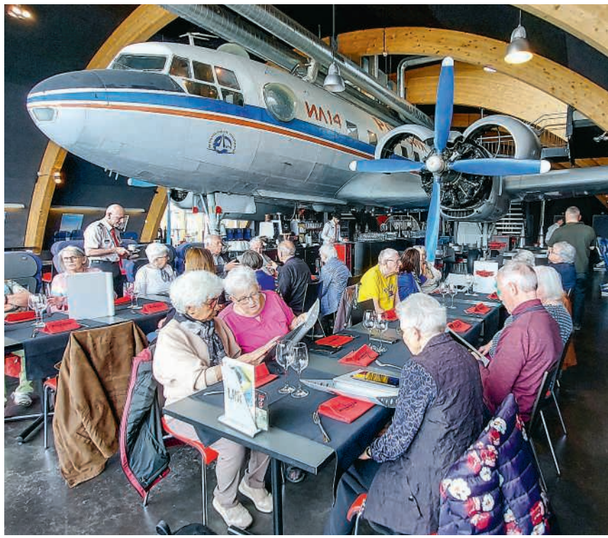
Zvieri im Hangar

Für das Mittagessen fuhr die Gruppe ins Restaurant Sonne in Dielsdorf, einen typischen Dorfgasthof, in dem bereits General Guisan, der ehemalige deutsche Bundeskanzler Schröder und etliche arabische Scheichs diniert haben sollen. Die Gäste wurden mit gutem Essen und herzlicher Bedienung durch Mitarbeitende der Stiftung Vivendra verwöhnt. Für den Besuch des Stiftungslädli nebenan blieb leider keine Zeit – doch vom Surbtal ist es ein kurzer Weg nach Dielsdorf, und einige nah-