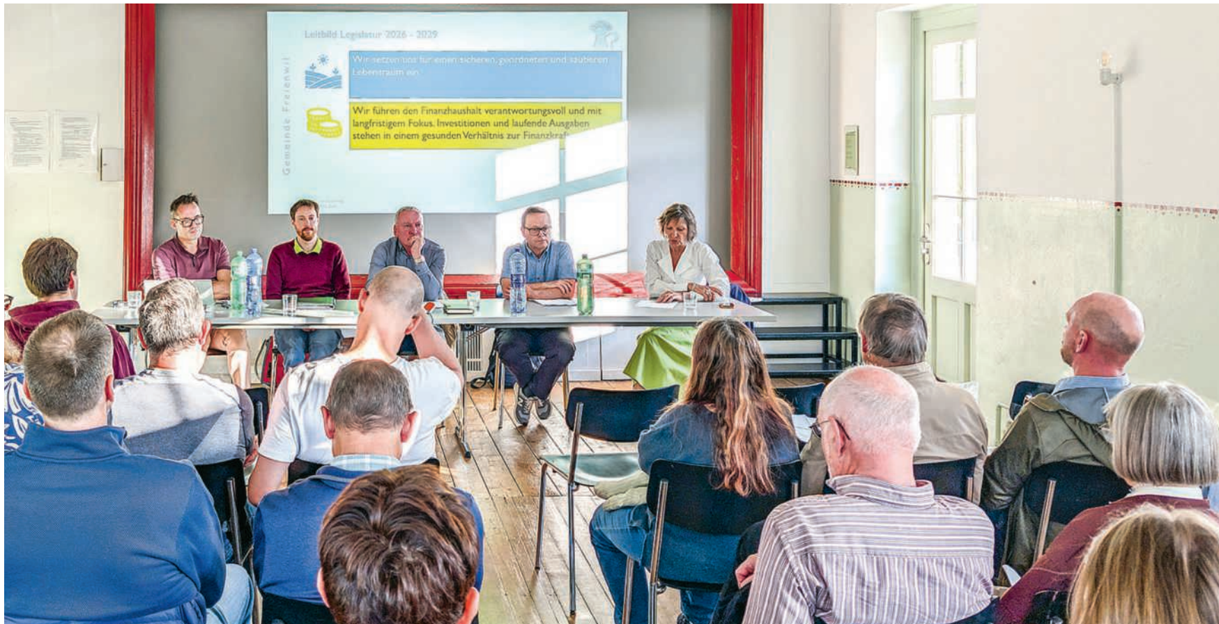
Der Gemeinderat im Obergeschoss des «Weissen Winds»