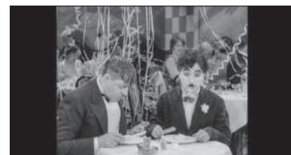
Lichter der Grossstadt, US 1931, Prime Video/Apple TV/DVD