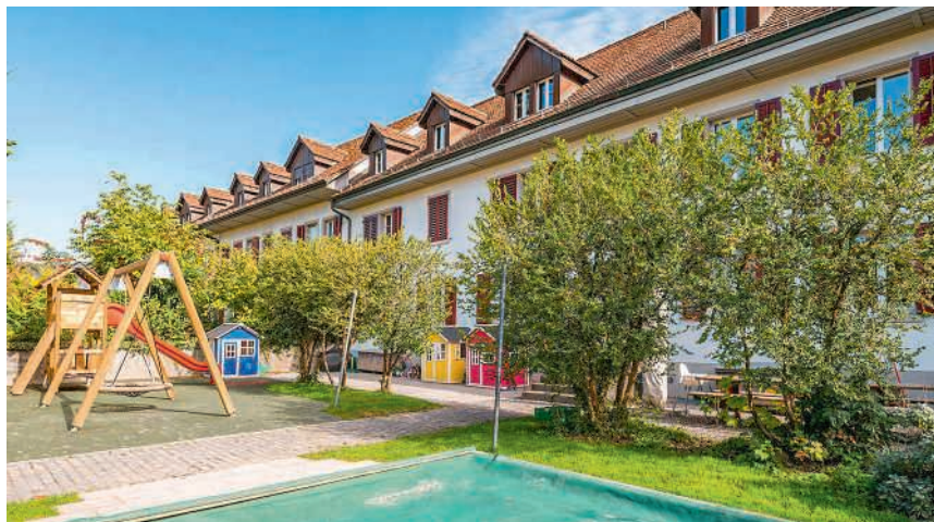
Die Kita Chlostergarte verfügt über einen grosszügigen Garten, in dem sich die Kinder austauschen können

Bereits wenige Monate später, am 1. April 2001, wurde der Verein Kita Chlostergarte gegründet, damals eine der ersten Kindertagesstätten in Wettingen. Kurz darauf nahm die Kindertagesstätte in der Vierzimmerwoh-