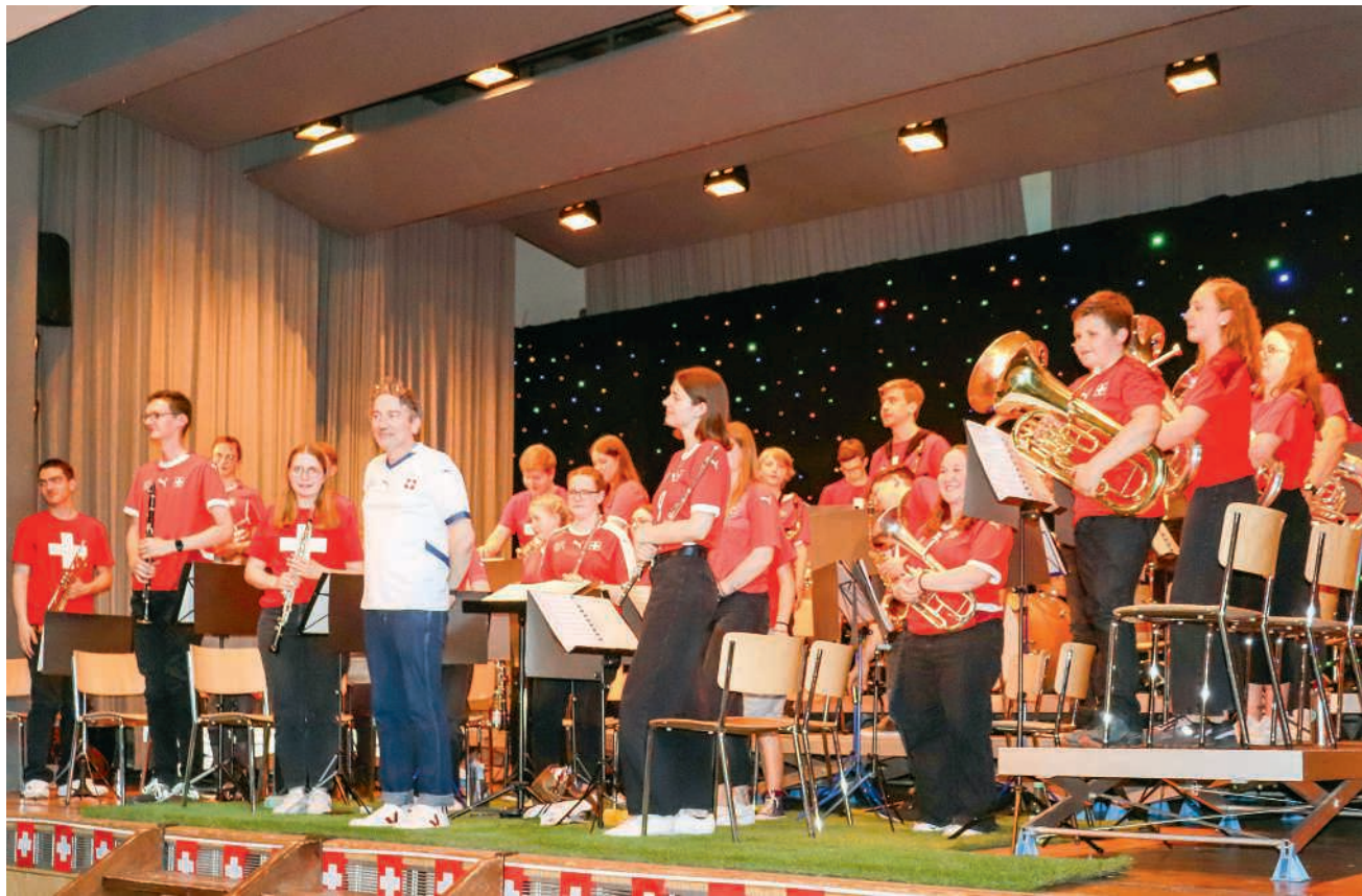
Einstimmung auf den Schweizer WM-Auftakt am 13. Juni

Pünktlich um 20.15 Uhr folgte der musikalische Anpfiff. Das JSS bewies von