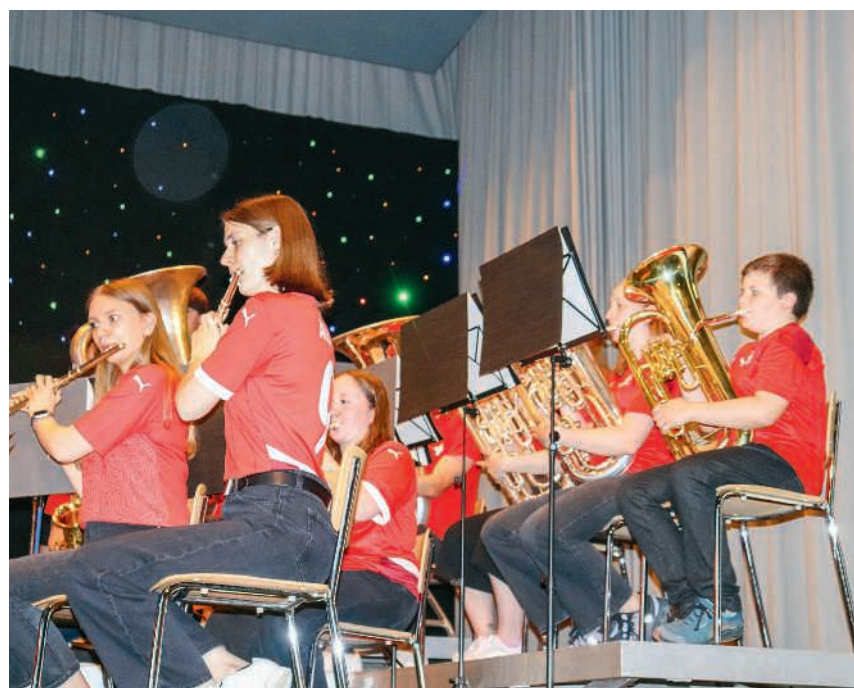
Wer konnte, zog das Liibli der Schwiizer Nati an