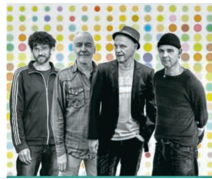
Blues Max Combo