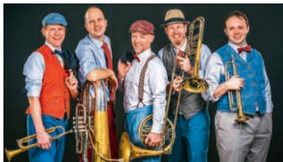
Generell 5