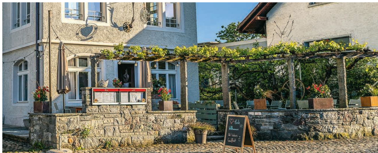
Im Aargau am besten bewertet: Der «Weisse Wind» in Freienwil

Wer braucht allenfalls Unterstützung beim Fahrdienst oder hat sonstige Wünsche. Mit viel Gespür für die Bedürfnisse der älteren Generation schuf sie eine Atmosphäre, in der sich alle willkommen fühlten. Auch die Gemeinde weiss dieses Engagement zu