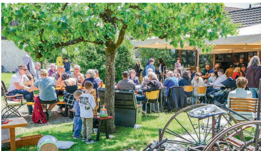
Besucheransturm im Ortsmuseum