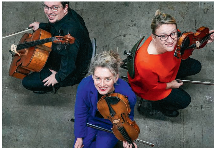
Das Mondrian-Ensemble verbindet alte und neue Musik

Freitag, 5. Juni, 18.30 Uhr, Historisches Museum, Baden