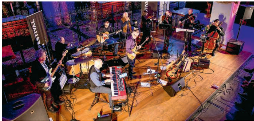
Bluesfestival Baden: Blues 'n' Classic