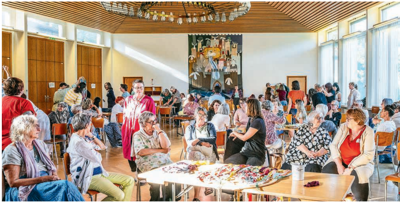
Lebendiger Austausch an der Tagung von Frauen Aargau

Das Netzwerk Frauen Aargau hat seine Wurzeln im Frauenstreik von 1991. Aus der Idee eines überparteilichen Frauennetzwerks entstand 1992 die Frauenlandsgemeinde Aargau, die Frauen aus Politik, Kultur und Gesell-