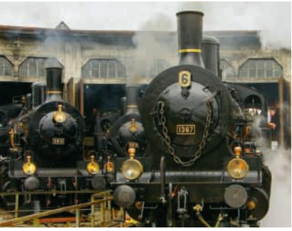
Bahnpark in Brugg