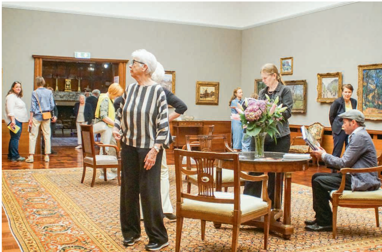
Die Galerie fand grosses Interesse und lud zum Verweilen ein

Die Jugendstilvilla gewährt heute Einblicke in das grossbürgerliche Wohnen der Belle Époque. 2020 stand man vor der schwierigen Entscheidung, das Museum Langmatt zu schliessen oder Bilder aus der Sammlung zu verkaufen. Das war in Fachkreisen umstritten, wohl aber der einzige Weg, das Museum zu retten. Im November 2023 konnten in einer Auktion in New York drei Gemälde von Paul Cézanne verkauft werden. Mit dem Erlös von 40,3 Millionen Franken wurde das Stiftungskapital gestärkt. Dadurch konnte der Betrieb des Museums aus dem Ertrag des Stiftungskapitals auf absehbare Zeit gesichert werden. Im Juni 2023 sprach sich die Badener Stimmbevölkerung zudem mit einem rund 80-Prozent-Ja-Anteil dafür aus, sich mit 10 Millionen Fran-