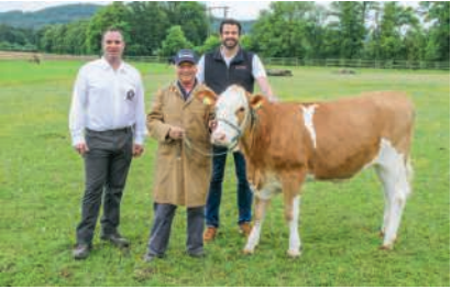
Rind Salsa ist der Siegespreis

Samstag, 23., und Sonntag, 24. Mai 10 Uhr, diverse Orte bahnfestival-brugg.ch