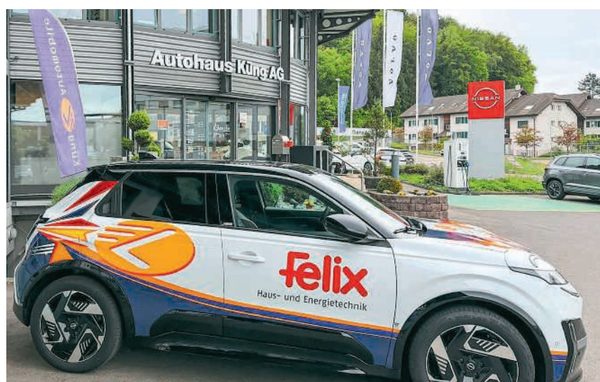
Zusammenarbeit auf Augenhöhe: Felix & Co. AG und Küng Automobile AG

Im Zuge der laufenden Modernisierung wurde der Fuhrpark kürzlich um ein weiteres vollelektrisches Fahrzeug erweitert. Der brandneue vollelektrische Nissan Micra setzt neue Massstäbe in Sachen Design und Funktionalität. Gleichzeitig werden mehrere Nutzfahrzeuge durch neuere Modelle mit