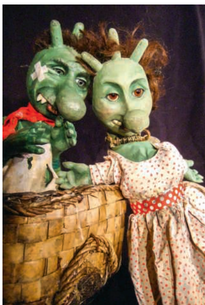
Die Olchis führen ein Schmuddelleben