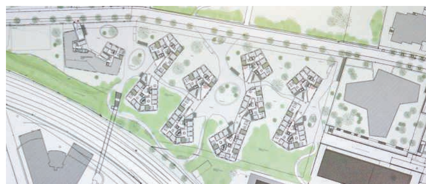
Auf den heutigen Parkfeldern der Verenaäcker sollen fünf Gebäudekomplexe entstehen

Auf dem rund 20 000 Quadratmeter grossen Areal ist schon lang eine Wohnüberbauung angedacht. Allerdings kam nach längerem Stillstand erst wieder Bewegung in die Sache, nachdem die ABB das Gelände Ende des Jahres 2023 verkauft hatte. In den nächsten Jahren sollen auf dem Areal weit über 150 Wohnungen entstehen. Geplant sind 22 2 ½-Zimmer-, 55 3 ½-Zimmer-, 71 4 ½-Zimmer- sowie 16 5 ½-Zimmer-Wohnungen, wobei der Schwerpunkt bewusst auf 3 ½- und 4 ½-Zimmer-Wohnungen liegt, die vor allem an Familien verkauft und vermietet werden sollen. Viele Wohnungen verfügen über doppelstöckige Loggien. Insgesamt rechnen die Verantwortlichen mit etwa 350 Bewohnerinnen und Bewohnern. Neben Eigentumswohnungen sind im west-