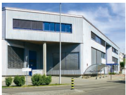
Der bestehende Standort von Hitachi in Wettingen

Besonders schwer wiegt nach Ansicht des Gemeinderats die mögliche