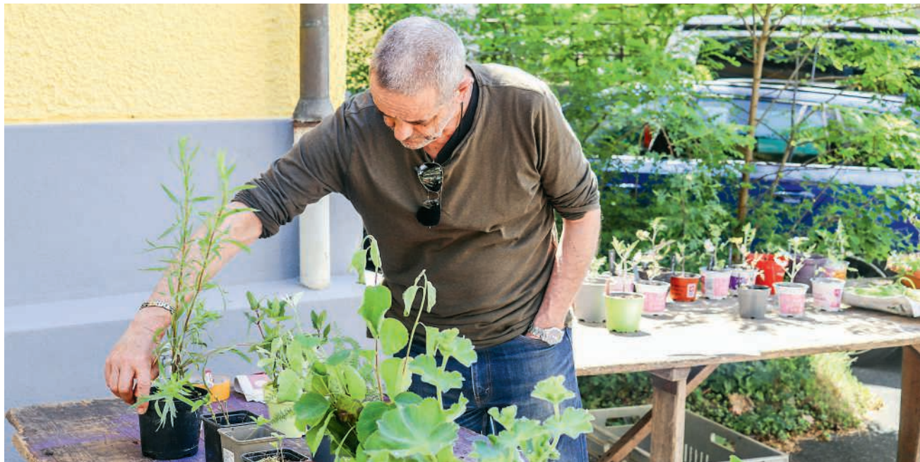
Der Pflanzentausch sorgt für mehr Biodiversität in Gärten und Wohnungen

Wer keine eigene Pflanze dabei hatte, ging trotzdem nicht leer aus: Man durfte nach Herzenslust tauschen, verschenken und fachsimpeln. Die Stimmung war gelöst, das Wetter spielte mit, und wo das Gespräch über Gartentipps aufblühte, wuchsen neue Bekanntschaften. Der Pflanzentausch zeigte einmal mehr, dass geteilte Freude doppelt grünt und man aus einem üppigen Beet viele kleine Glücksmomente schöpfen kann.