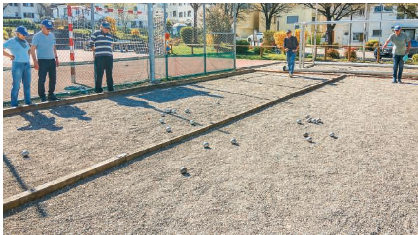
Bei den Pétanque-Freunden Killwangen geht es um Spass und Millimeter

Damit die Berufstätigen aus Killwangen und der näheren Umgebung ebenfalls die Möglichkeit haben,