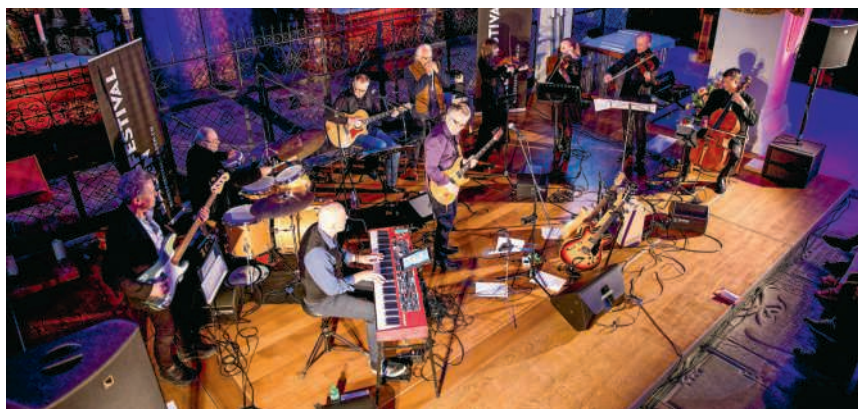
Bluesfestival Baden: Blues 'n' Classic