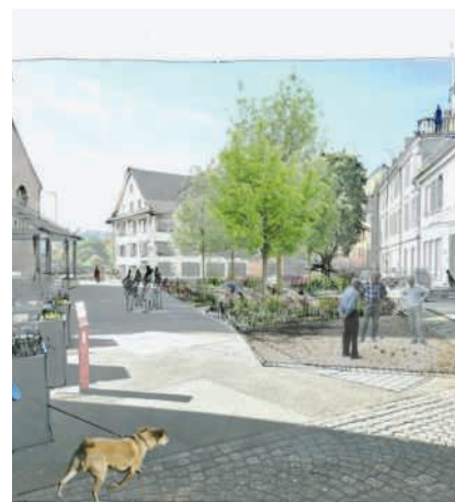
Neugestaltung des Kirchplatzes

Mit der Umgestaltung soll der Platz nicht nur einladender werden, sondern auch eine Verbindung zu Badens Vergangenheit wiederherstellen. Auf Teilen des heutigen Kirchplatzes stand einst nämlich das Agnesen-Spital. Dieses war der Stadt Mitte des 14. Jahrhunderts von der ungarischen Königin Agnes aus dem Geschlecht der Habsburger gestiftet worden und legte den Grundstein für das Badener Spitalwesen. Mit der Umgestaltung des Kirchplatzes sollen die Umrisse des früheren Spitals mit Reihen aus Pflastersteinen nachgezeichnet werden und die Institution so wieder verstärkt ins Bewusstsein der Bevölkerung rücken. Dazu soll die Baumstellung auf dem Platz sowohl mit den Werkleitungen als auch mit dem Mau-