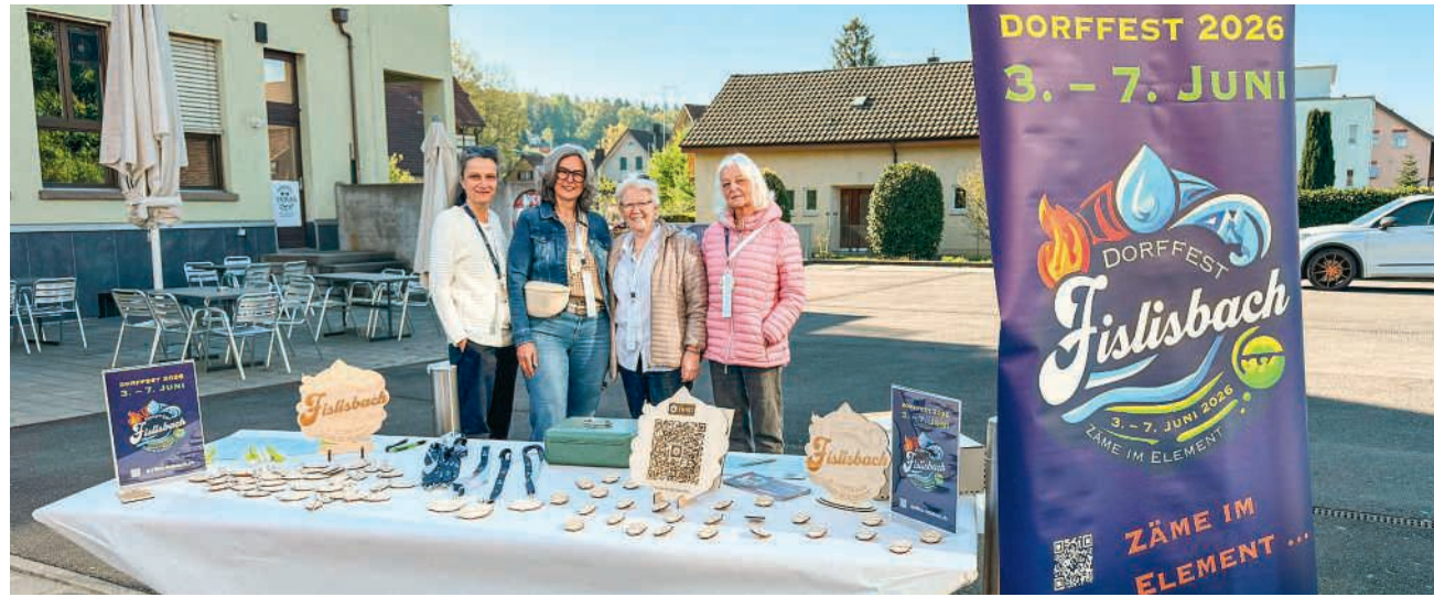
Festplakettenverkauf für das Fislisbacher Dorffest

Auch wer Süßes liebt, kommt auf seine Kosten: Crêpes, italienische Gelati, Waffeln oder hausgemachte Kuchen sowie diverse Kaffeespezialitäten erwarten die Gäste. Am Abend lockt die bunte Barlandschaft mit