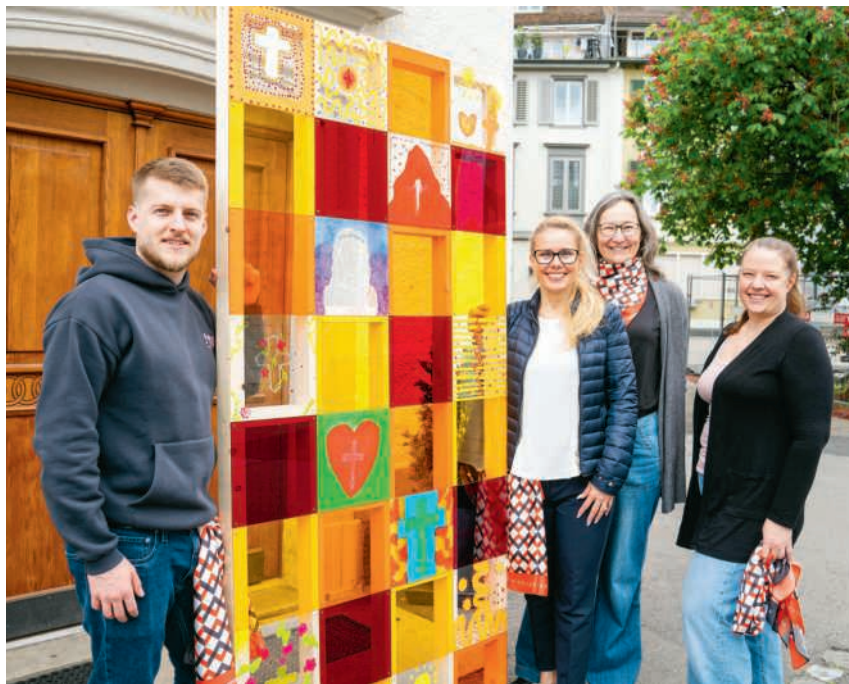
Das Organisationsteam von «Ein Tag wie in Taizé» in Baden

Die Festivitäten zur 500-Jahr-Feier der Badener Disputation nähern sich ihrem Höhepunkt. Dazu zählt sicher auch die Veranstaltung «Ein Tag wie in Taizé» zu Pfingsten, die im Zeichen von Frieden und Hoffnung steht. Dazu kommen Mitglieder der Bruderschaft Communauté de Taizé nach Baden. Sie gehören zu einer ökumenischen Gemeinschaft in Frankreich, die das Miteinander vieler Nationalitäten und Konfessionen lebt. Bekannt ist die Gemeinschaft vor allem durch die ökumenischen Jugendtreffen. Im Rahmen der «Disput(N)ation» laden Brüder von Taizé Jugendliche, junge Erwachsenen und Junggebliebene zur Andacht. Seite 7