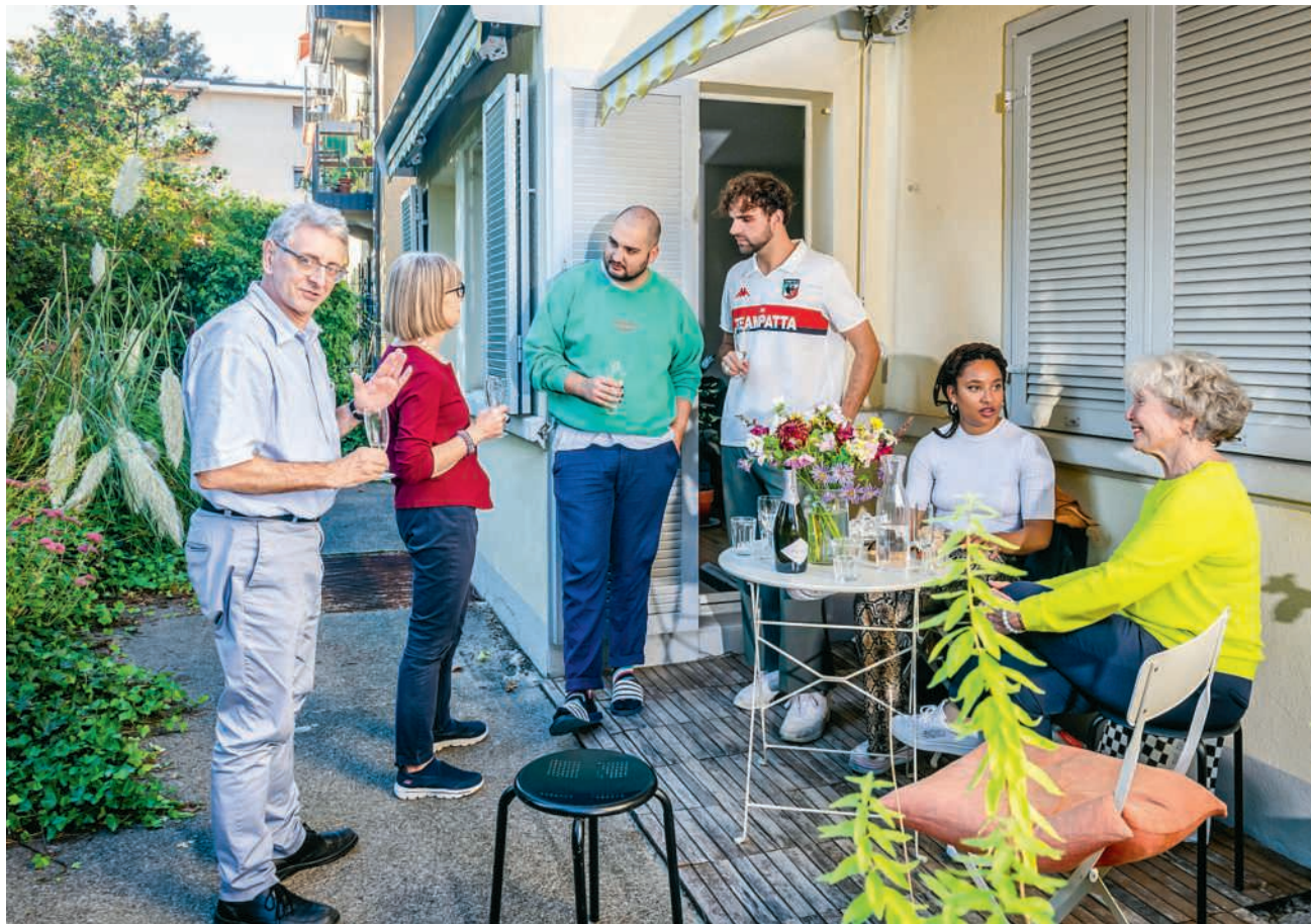
Am 29. Mai ist der Tag der Nachbarschaft

Der Kanton Aargau verfügt vielerorts über eine blühende Nachbarschaftskultur. In vielen Gemeinden gibt es jedes Jahr Dutzende kleiner Feste für die Quartier- oder die Dorfbevölkerung.