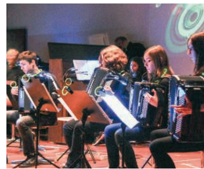
Schülerinnen und Schüler der Musikschule Wettingen

Mit der Gründung einer eigenen Musikschule betrat Wettingen Neuland. So mussten auch nach Aufnahme