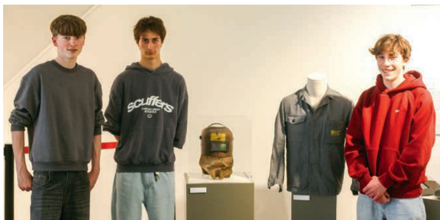
Die Schweissermaske und ihre Geschichte sind neuerdings im Historischen Museum Baden ausgestellt

Das Projekt hat bereits über 70 Beiträge hervorgebracht und fördert nicht nur das historische Verständnis der Jugendlichen, sondern liefert teilweise auch neue wissenschaftliche Erkenntnisse. Untersucht wurden unter anderem ein Fahrrad aus dem Jahr