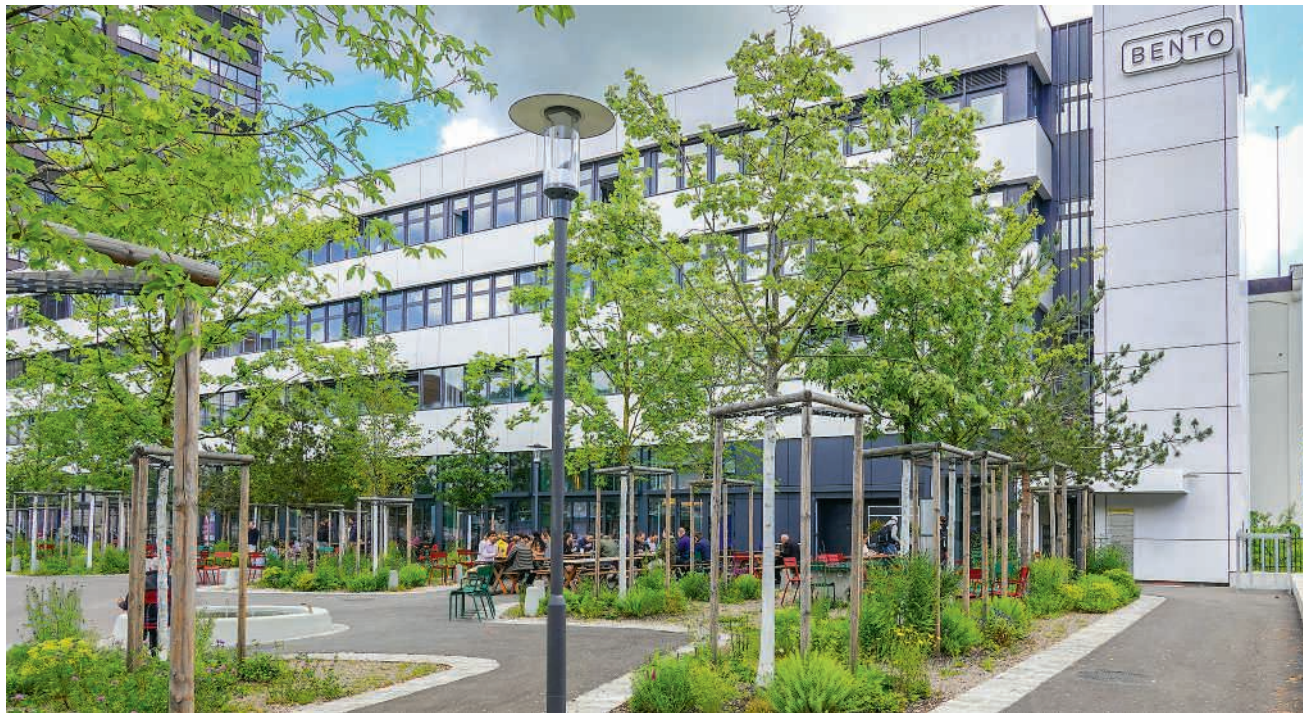
Die Markthalle im Bento-Gebäude am Brown-Boveri-Platz

Die feierliche Eröffnung der «Hallo Halle» findet am 30. Mai statt. Bis dahin läuft der Betrieb an, damit man langsam auf Touren kommt. Und keine Angst: dank mitgebrachter Tupperware wurden am Ende alle Lebensmittel ihrem ursprünglichen Zweck zugeführt.