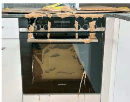
Neubau beschädigt

Wenn das Neubauprojekt abgeschlossen ist, sollen die beiden bestehenden Verbrennungsöfen rückgebaut werden. Dadurch entsteht auf dem Gelände der KVA wieder dringend benötigter Platz. So sind für die KVA in Turgi etwa Energiespeicher ange-dacht, genauso Mülllager ausserhalb der eigentlichen KVA. Beide sollen dereinst dazu dienen, dass die KVA dann Energie produzieren beziehungsweise in die Netze speisen kann, wenn diese am stärksten nachgefragt wird – also in den Morgenstunden und im Winter. «Gerade der Bauabfall aber fällt natürlich eher im Sommer an», weiss Martin Theiler. «Deshalb ist Abfallspeicherung für alle Kehrichtverwertungsanlagen ein Thema.» Derweil sind Tagesgang-Wärmespeicher bereits Teil des Projektes KVA 2030 und werden hier bereits mitgeplant und realisiert. Sie sollen kurzfristig Bedarfsspitzen abdecken. Nachts produzierte Energie könnte dann tagsüber die Netze speisen. So will die KVA Turgi fit werden für die Zukunft.