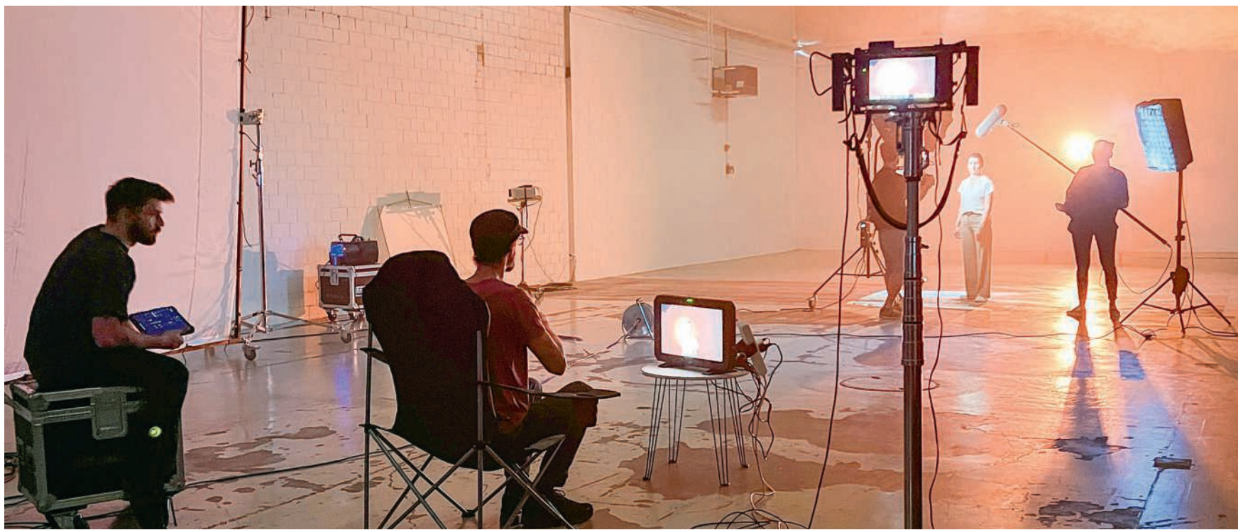
Ruhe am Set

In unserer Branche gab es sehr viele Neuerungen. Hätte man mir vor 20 Jahren gesagt, dass jeder Mensch täglich freiwillig zwei, drei Stunden in