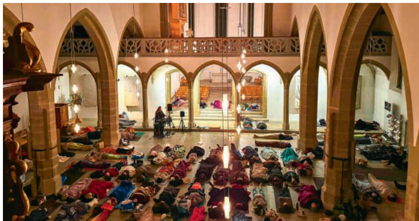
Liegekonzert des Vereins Innehalten in der Stadtkirche Aarau

Frieden beginnt nicht zwischen Menschen, er beginnt bei jeder und jedem selbst. Wer achtsam mit sich umgeht und sich mit Mitgefühl begegnet, findet leichter einen friedlichen Zugang zu anderen. Die über 30 Freiwilligen, die sich bei Innehalten engagieren, haben es sich zum Ziel gesetzt, ihren Mitmenschen Achtsamkeit und Mitgefühl als wertvolle Ansätze dafür