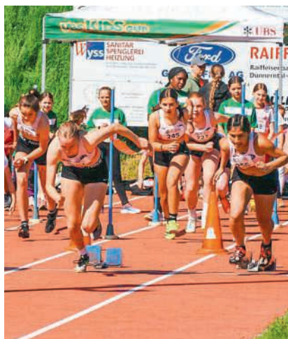
Achtung, fertig, Jugitag!

Erwartet werden im Gebiet Brühl etwa 700 Kinder aus den Regionen Baden und Zurzach und sogar einige ausserkantonale Jugendriegen, die in verschiedenen Leichtathletik-, Turn- oder Staffeldisziplinen ihr Bestes geben wollen und – ganz wichtig – einen unvergesslichen, freudigen Tag im Dorf am Wasserschloss verbringen möchten. Einzige Schwierigkeit: In unmittelbarer Nähe der Wettkampfanlagen wird just an diesem Tag auch das Feldschiessen stattfinden. Das