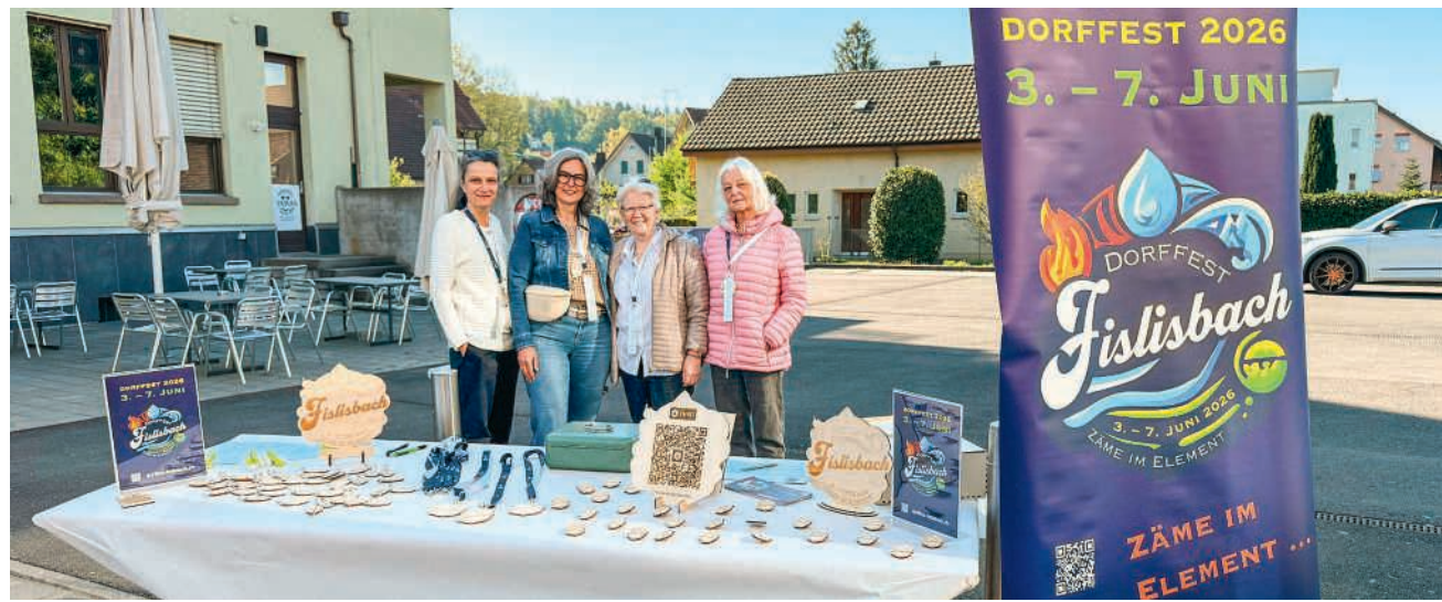
Festplakettenverkauf für das Fislisbacher Dorffest

Auch wer Süßes liebt, kommt auf seine Kosten: Crêpes, italienische Gelati, Waffeln oder hausgemachte Kuchen sowie diverse Kaffeespezialitäten erwarten die Gäste. Am Abend lockt die bunte Barlandschaft mit