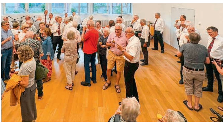
Viele Gäste am Geburtstagskonzert