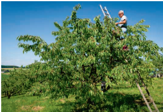
Die Ernte in der Höhe ist zeitaufwändig.