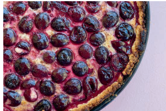
Hochstammchriesi eignen sich für leckere Wähen.