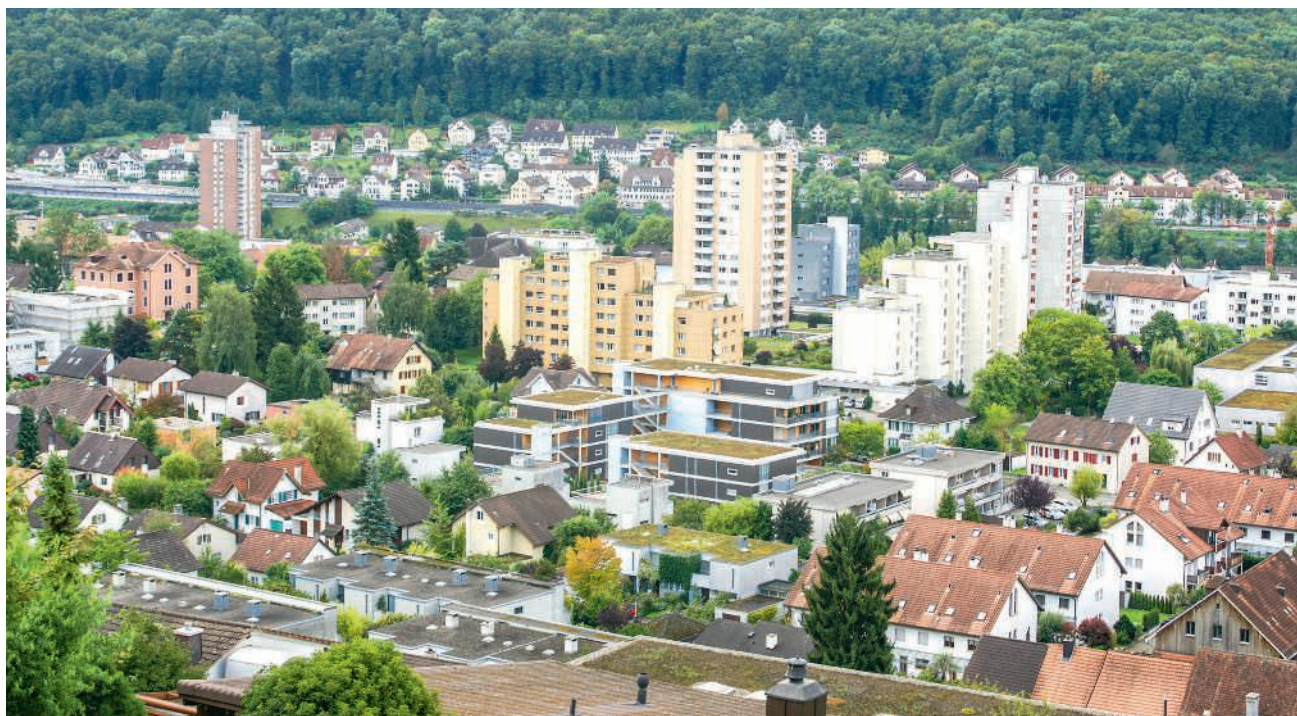
Keine Zonenverschiebung beim öffentlichen Verkehr innerhalb der Gemeinde

Neben den Finanzen beschäftigt die Schulraumplanung den Einwohnerrat.