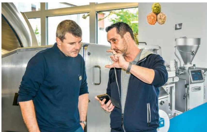
So wird die Wurst gemacht

Geschichtsträchtig ist zudem das Familienunternehmen Neumeyer AG mit über 55 Jahren Erfahrung in der Lebensmitteltechnik, das an diesem Abend Gastgeber war und die Besuchenden mit einem Apéro empfing. Das Unternehmen entwickelt und vertreibt hochwertige Maschinen sowie massgeschneiderte Lösungen für die gewerbliche und industrielle Nahrungsmittelherstellung. Zu den Kunden zählen Betriebe aus den Bereichen Fleischverarbeitung, Bäckerei und Konditorei, Käse- und Molkereiproduktion, Convenience-Food sowie Gemüse- und Früchteverarbeitung.