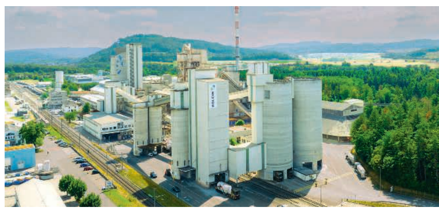
Holcim-Zementwerk in Siggenthal