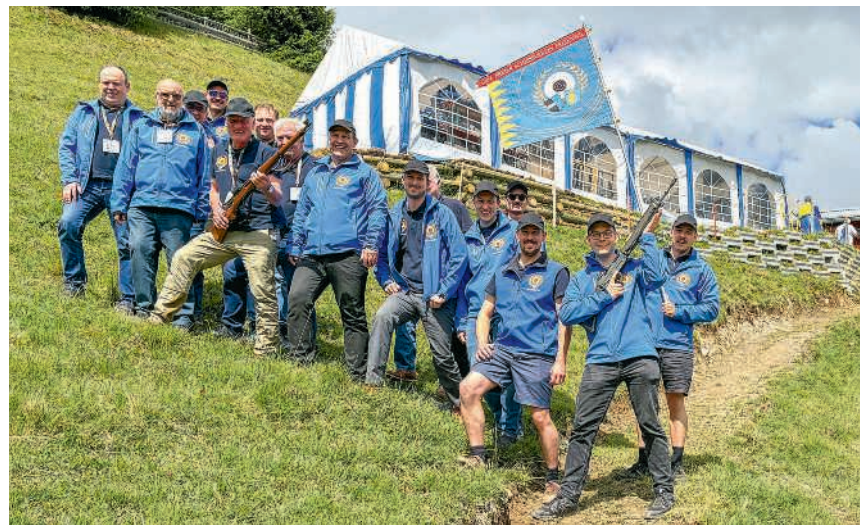
Die treffsicheren Schützen aus Freienwil