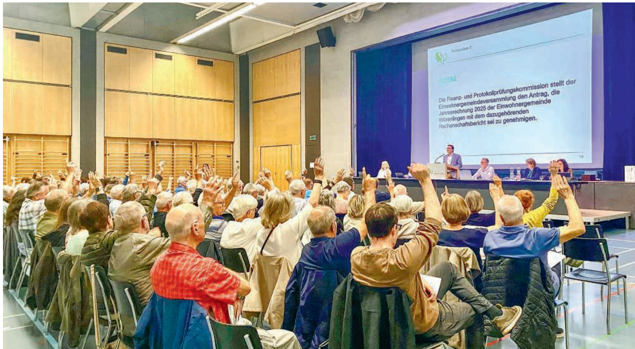
81 Stimmberechtigte folgten der Einladung in die Mehrzweckhalle