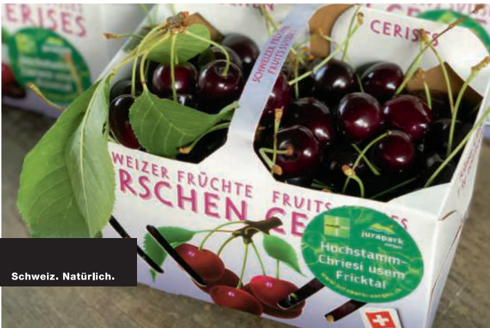
Frische Hochstamm-Chriesi aus dem Fricktal