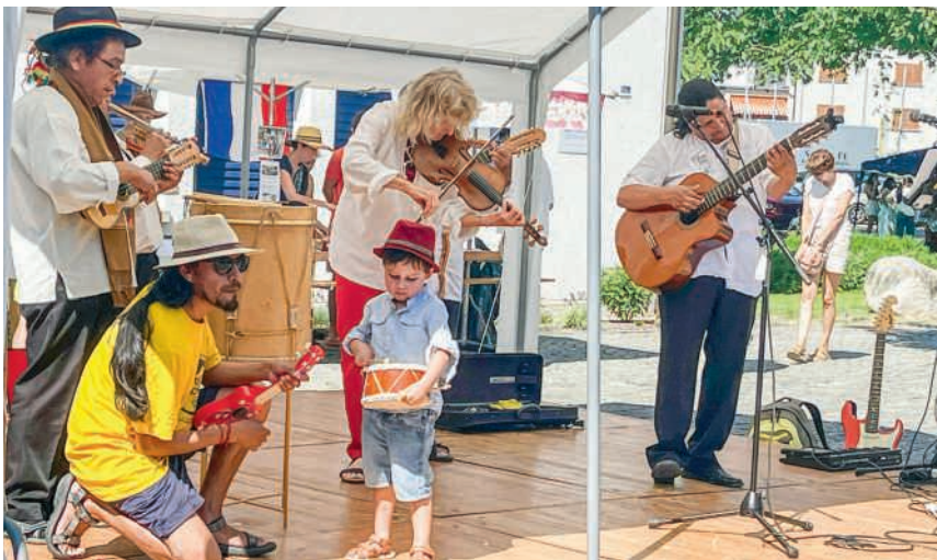
Die Musik als Bindeglied der Kulturen