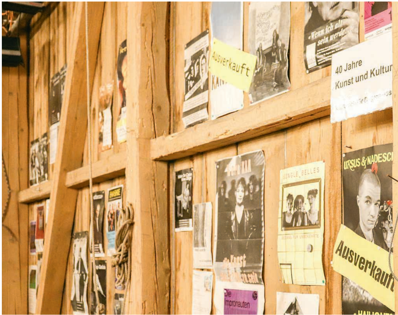
Erinnerungen an vier Jahrzehnte in der Kulturschüür Degermoos