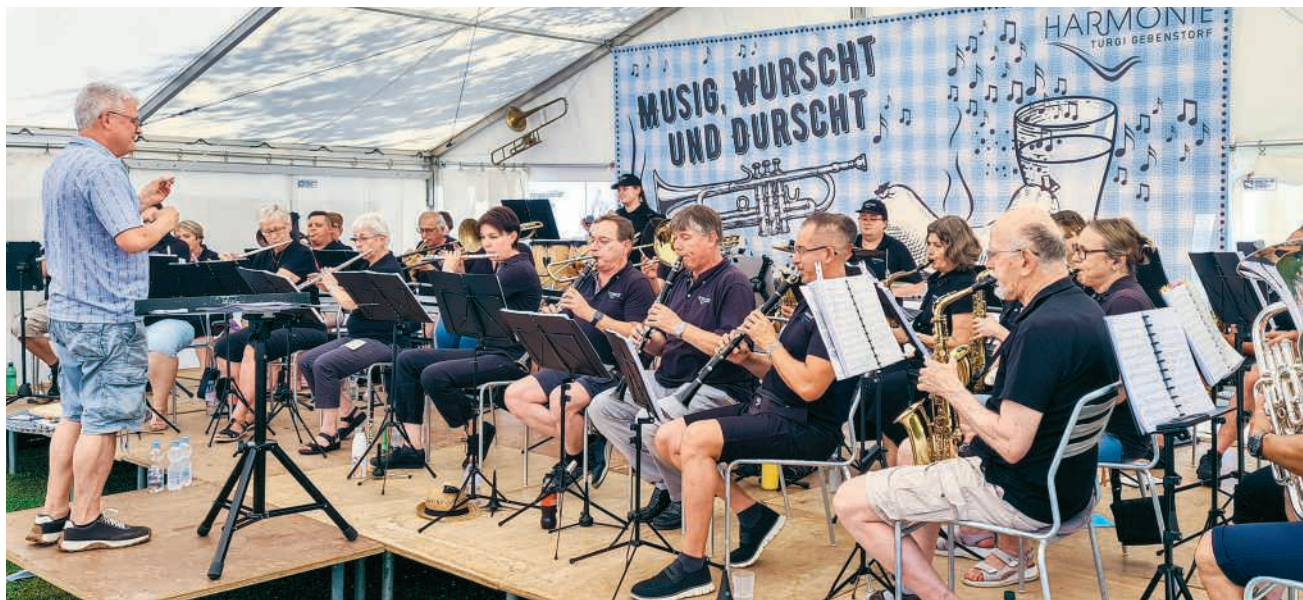
Die Harmonie Turgi Gebenstorf zelebrierte in Vogelsang schon letztes Jahr den Genuss

In der Regel steht bei den Auftritten der Blasmusikformation die Musik im Vordergrund. So zum Beispiel beim letzten Jahreskonzert unter dem Thema «Musikalische Zeitreise». Bei «Musig, Wurscht und Durscht» geht es dagegen mindestens ebenso sehr um Geselligkeit. Musikalisch wird der Anlass ein abwechslungsreiches Programm mit drei verschiedenen Formationen bereithalten, die für Unterhaltung sorgen. Die Harmonie Turgi Gebenstorf übernimmt den Auftakt zu diesem rund fünfstündigen Nachmittagsevent, der am späten Vormittag um 11 Uhr beginnt. Sie wird mit Songs und Liedern von Udo Jürgens, Abba und zahlreichen weiteren Musikerinnen und Musikern überraschen.