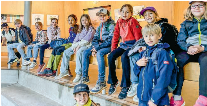
Die Kinder im Elefantenhaus