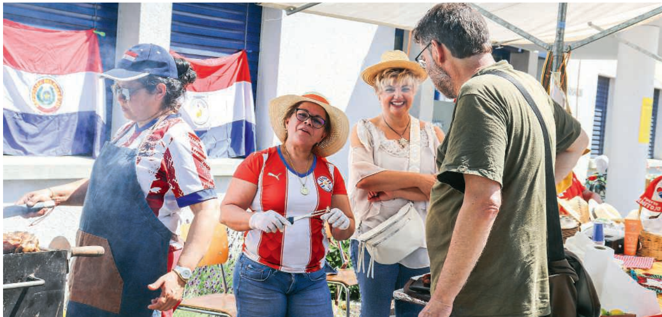
Über 20 Anbieter präsentierten Spezialitäten aus verschiedenen Ländern

Im Jubiläumsjahr, der Trägerverein besteht seit 25 Jahren und organisierte das Fest zum 20. Mal, durften sich die Gäste über besondere Programmpunkte freuen. Auch die Kinder kamen auf ihre Kosten: Schminken, Henna-Tattoos oder Aktivitäten mit der Pfadi sorgten für Unterhaltung und Abwechslung. Das Fest hinterliess nicht nur schöne Eindrücke, sondern auch das Gefühl, dass gelebte Vielfalt verbindend und bereichernd ist.