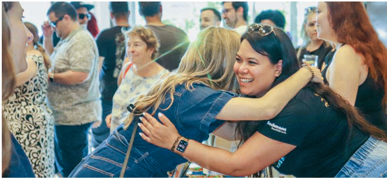
Der Anlass stand unter dem Motto «Lachen für den guten Zweck»

Die Mitglieder arbeiten ehrenamtlich und finanzieren mit Spenden den Betrieb des Milele Elimu Centre, in dem heute etwa 300 Kinder vom Kindergarten bis zur 6. Klasse unterrichtet werden. Vor Ort führt ein kenianischer Schulleiter die Schule, während sich das Team in der Schweiz um Fundraising, Organisation und Kommunikation kümmert. Die Mission ist klar: Jedes Kind soll die Möglichkeit erhalten, seine Schulbildung abzuschliessen und sich danach eine Zukunft aufzubauen. Diese Perspektive soll von Generation zu Generation weitergegeben werden.