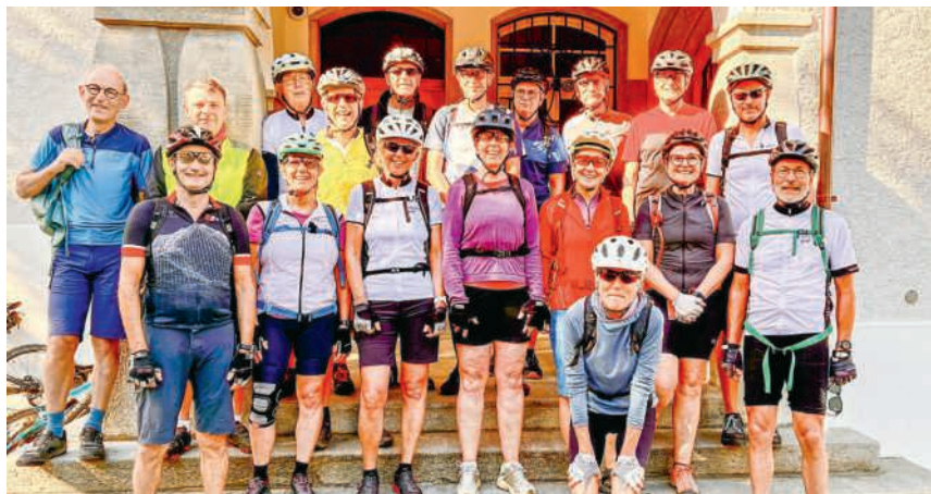
Vor dem altherwürdigen Schulhaus 1911

Die rund 70 Kilometer und knapp 1000 Höhenmeter umfassende Tour war mit vielen Hügeln und Täler gespickt und forderte von den Bikerinnen und Bikern einige Schweisstropfen und Kalorien. Gestartet wurde mit einer eher flachen Einrolletappe via Birnenstorf. Im Reussstädtchen Mellingen gab es einen Kaffeehalt.