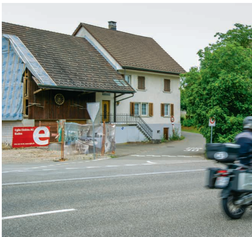
Die Einmündung der Hofwiesstrasse in die Landstrasse ist nicht optimal – insbesondere da neue Wohnüberbauungen künftig zu Mehrverkehr führen

Ein anderes Geschäft, das im Zusammenhang mit der Sanierung der Landstrasse steht, ist eine Neugestaltung der Einmündung der Hofwiesstrasse. «Schon heute ist sie punkto Verkehrssicherheit nicht ideal», begründete Amstutz den 260 000-Franken-Kredit. «Mit geplanten Wohnüberbauungen muss zudem mit einem deutlich höhe-