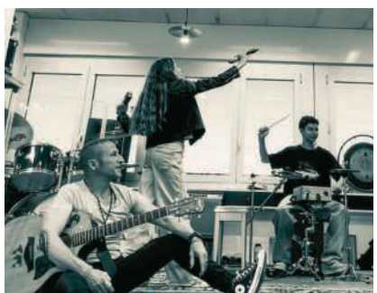
Mitglieder der Band die Lentinis