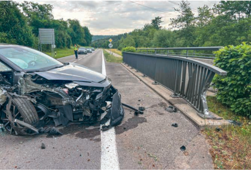
Ein Unfall mit grossem Sachschaden