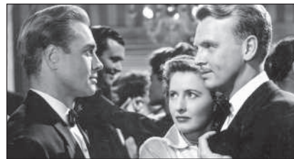
No Man of Her Own, US 1950, DVD