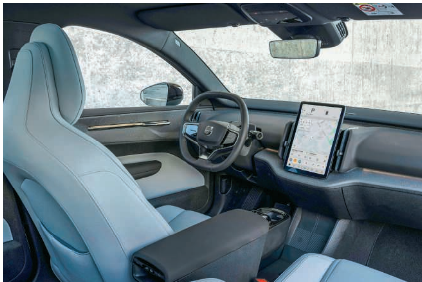
Der Innenraum des Volvo EX30

Ebenfalls zu erwähnen ist die neue Konkurrenz aus China wie die beiden