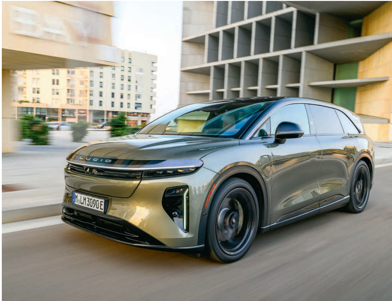
Eine Alternative zu Tesla? Der Lucid Gravity

Bezüglich Platz und Reichweite kann der ebenfalls über fünf Meter lange Kia EV9 nicht ganz mithalten, obwohl er dank seiner kastenförmigen Karosserie ein sehr grosszügiges Kofferraumvolumen mit maximal 2393 Litern aufweist und mit einer Batterieladung respektable 563 Kilometer weit kommt. Dafür ist der Koreaner deutlich günstiger: Das Basismodell startet bei 64 450 Franken und ist damit mehr als 40 000 Franken billiger als die beiden Ame-