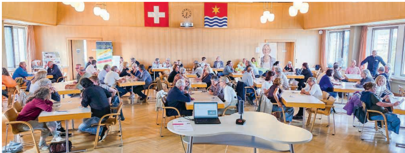
Eingeladen waren Personen, die in diesem oder im letzten Jahr das ordentliche AHV-Alter erreicht haben