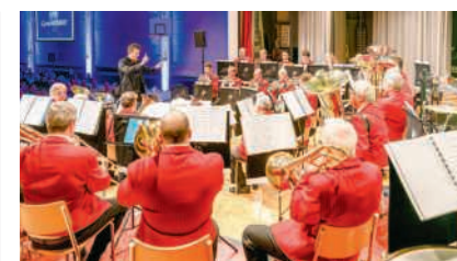
Brassband Badenia Untersiggenthal

Zur Klärung der Umstände sucht die Kantonspolizei Personen, die Beobachtungen gemacht haben oder Angaben zum Vorfall machen können. Hinweise nimmt der Stützpunkt Baden entgegen (056 200 11 11 oder stuetzpunkt.baden@kapo.ag.ch). Meldungen können auch bei jedem anderen Polizeiposten gemacht werden. RS