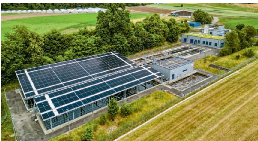
Die neue Photovoltaikanlage über den Nachklärbecken

Ohne Gegenstimmen genehmigte die Versammlung den Kauf von 188 Aktien der Regionalen Verkehrsbetriebe Baden-Wettingen (RVBW) zu je 1000 Franken. Bisher bezog Birmenstorf als Vertragsgemeinde Transportleistungen der RVBW. Nun gehört sie zu den Mitbesitzerinnen und darf die Geschicke des Transportunternehmens mitbestimmen.