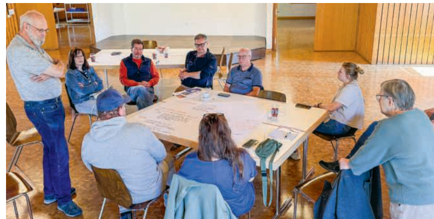
Engagierte Diskussion im Gemeindegarten: Teilnehmende des Forums Prisma sammeln Ideen zum Wohn- und Lebensraum in Gebenstorf

Anschliessend ging es in zwei Kleingruppen weiter. Auf Flipcharts wurden Ideen festgehalten und enga-