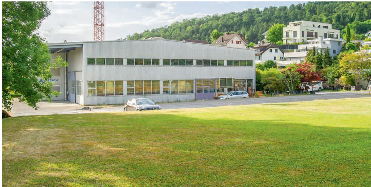
Süddöstlich der Firma Tratson, auf einem Teil des Sport- und Spielplatzes Hübel, soll ein neuer Werkhof für das Bauamt der Gemeinde entstehen