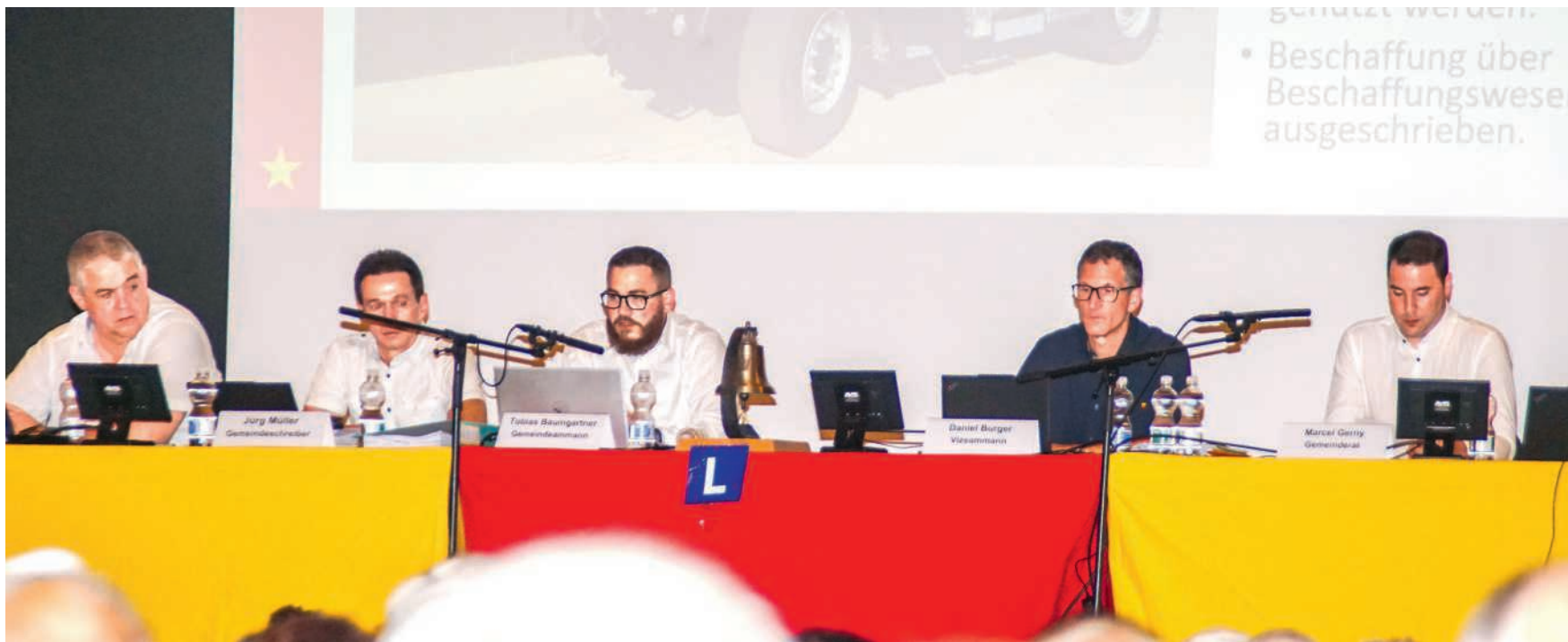
Der Gemeinderat Neuenhof führte durch eine voll befrachtete Gemeindeversammlung

Um solche Kreditüberschreitungen künftig zu vermeiden, wurde 2025 ein Controlling über Verpflichtungs- und Budgetkredite aufgebaut, das ein