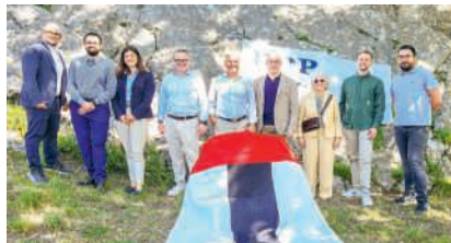
Mitglieder der FDP-Partei Baden mit Gästen beim Treffen auf der Ruine Stein