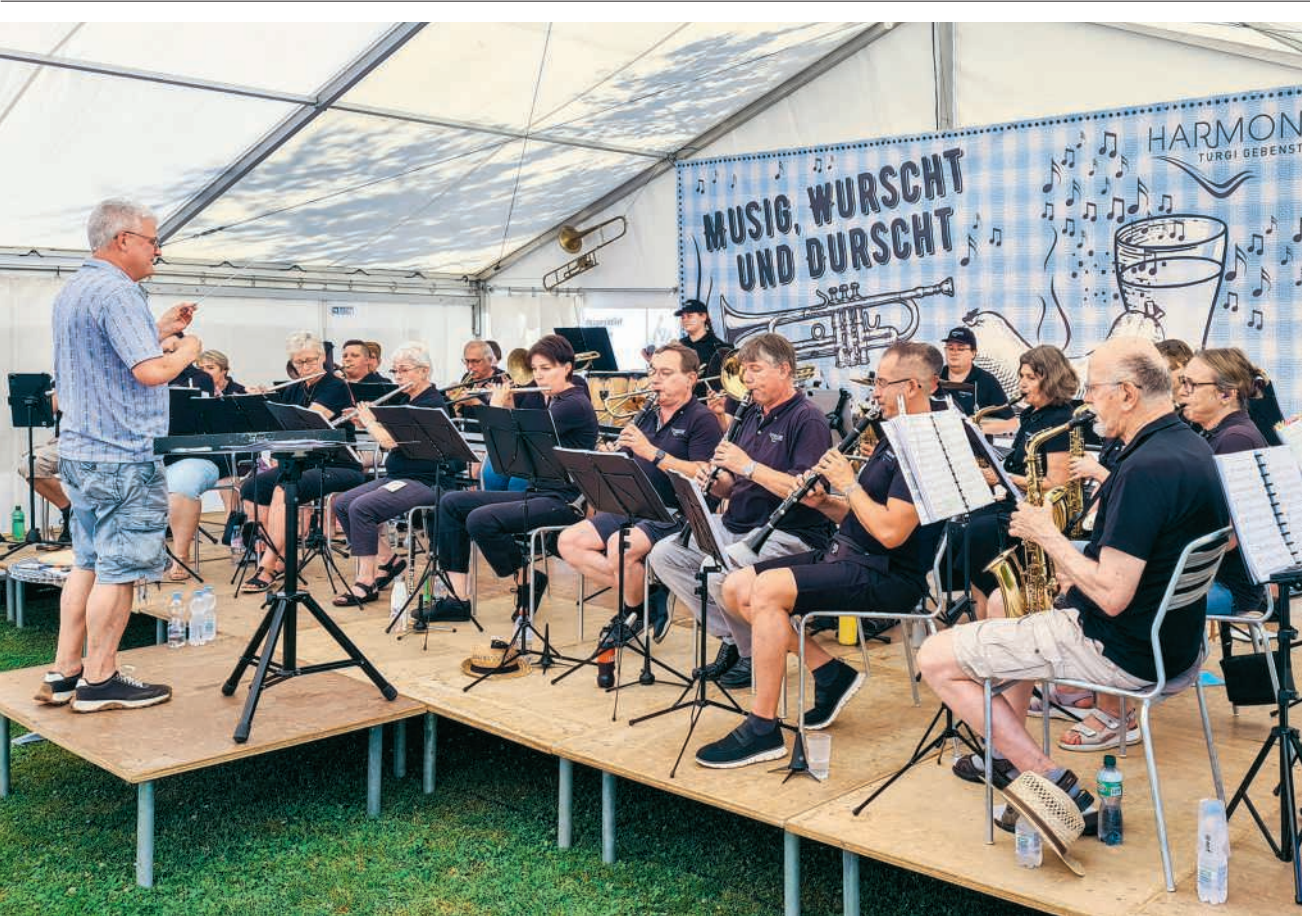
Die Harmonie Turgi Gebenstorf feierte in Vogelsang schon letztes Jahr den Genuss