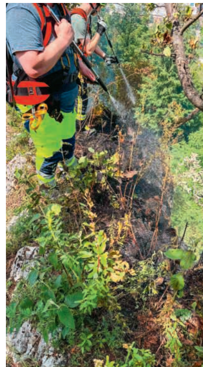
Ungewöhnlicher Löscheinsatz in steilem Gelände

Im Verlauf des Donnerstags begutachteten Spezialisten der Brandursachenermittlung der Kantonspolizei Aargau den Brandplatz. Dabei wurde eine Feuerstelle unmittelbar auf dem Grat am Rand des Brands festgestellt. Gemäss jetzigem Kenntnisstand geht die Kantonspolizei davon aus, dass am