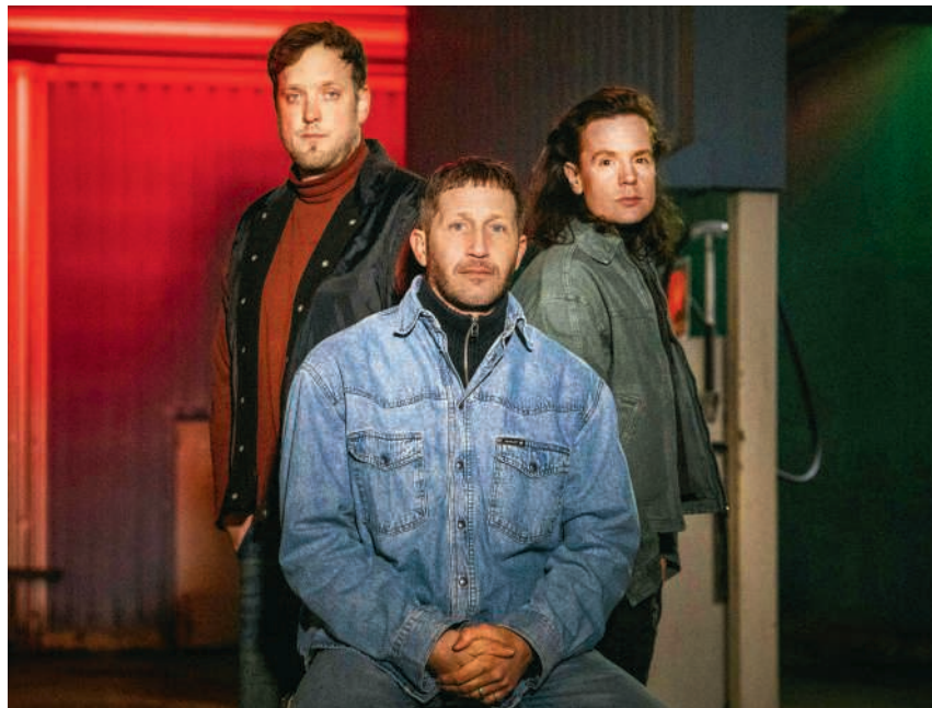
Der Auftritt von Baba Shrimps zählt zu den Highlights des diesjährigen Wettiger Fäschts

Auch musikalisch setzt das Fest Akzente: Ein Highlight ist das Kinderkonzert am Sonntagnachmittag, das auf der Open-Air-Bühne im Brühlpark stattfindet und den Festsonntag für die jüngsten Gäste abrundet. Am Samstagabend tritt der Zürcher Mundart-Reggae-Künstler Phenomen auf, am Sonntag folgt die Zürcher Popband Baba Shrimps. Die vom Verein Wettiger Open Air betriebene Bühne versteht sich zudem als Plattform für aufstrebende Künstlerinnen und Künstler aus der Region. Die Auftritte der beiden Hauptacts werden durch die Unterstützung lokaler Partner ermöglicht. Ein Herzstück des Wettiger Fäschts sind die traditionellen Festbeizen der Wettinger Vereine. Mit ihren indivi-